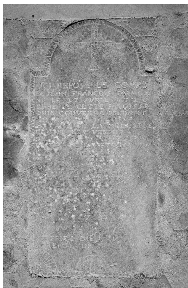
Vue générale de la dalle.