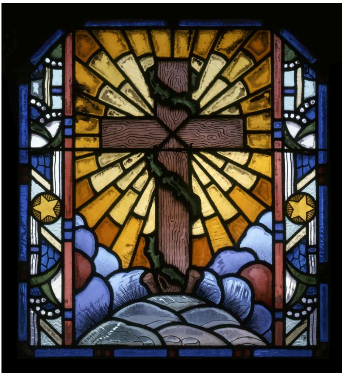
Vue de la verrière axiale de la chapelle, signée C. Roland, Aulnoye, Nord, et représentant la Croix au sommet du Golgotha.