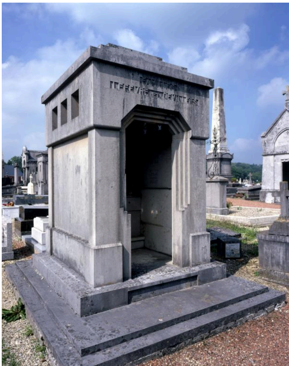
Vue de la chapelle funéraire de style Art Déco.