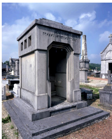
Vue de la chapelle funéraire de style Art Déco.