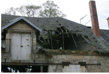
Etat actuel du bâtiment accolé au logis.