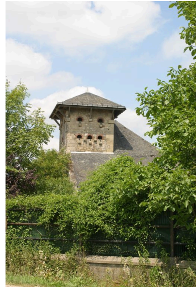
Vue du pigeonier. IVR22_20030202302NUCA