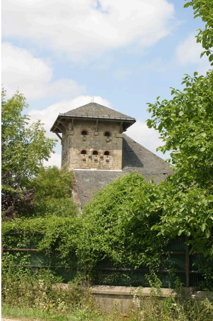
Vue du pigeonnier.