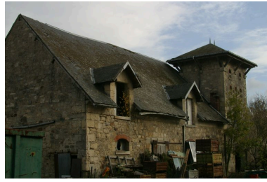
Vue d'un des bâtiments agricoles accolé au pigeonier. IVR22_20030202920NUCA