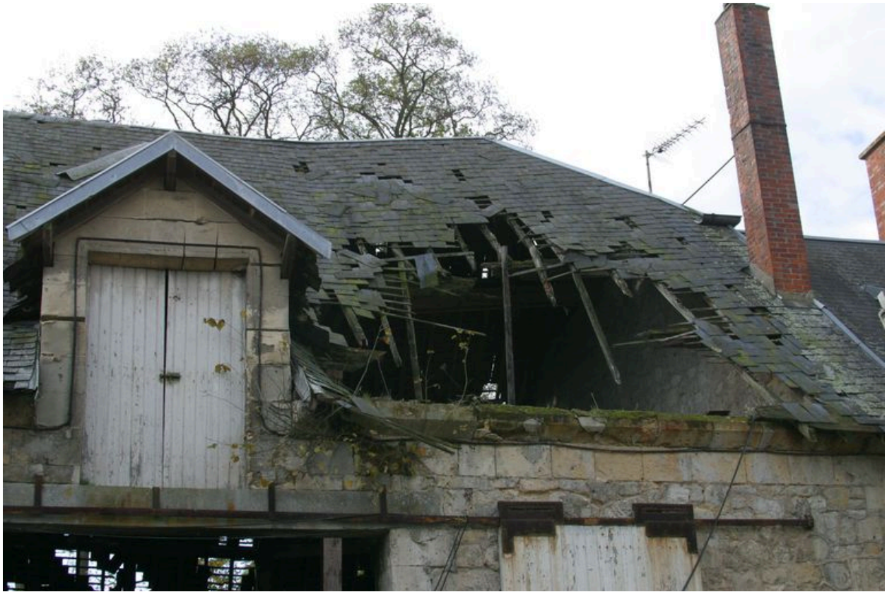
Etat actuel du bâtiment accolé au logis.