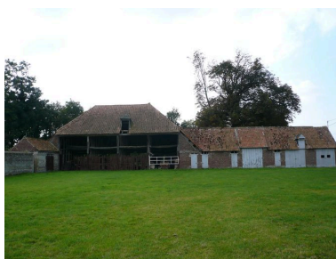
Vue de la charretterie et des étables occupant le côté occidental de la cour.