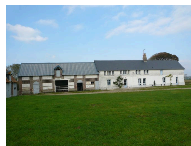
Vue du logis et des étables au nord de la cour.