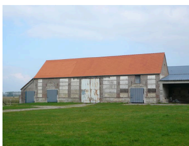
Vue de la grange à l'est de la cour.