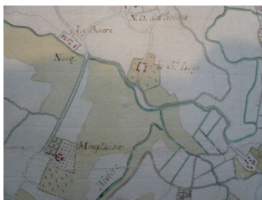
Plan de la ferme du Grand Logis au 18e siècle.