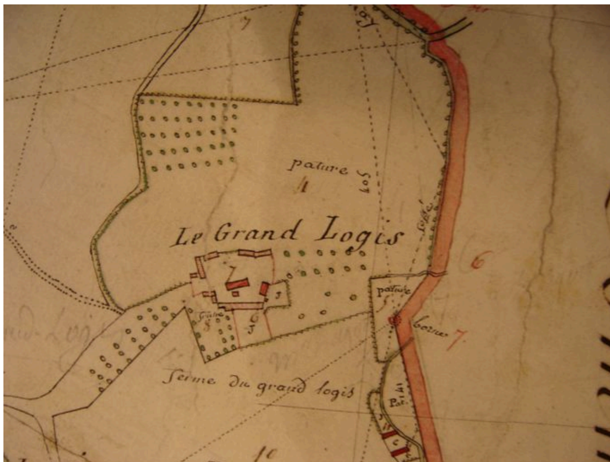
Plan de la ferme du Grand Logis en 1805 extrait du cadastre par masse de culture de la commune.