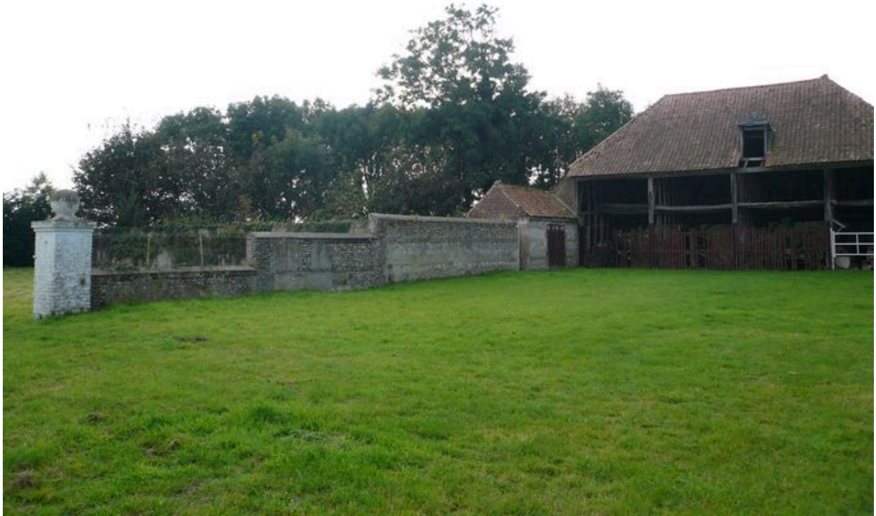
Vue du portail et de la remise au sud de la cour.