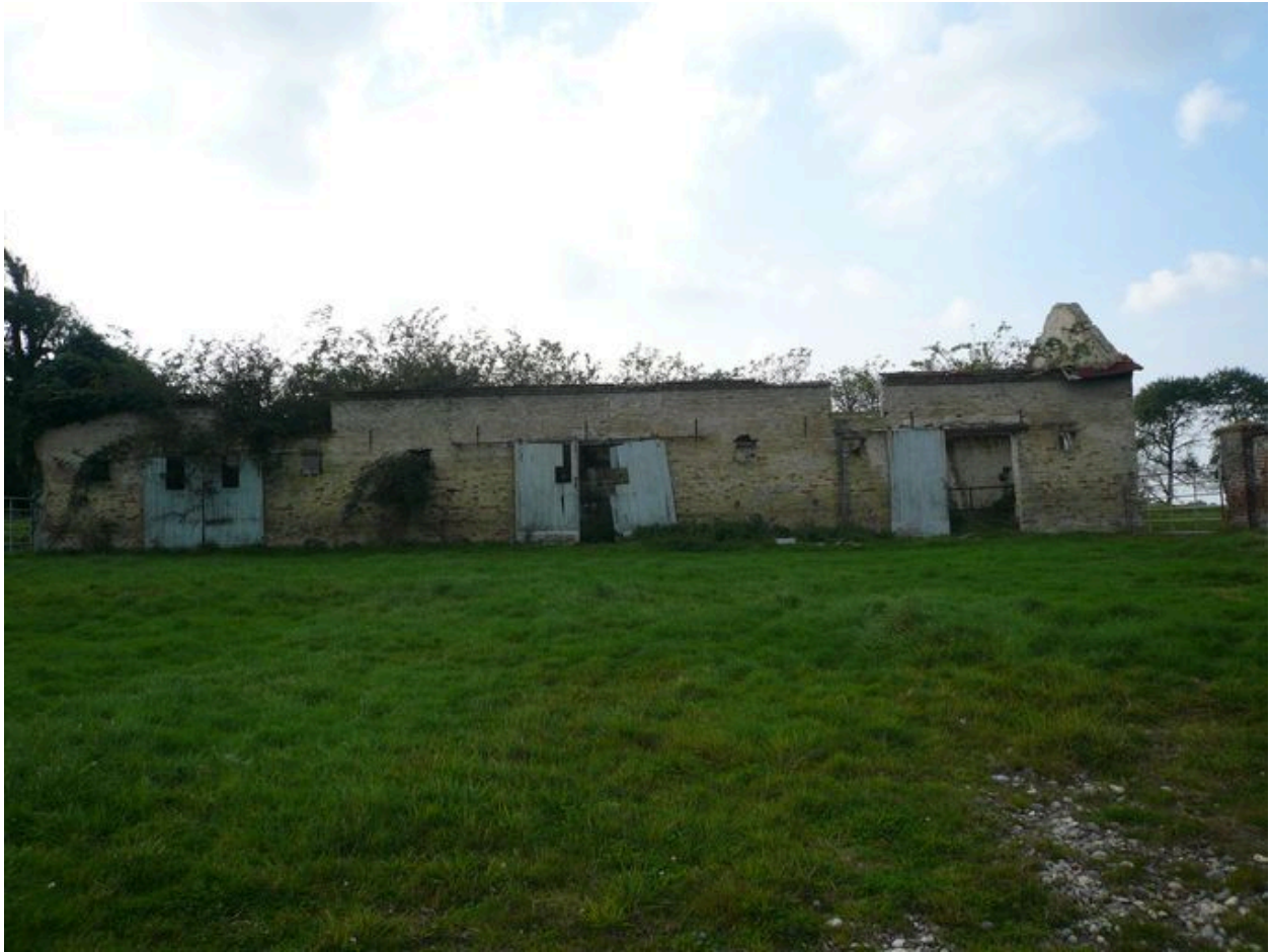
Vue des étables menacées au nord-ouest de la propriété.