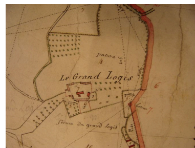
Plan de la ferme du Grand Logis en 1805 extrait du cadastre par masse de culture de la commune.