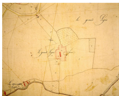
Extrait du cadastre napoléonien présentant le plan de la ferme du Grand Logis en 1828.