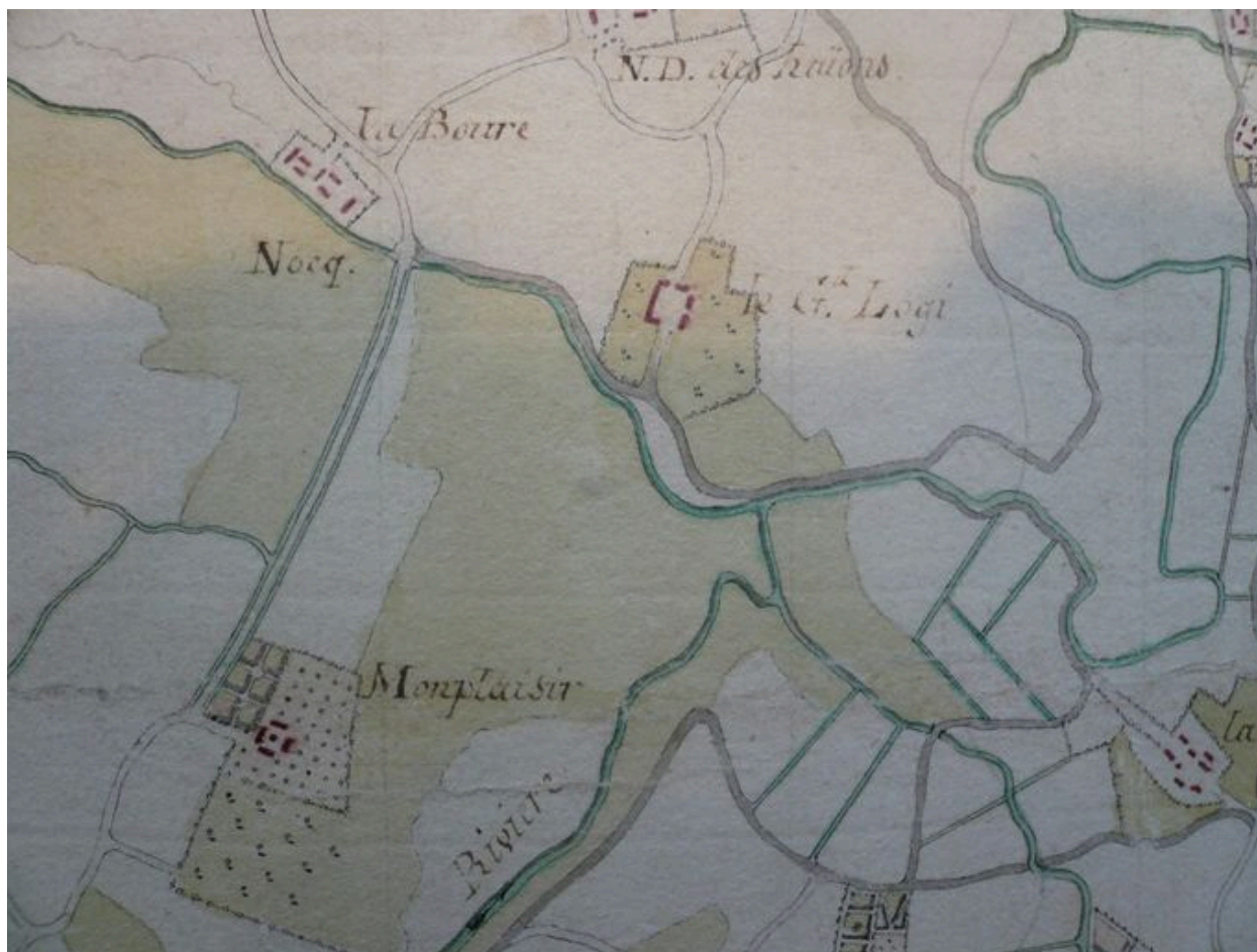
Plan de la ferme du Grand Logis au 18e siècle.