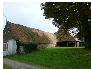
Vue postérieure des étables et de la charretterie.