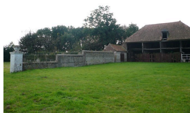
Vue du portail et de la remise au sud de la cour.