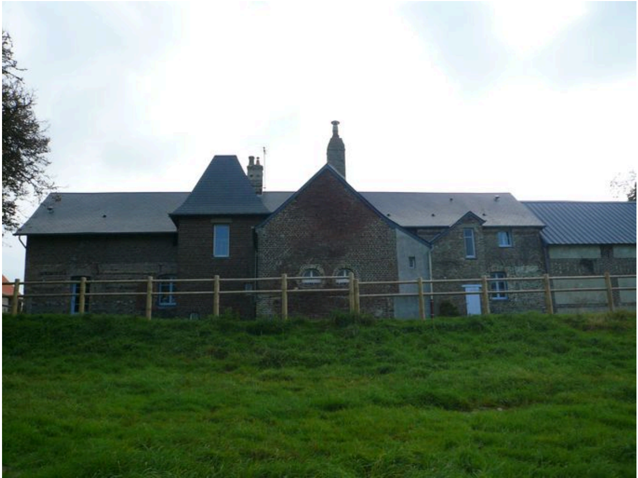
Vue postérieure du logis.