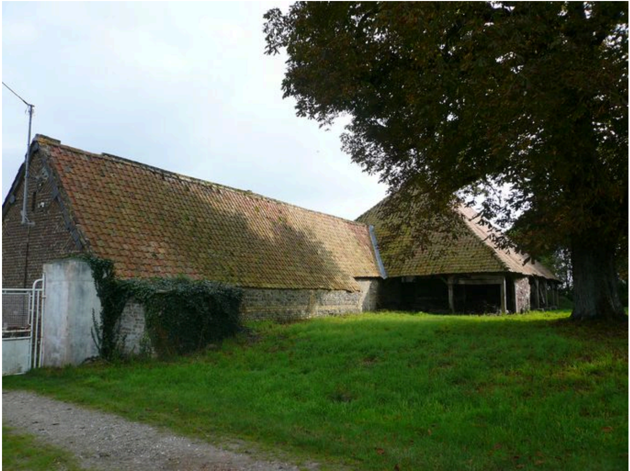
Vue postérieure des étables et de la charretterie.