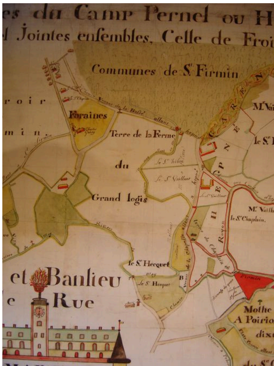
Etendue des terres de la ferme du Grand Logis au 18e siècle.