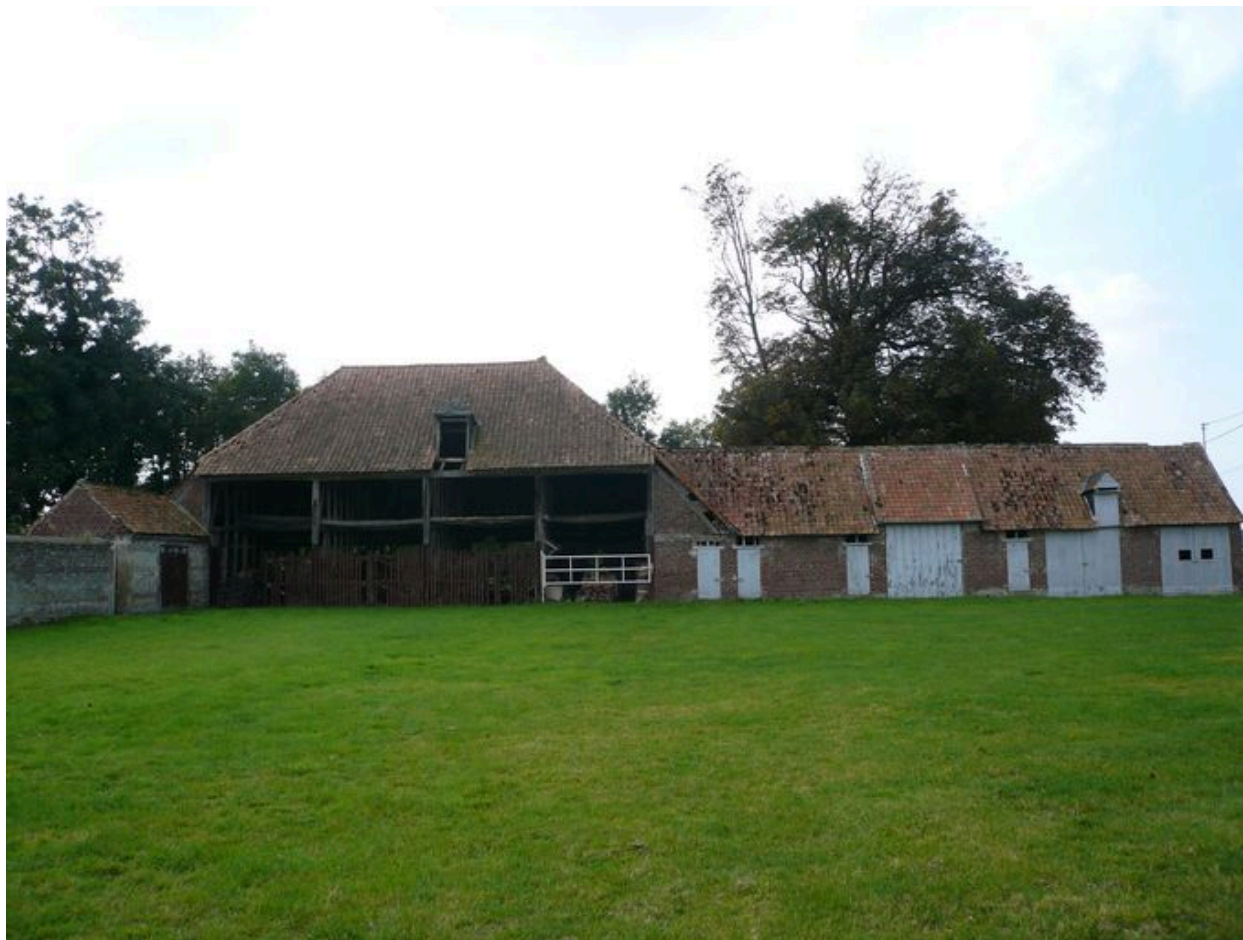
Vue de la charretterie et des étables occupant le côté occidental de la cour.