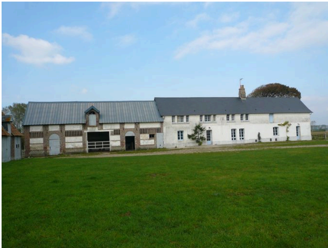
Vue du logis et des étables au nord de la cour.