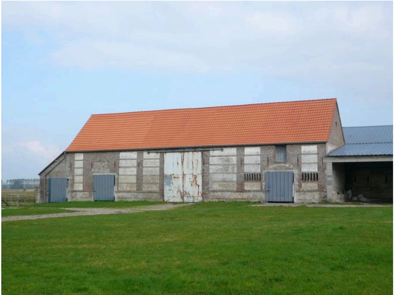
Vue de la grange à l'est de la cour.