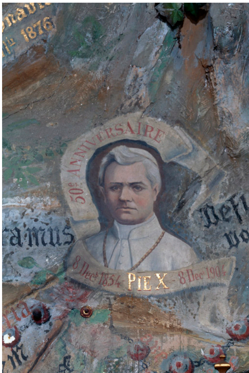
Détail : portrait du pape Pie X.