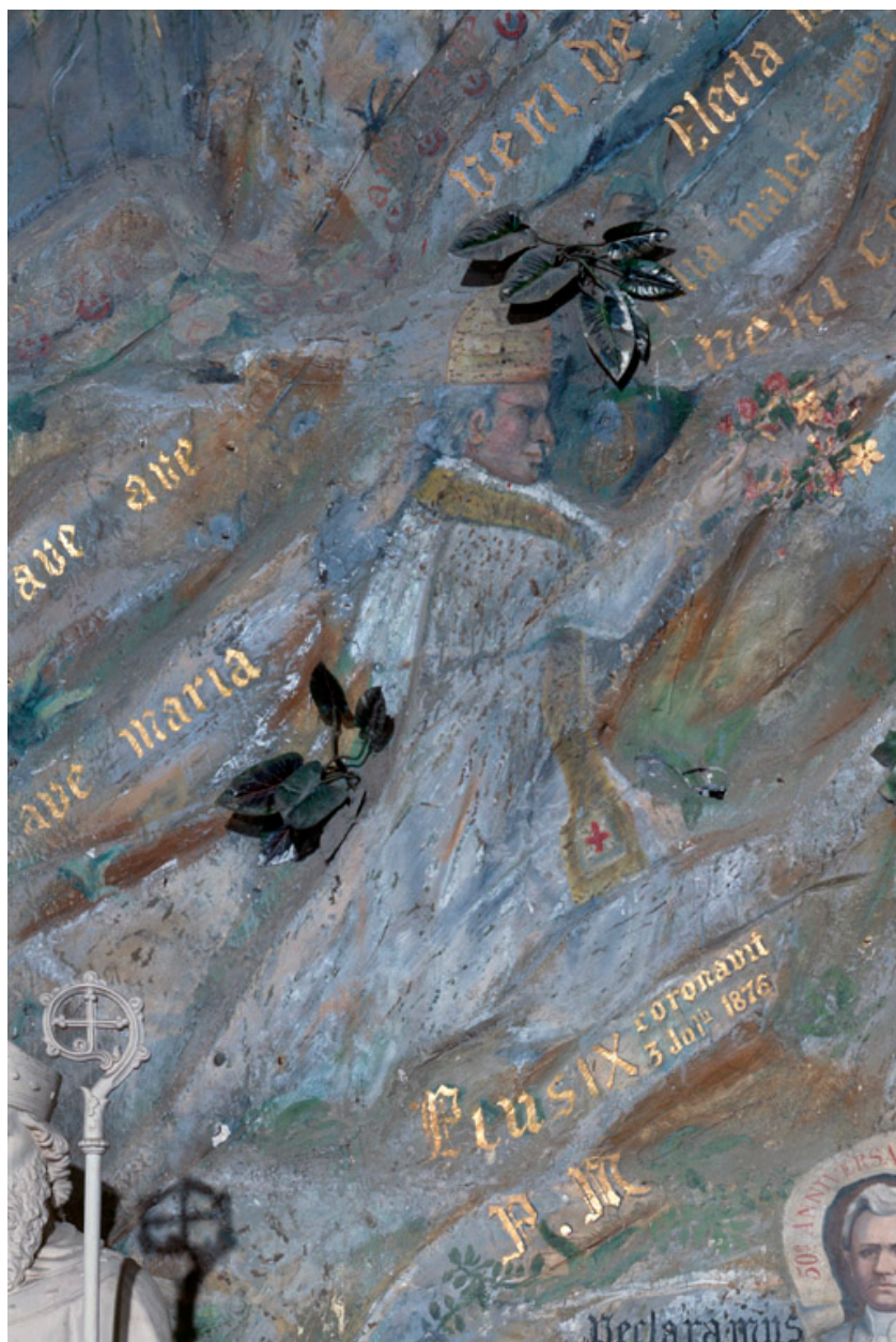
Détail : portrait du pape Pie IX.