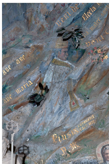
Détail : portrait du pape Pie IX. IVR22_19988000407XA