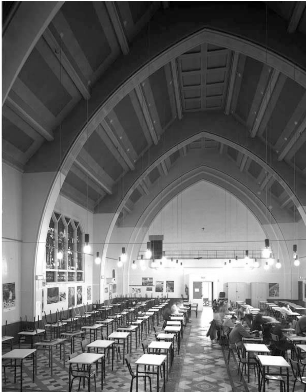
Vue générale intérieure de la chapelle depuis le chœur.