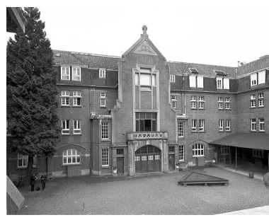
Vue générale de la cour, de l'aile sud et de la chapelle. IVR31_20015902282V