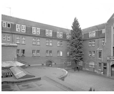
Vue générale de la cour, de l'aile orientale et de l'angle sud-est. IVR31_20015902280V