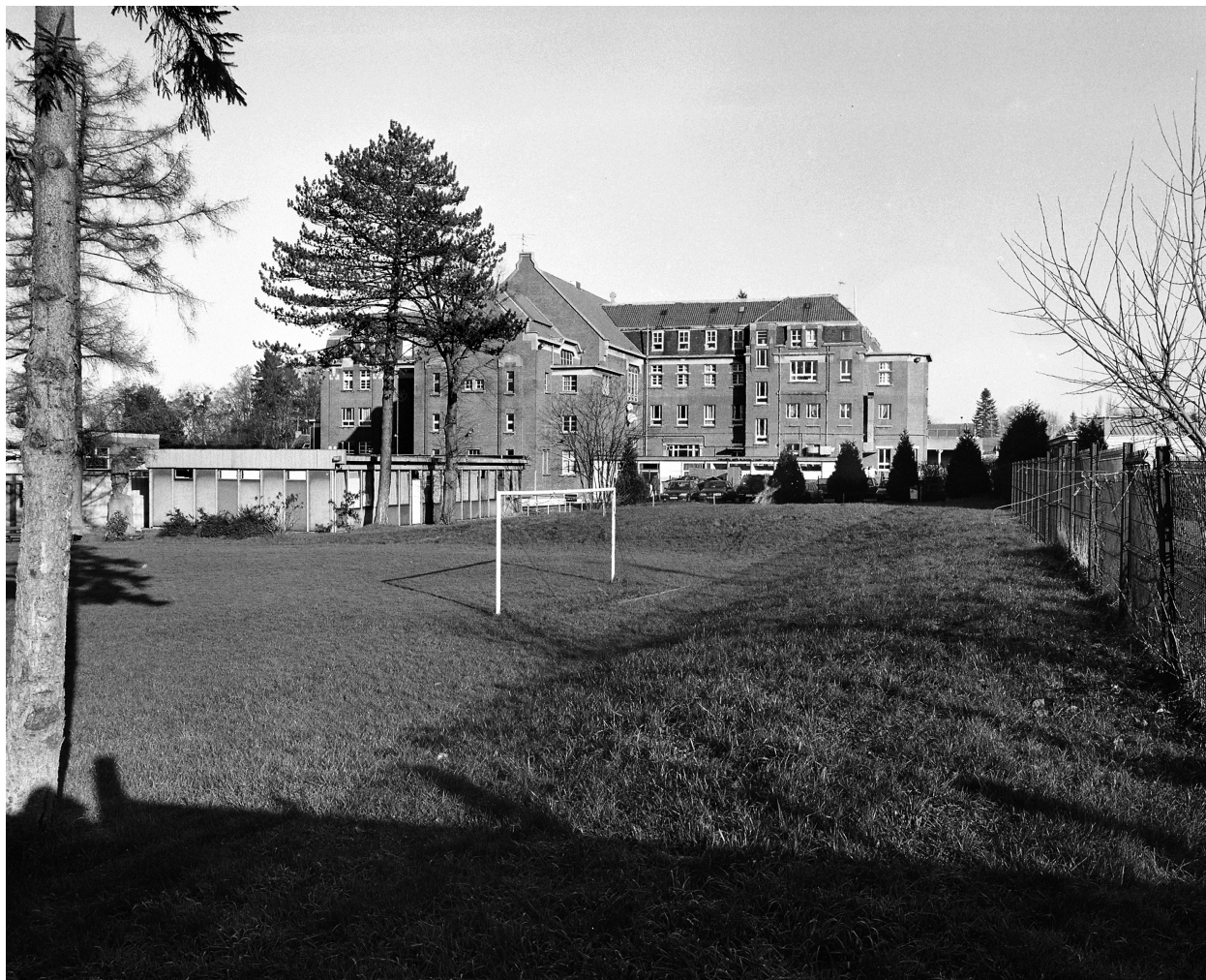
Vue générale du pensionnat depuis le sud.