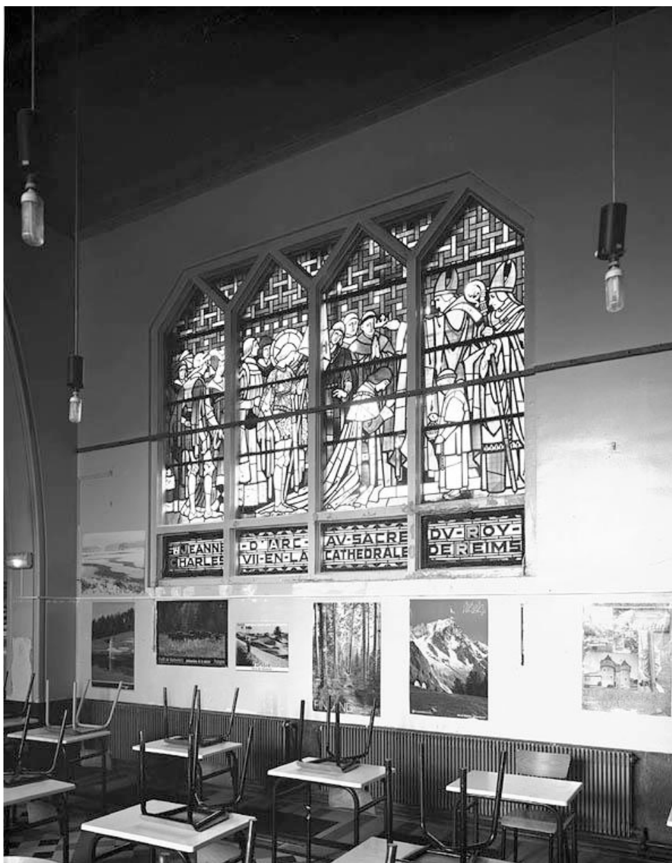
Vitrail de la chapelle représentant le sacre de Charles VII à Reims.