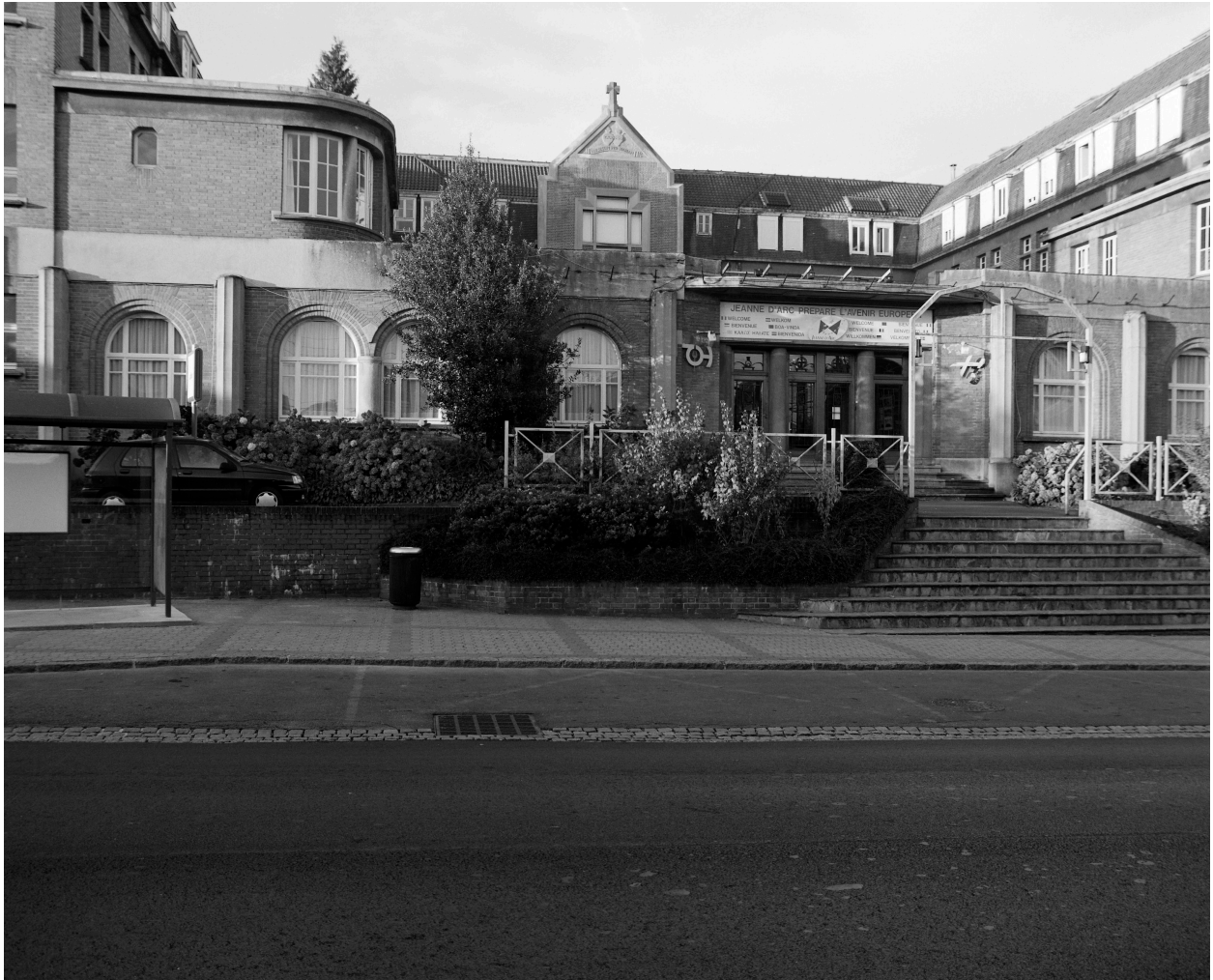
Vue générale depuis la rue de l'Hôtel-de-Ville.