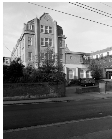
Vue générale de l'aile orientale depuis la rue de l'Hôtel-de-Ville.