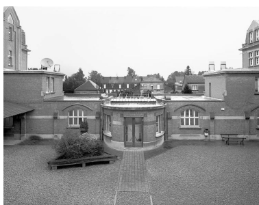
Vue générale sur l'aile nord, le hall d'accueil, prise du premier étage de la chapelle.