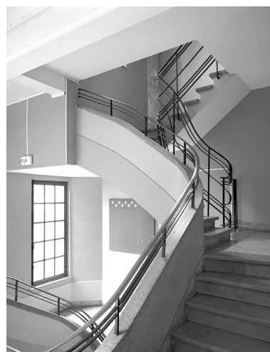
Vue générale de l'escalier desservant l'aile sud. IVR31_20015902275V