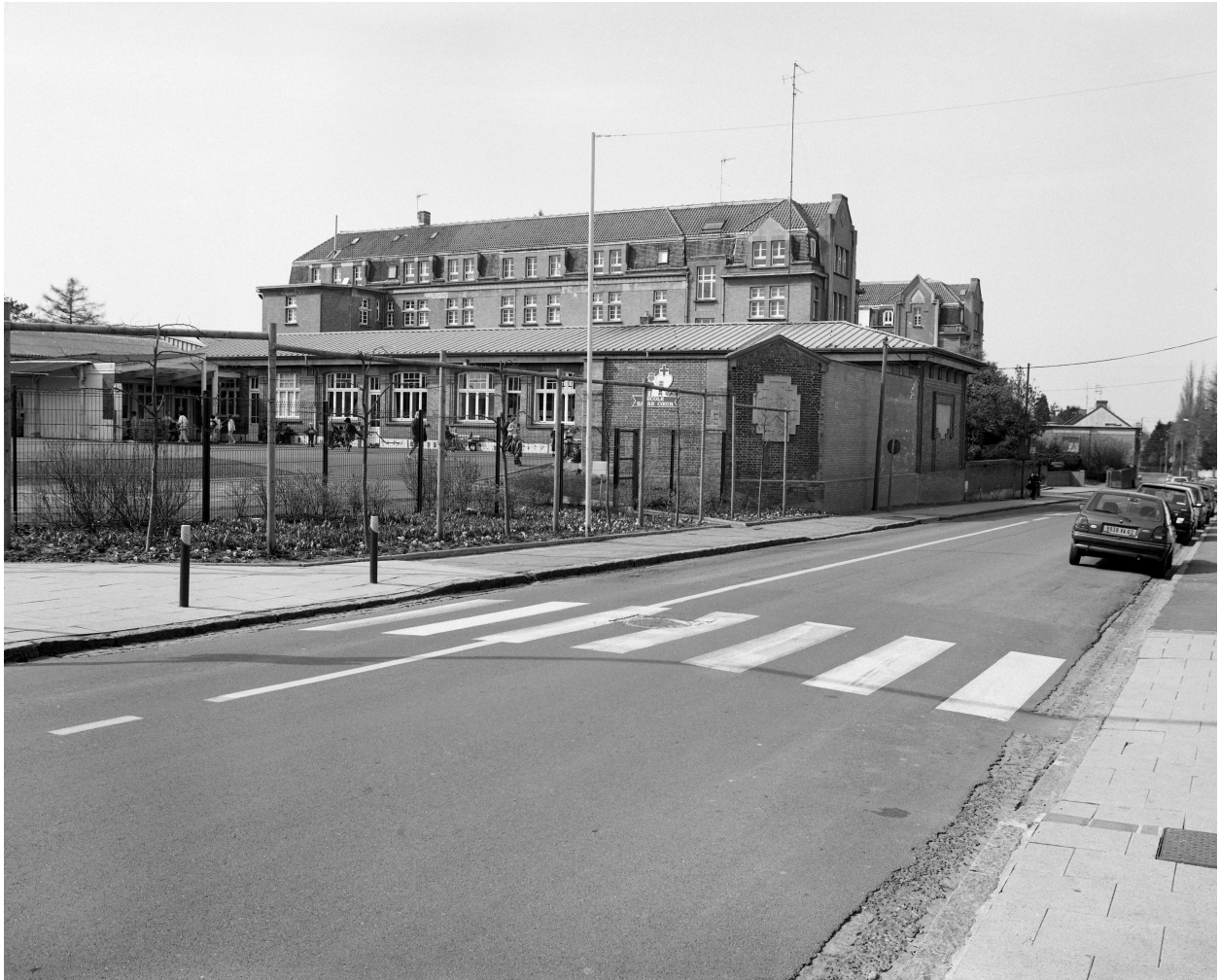
Vue générale de trois quarts de l'école (premier plan) et du pensionnat.