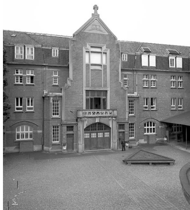
Élévation antérieure de la chapelle. IVR31_20015902279V