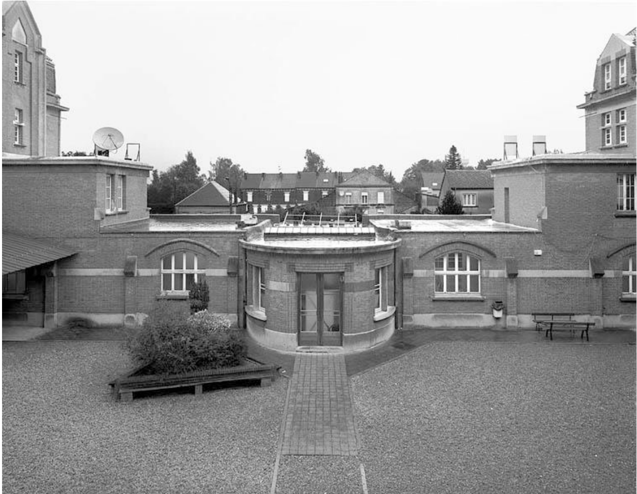
Vue générale sur l'aile nord, le hall d'accueil, prise du premier étage de la chapelle.