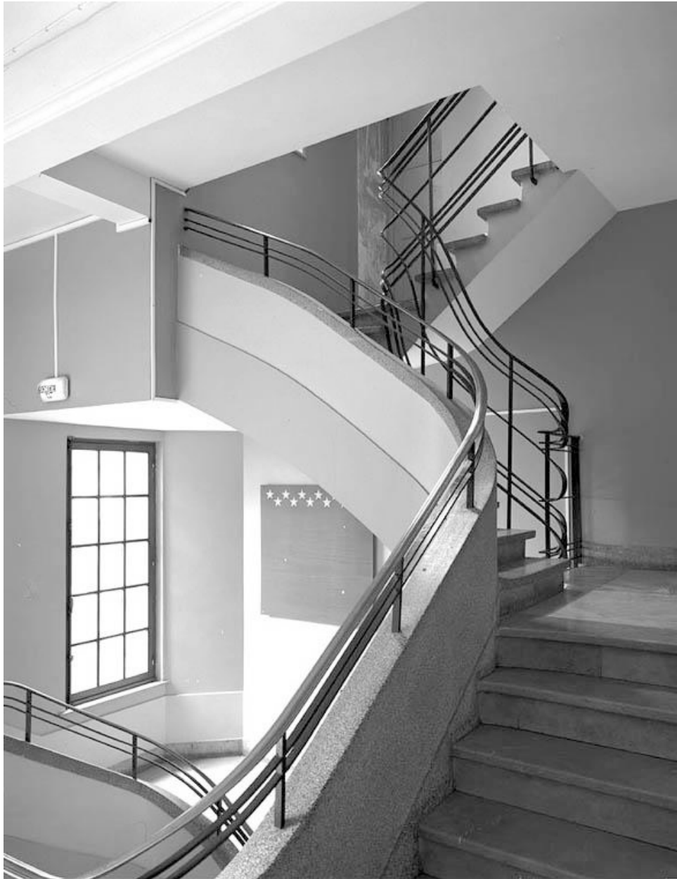
Vue générale de l'escalier desservant l'aile sud.