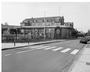
Vue générale de trois quarts de l'école (premier plan) et du pensionnat.