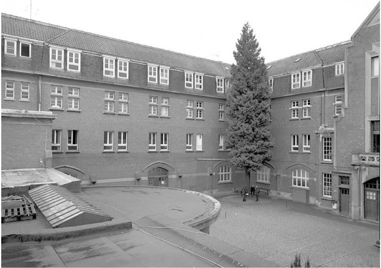
Vue générale de la cour, de l'aile orientale et de l'angle sud-est.