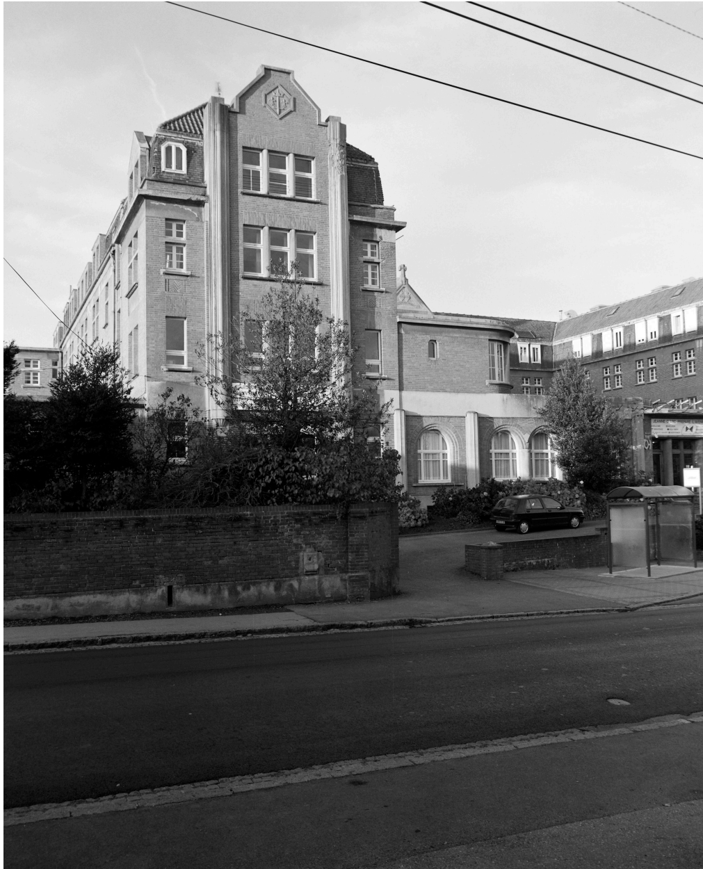
Vue générale de l'aile orientale depuis la rue de l'Hôtel-de-Ville.