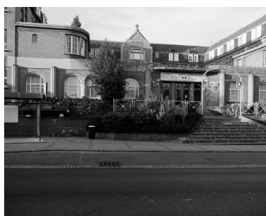
Vue générale depuis la rue de l'Hôtel-de-Ville. IVR31_20025902333X