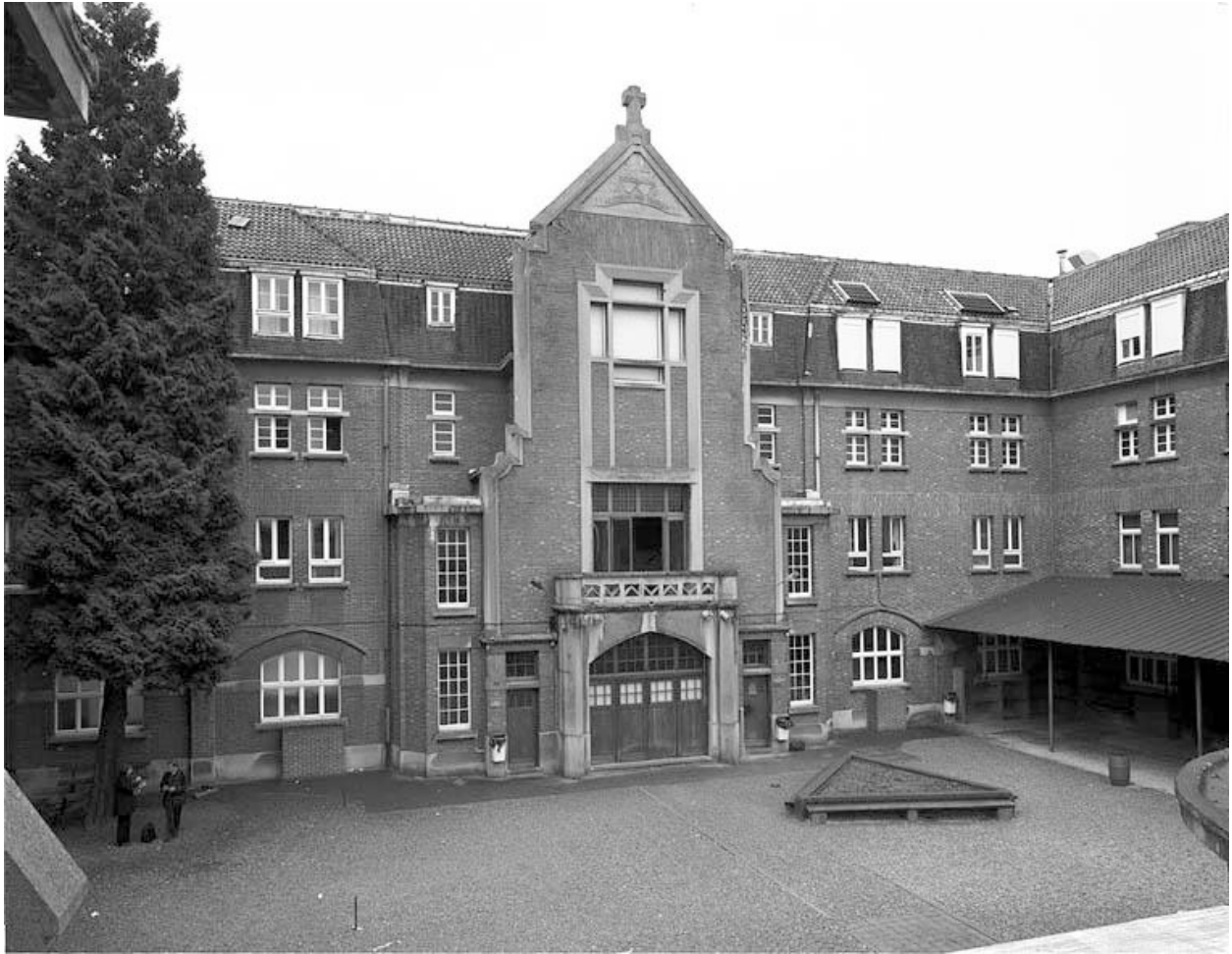
Vue générale de la cour, de l'aile sud et de la chapelle.