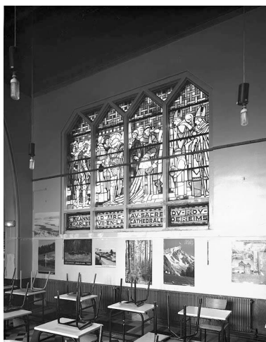
Vitrail de la chapelle représentant le sacre de Charles VII à Reims. IVR31_20015902273V