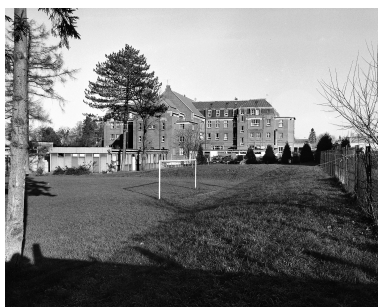
Vue générale du pensionnat depuis le sud.