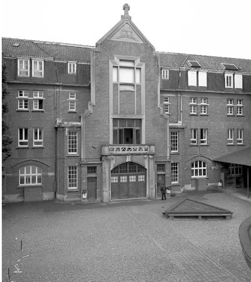
Élévation antérieure de la chapelle.