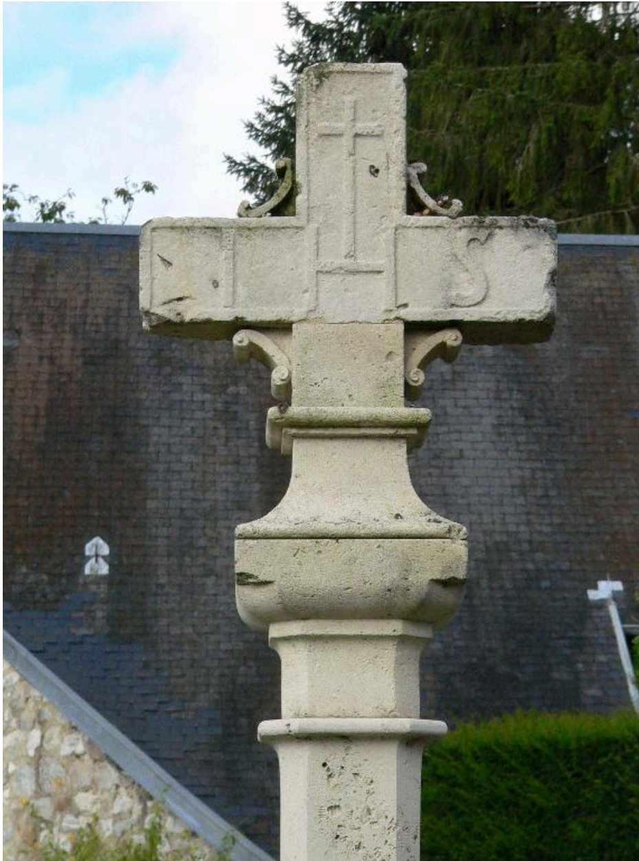
Détail de la partie supérieure : décor de l'un des côtés.