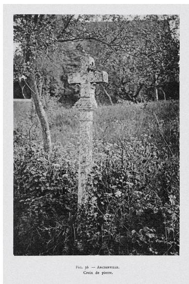
Croix de chemin, photographiée par Étienne Moreau-Nélaton en 1913 ( Les Églises de chez nous . Arrondissement de Soissons, t. 1, fig. 36).

Phot. Thierry Lefébure IVR22_19950201745ZB