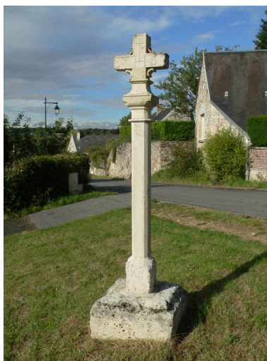
Vue générale de la croix restaurée.