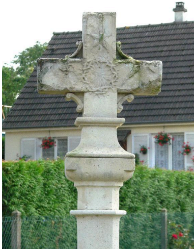
Détail de la partie supérieure : décor du revers.