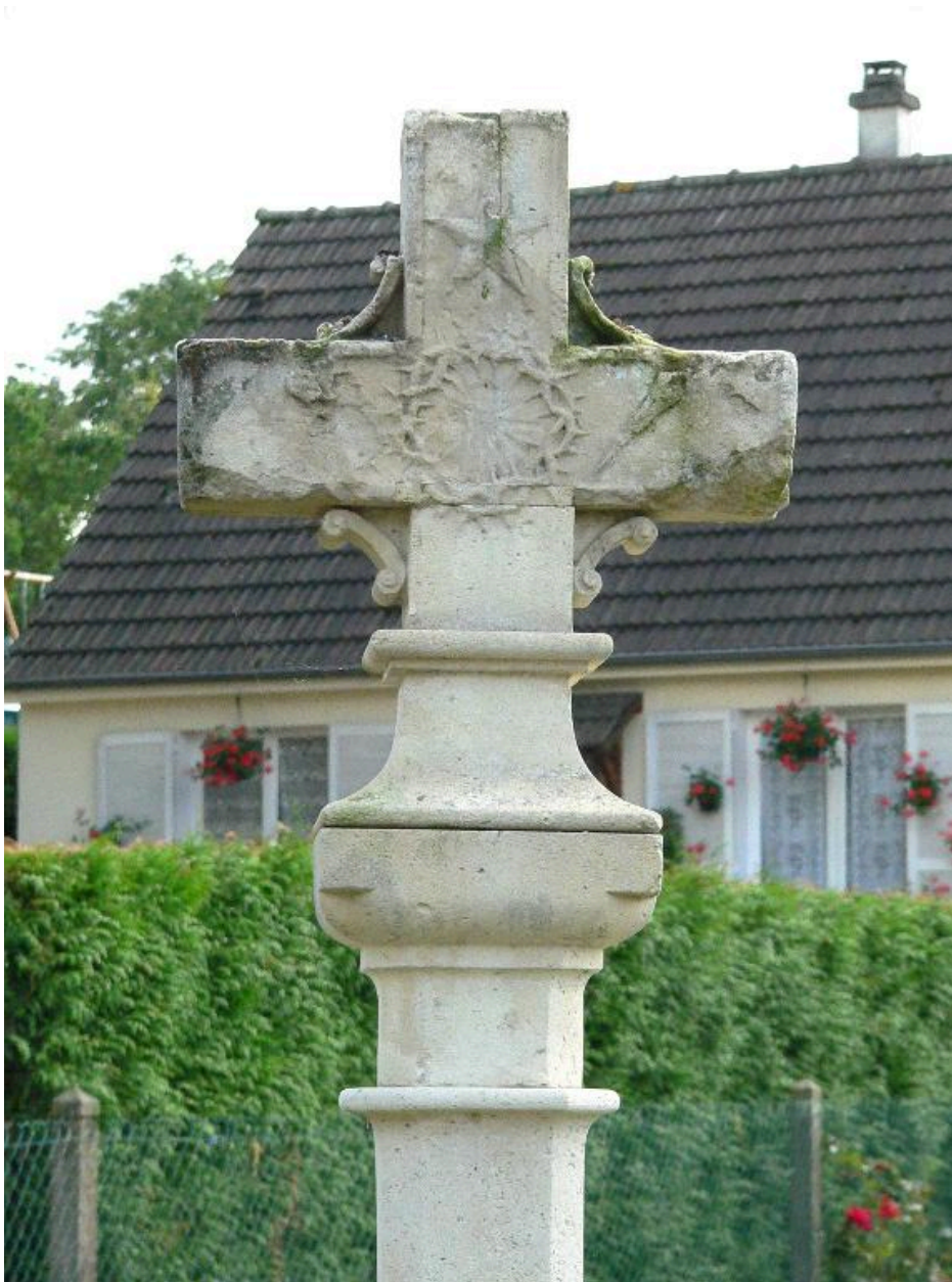
Détail de la partie supérieure : décor du revers.