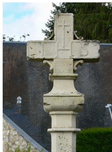
Détail de la partie supérieure : décor de l'un des côtés. IVR32_20160205039NUCA