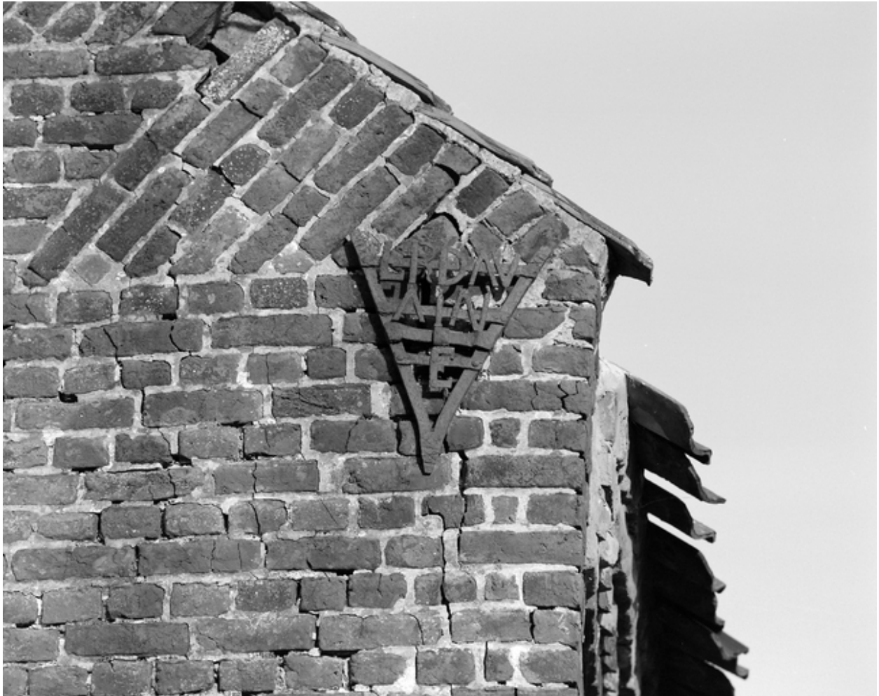
Détail du pignon des étables : fer d'ancrage patronymique Verdavaine.