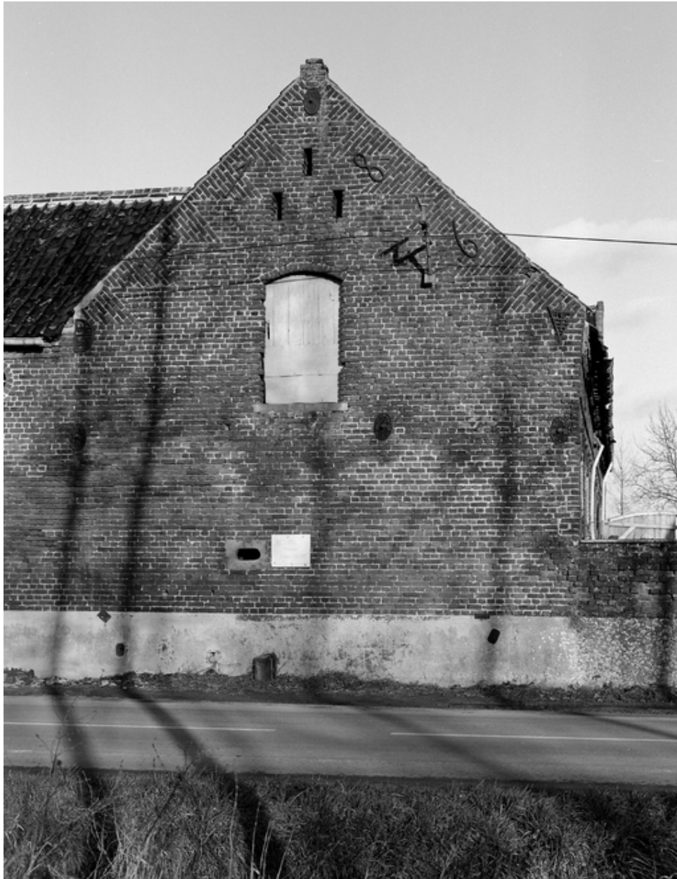
Le pignon des étables-écuries portant les fers d'ancrage patronymiques.