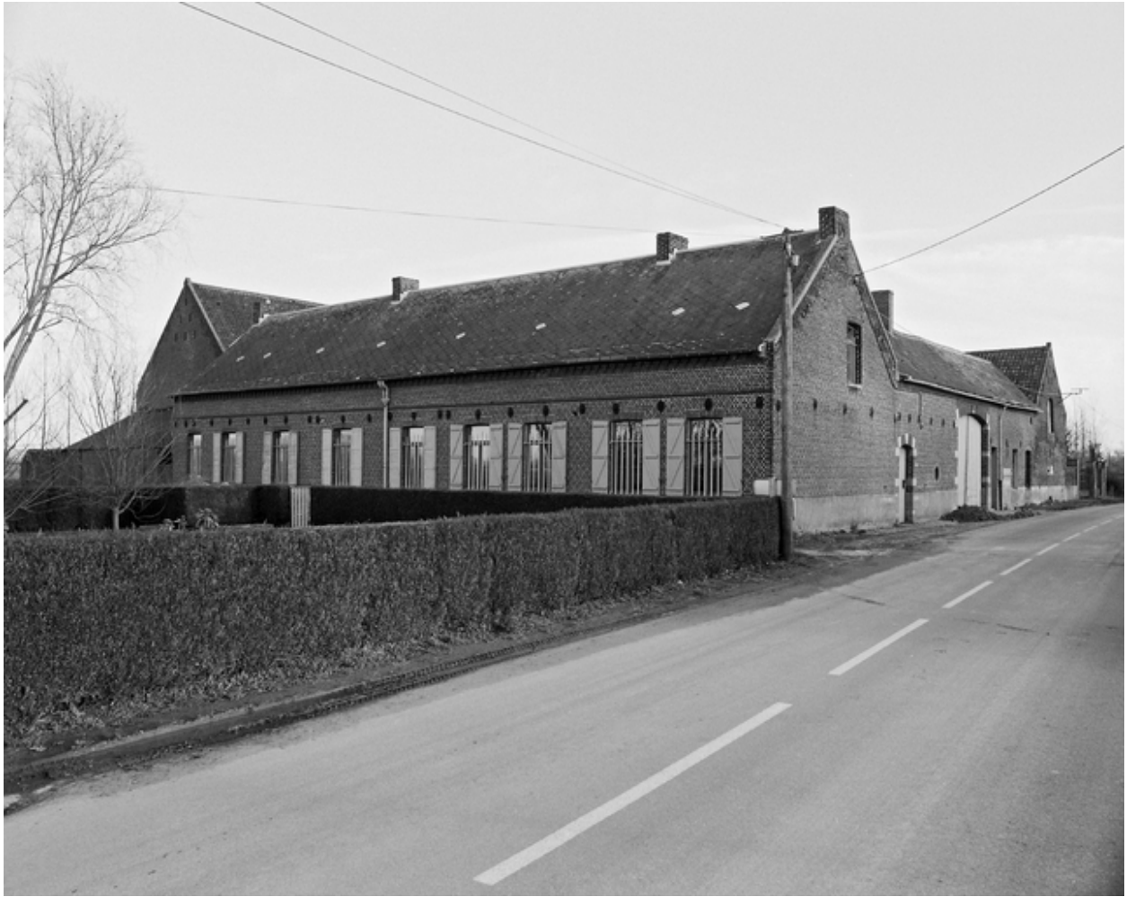
Vue générale de trois quarts de la ferme, côté logis.