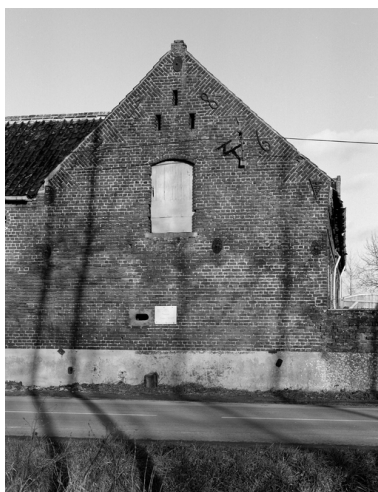
Le pignon des étables-écuries portant les fers d'ancrage patronymiques.