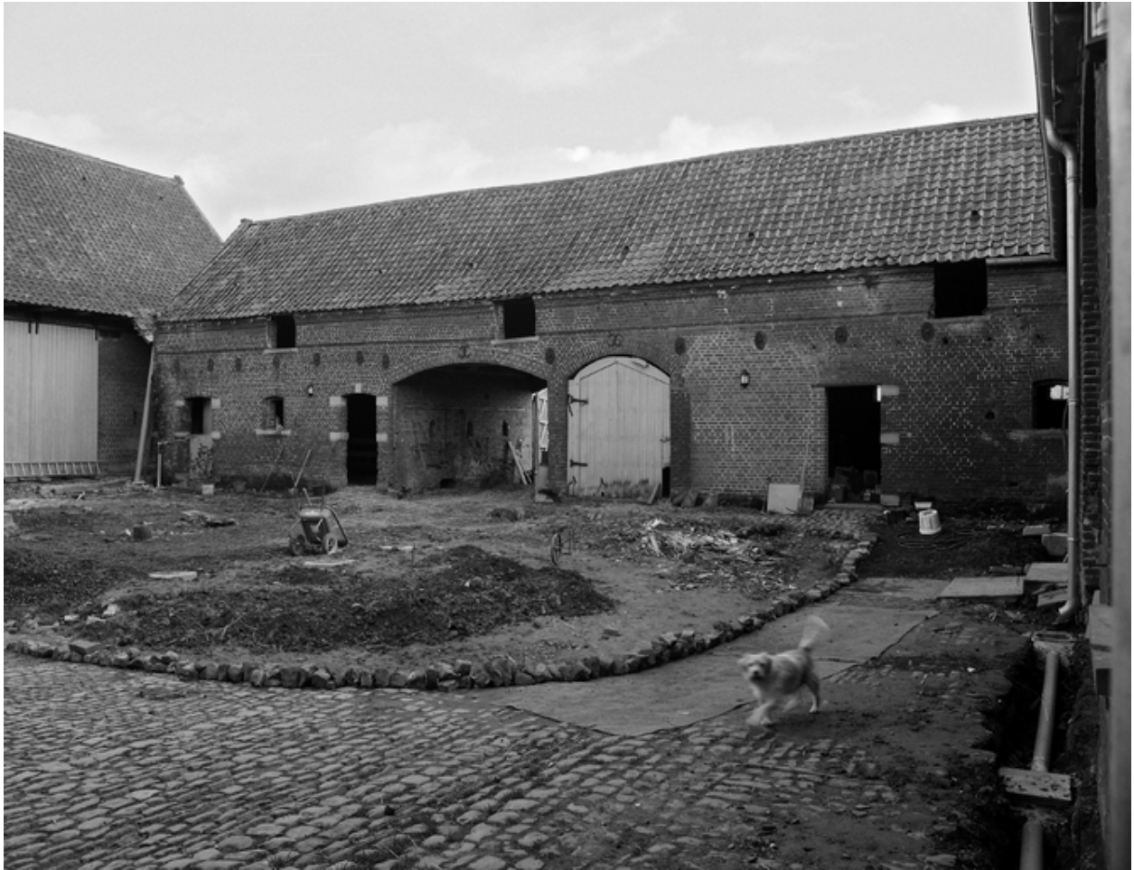
Vue générale des étables-écuries.