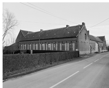
Vue générale de trois quarts de la ferme, côté logis. IVR31_20055900033X