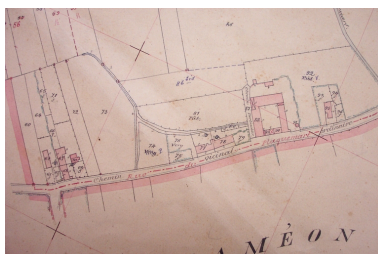
Situation sur le cadastre de 1912.