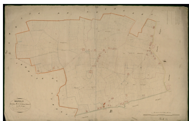
Situation sur le cadastre de 1830.