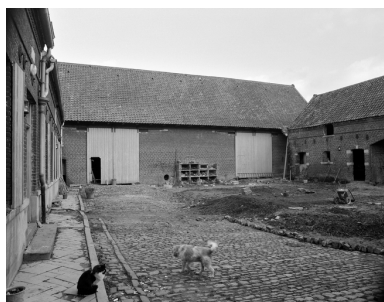
La grange : élévation sur cour.