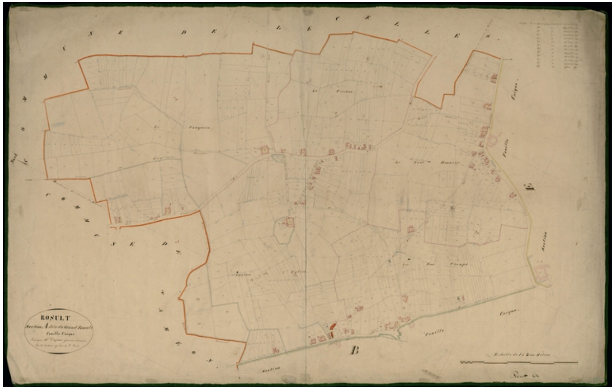
Situation sur le cadastre de 1830.