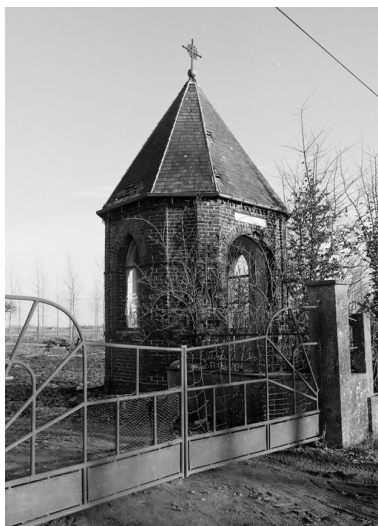
Vue générale de trois quarts de l'oratoire.