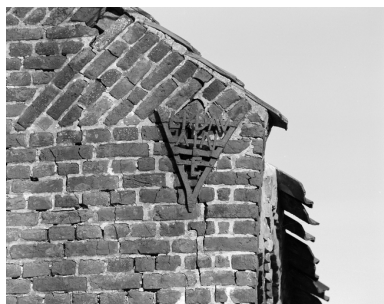
Détail du pignon des étables : fer d'ancrage patronymique Verdavaine.