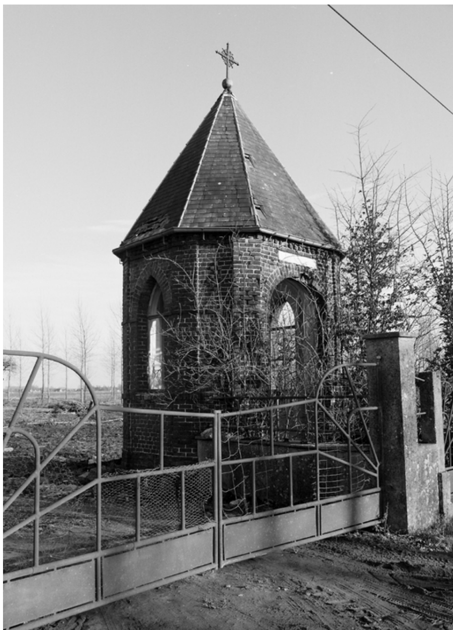
Vue générale de trois quarts de l'oratoire.