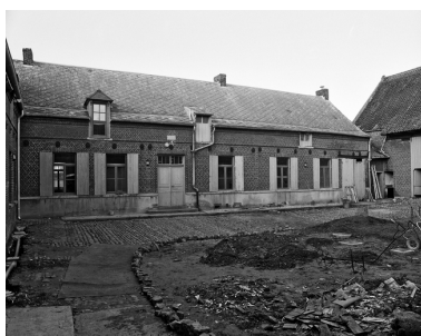
La cour : élévation antérieure du logis, donnant sur la cour.