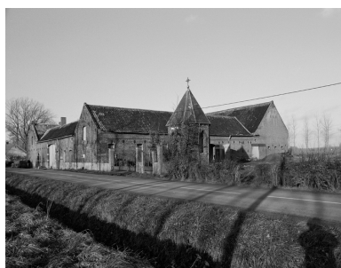
Vue générale de trois quarts de la ferme, et l'oratoire. IVR31_20055900040X