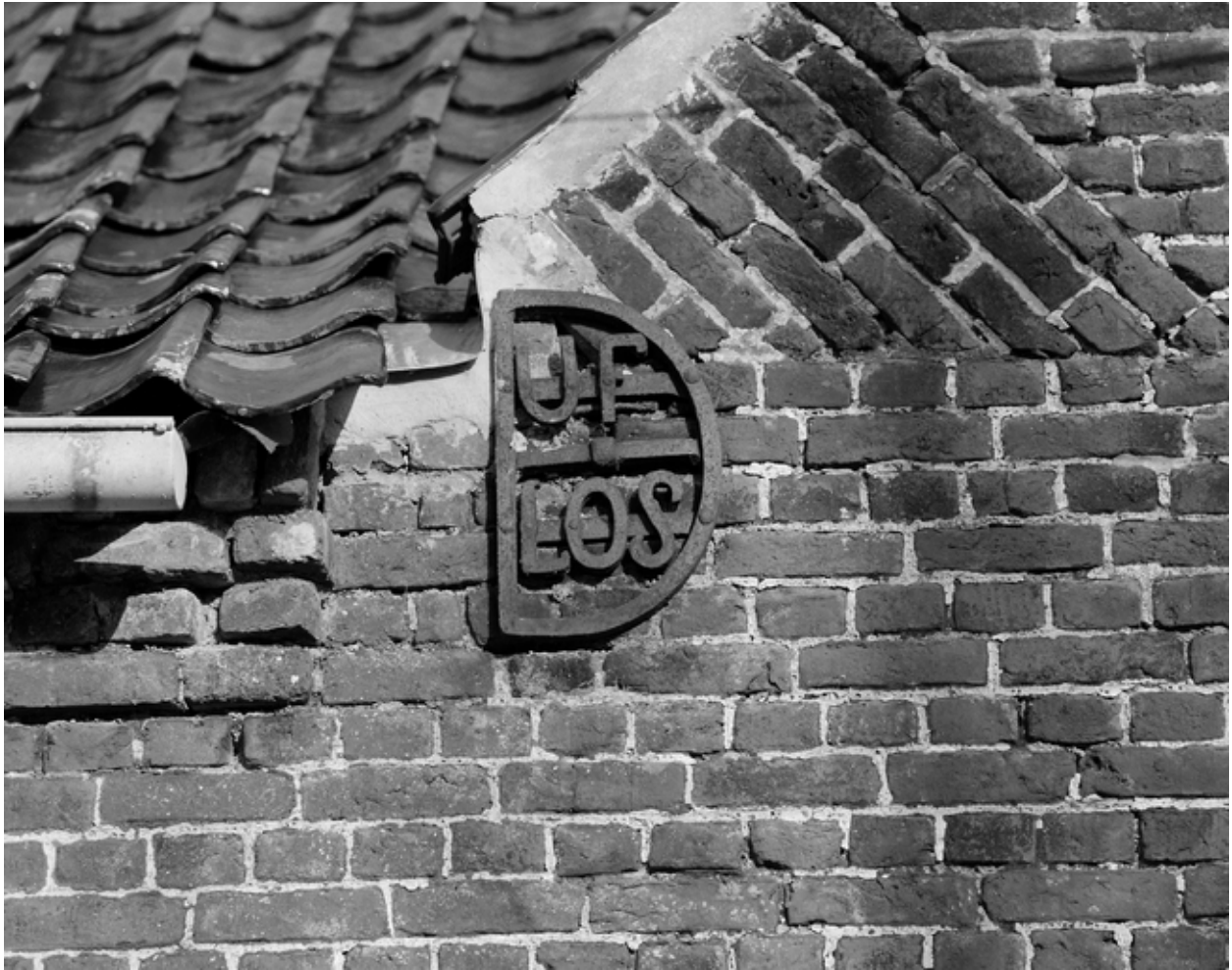
Détail du pignon des étables : fer d'ancrage patronymique Duflos.