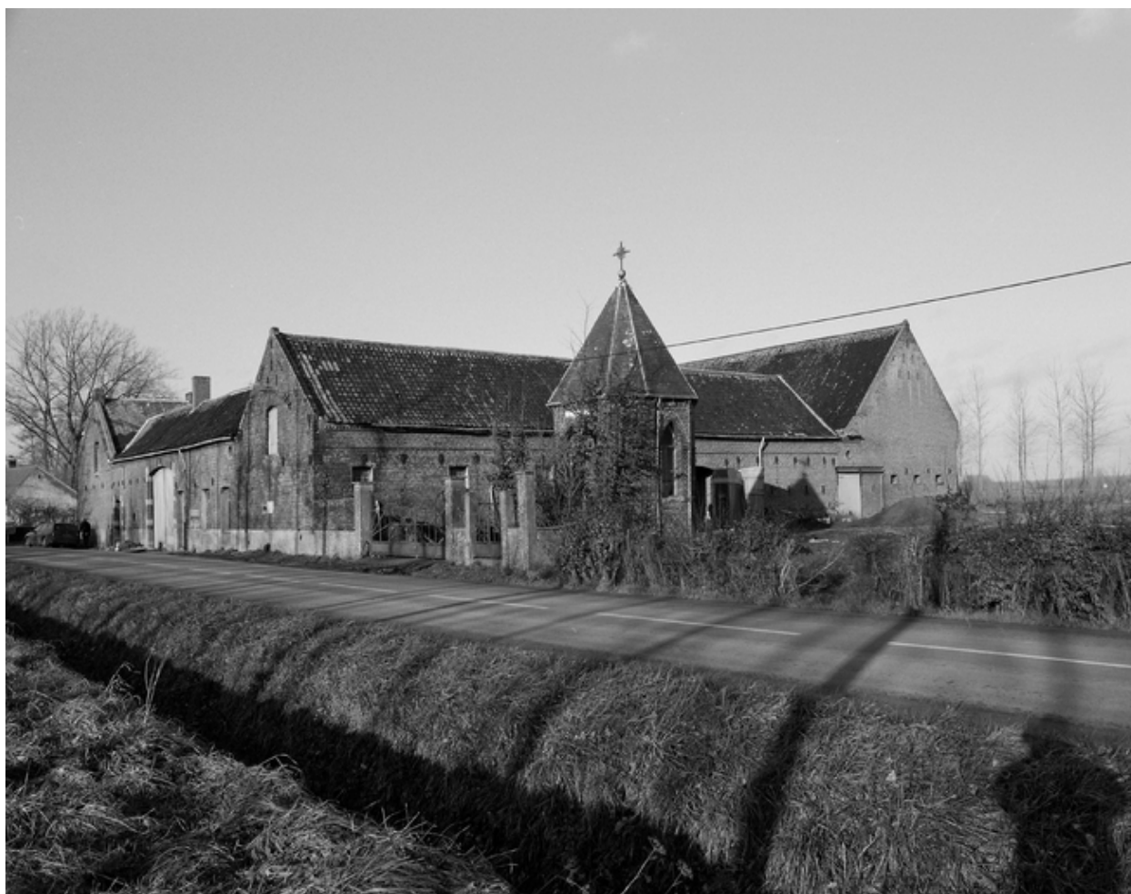
Vue générale de trois quarts de la ferme, et l'oratoire.