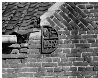
Détail du pignon des étables : fer d'ancrage patronymique Duflos. IVR31_20055900032X