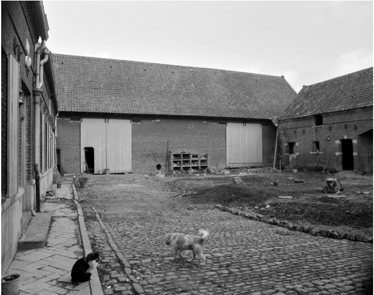
La grange : élévation sur cour.