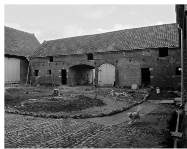
Vue générale des étables-écuries.