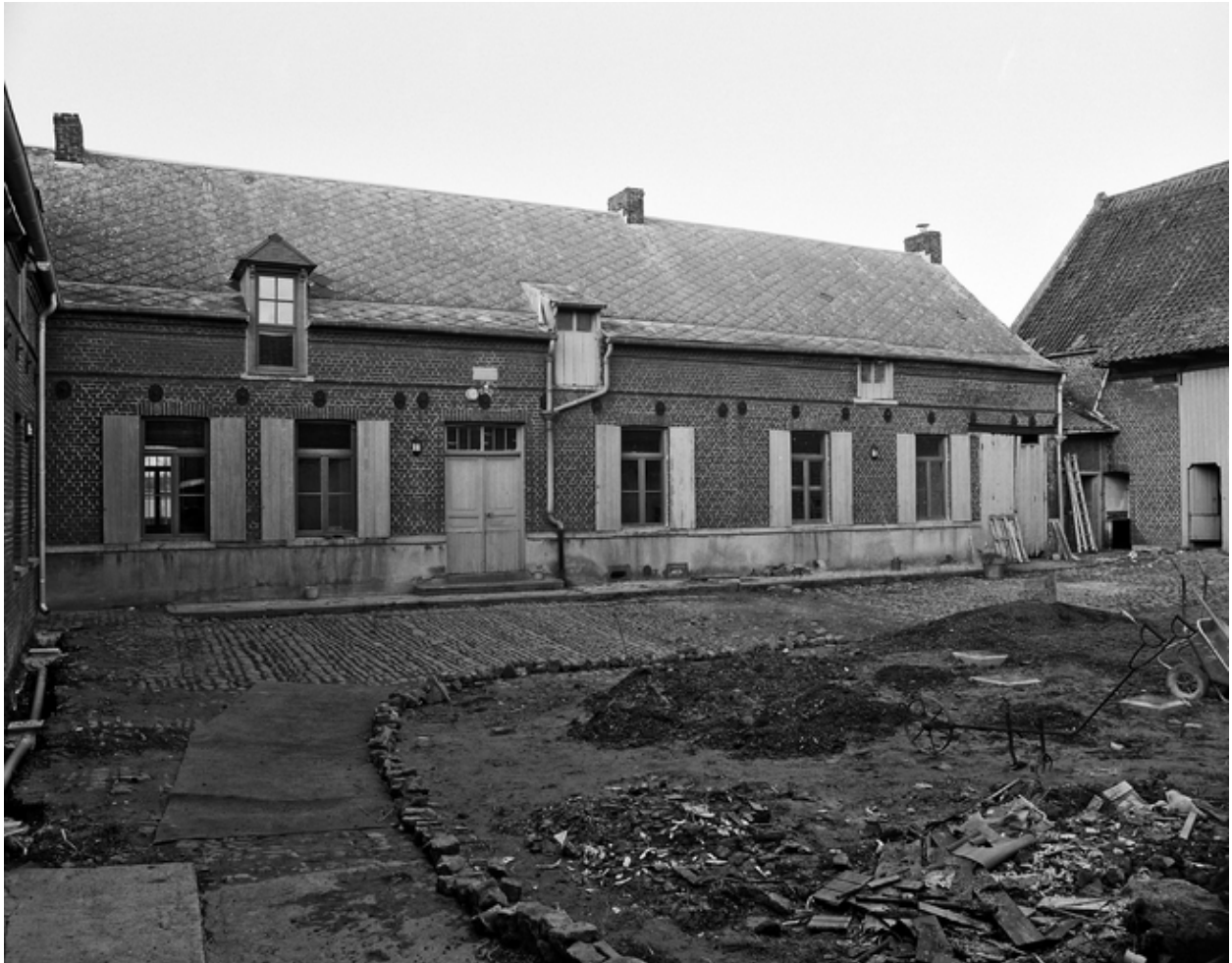
La cour : élévation antérieure du logis, donnant sur la cour.