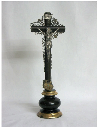
L'une des croix