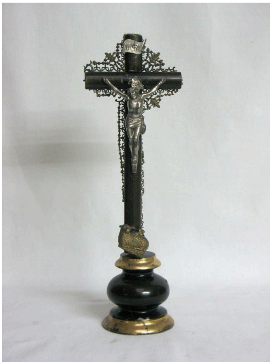
L'une des croix