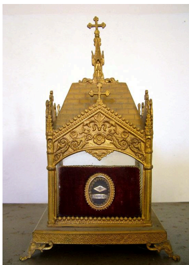
Châsse, laiton, limite 19e siècle 20e siècle. IVR22_20128015545NUCA