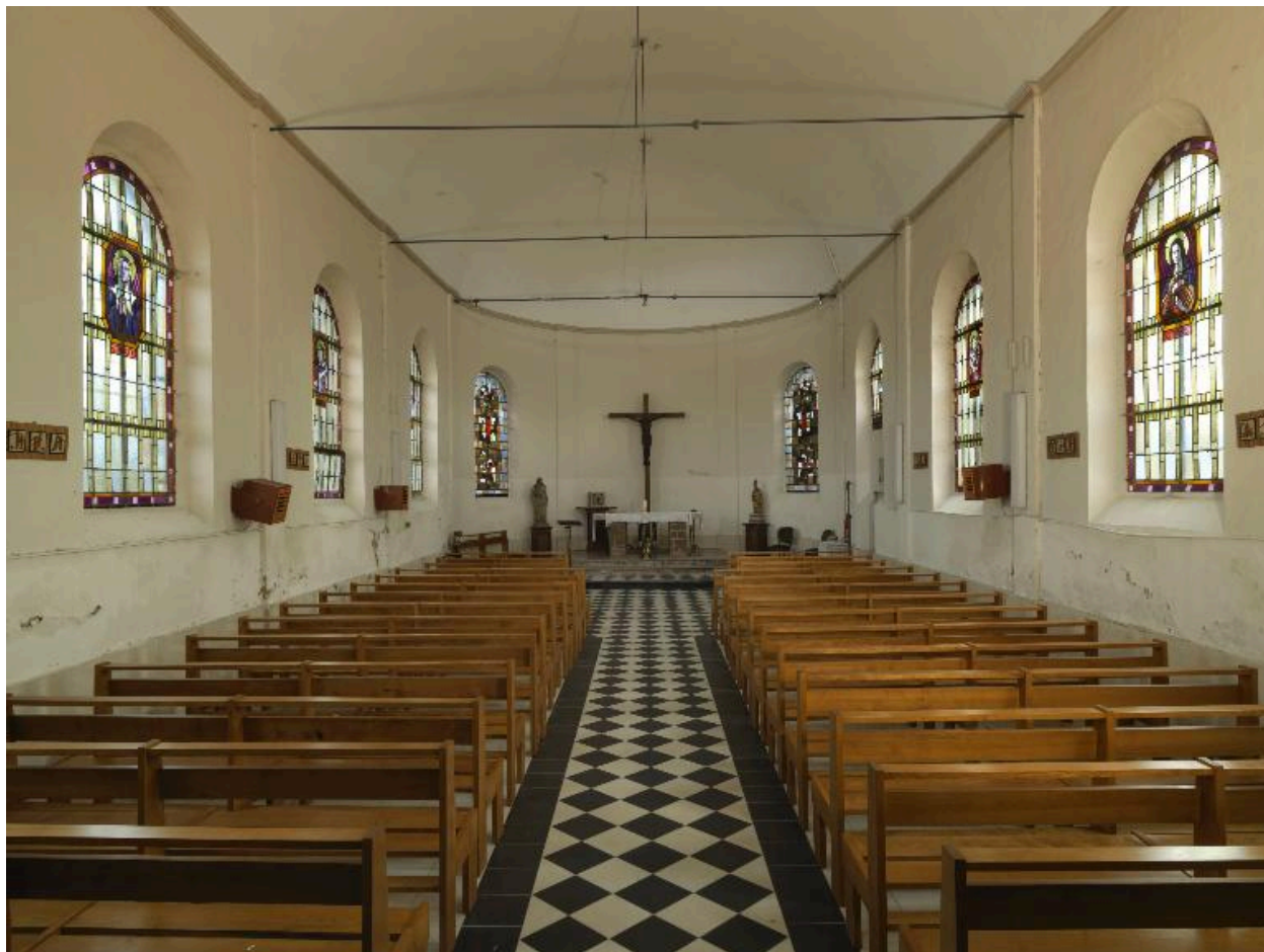
Vue de la nef et du chœur.