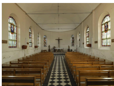
Vue de la nef et du chœur. IVR22_20148000030NUC2A