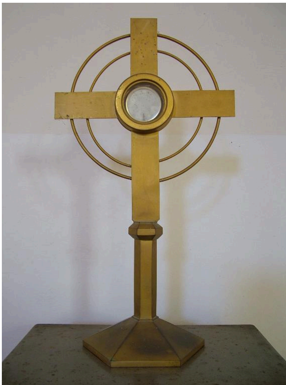
Croix d'autel, laiton, 2e quart 20e siècle.