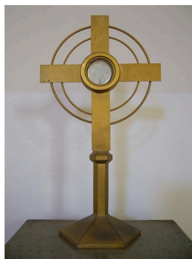
Croix d'autel, laiton, 2e quart 20e siècle. IVR22_20128015544NUCA