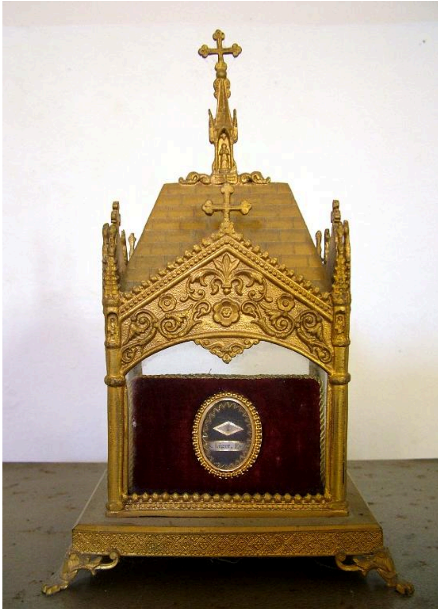
Châsse, laiton, limite 19e siècle 20e siècle.