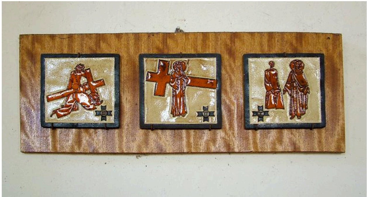
Chemin de croix, stations 1 à 3, terre cuite émaillée sur bois, 3e quart 20e siècle.