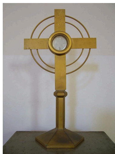
Croix d'autel, laiton, 2e quart 20e siècle. IVR22_20128015544NUCA