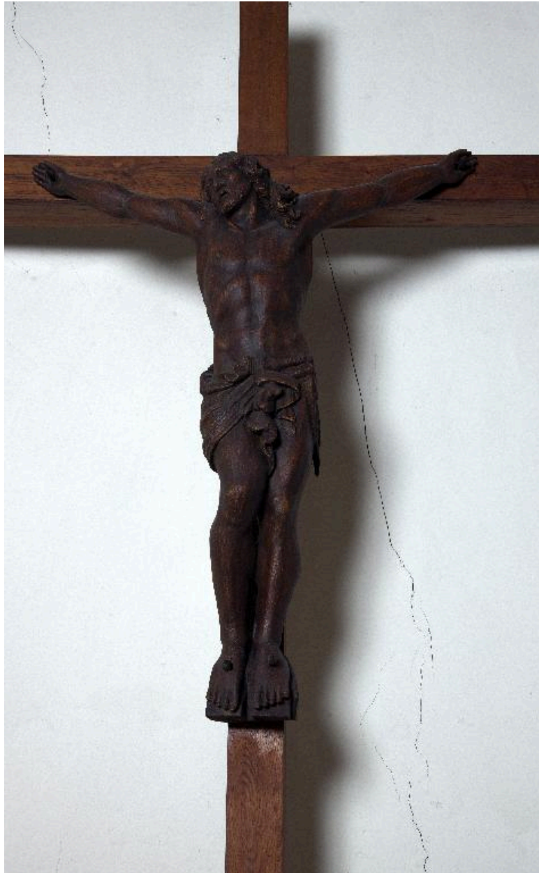
Christ en croix, chêne, 2e moitié 19e siècle, sur croix moderne.