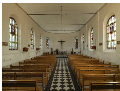
Vue de la nef et du chœur. IVR22_20148000030NUC2A