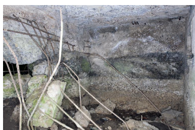
Intérieure du magasin à munitions IVR31_20155901165NUCA