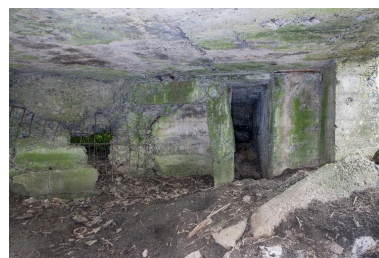
Entrée du magasin à munitions depuis la chambre de tir IVR32_20165900980NUCA