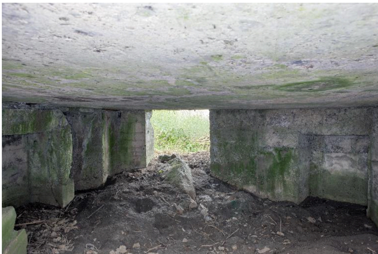
Vue vers le sud, depuis la chambre de tir