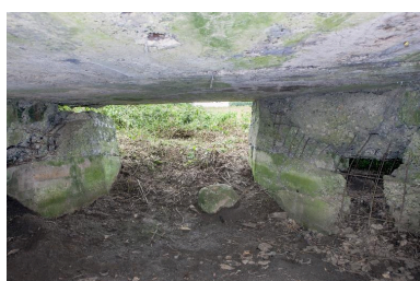
Depuis la chambre de tir vers le sud