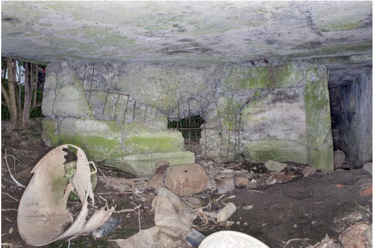
Chambre de tir, vers l'est