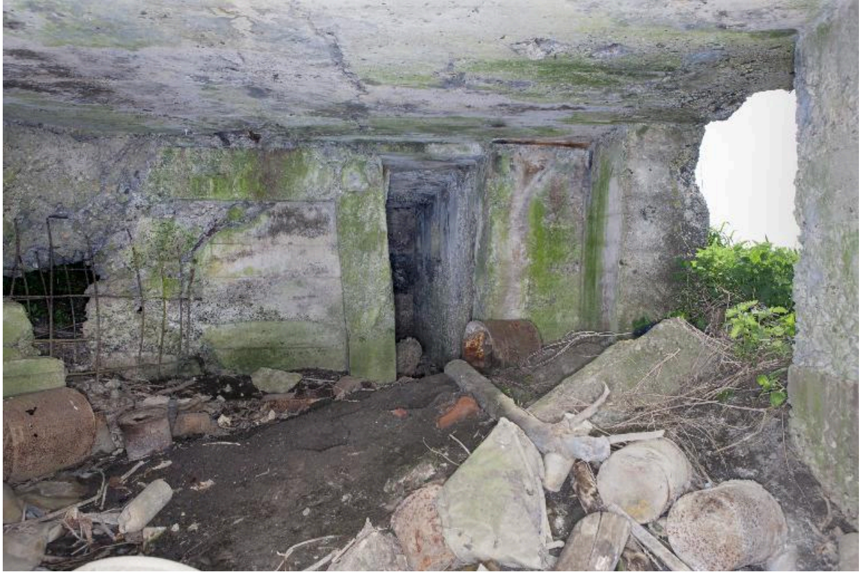
L'entrée de la soute à munitions, depuis la chambre de tir