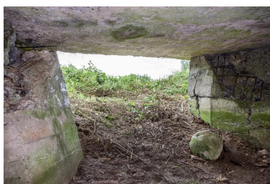
Vue vers le nord, depuis la chambre de tir IVR32_20165900979NUCA