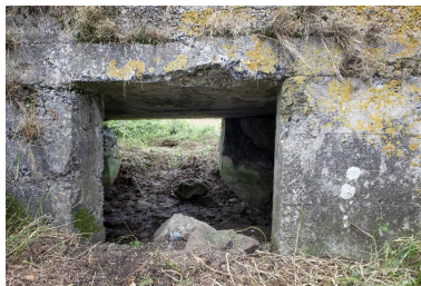
Entrée sud. IVR32_20165900985NUCA