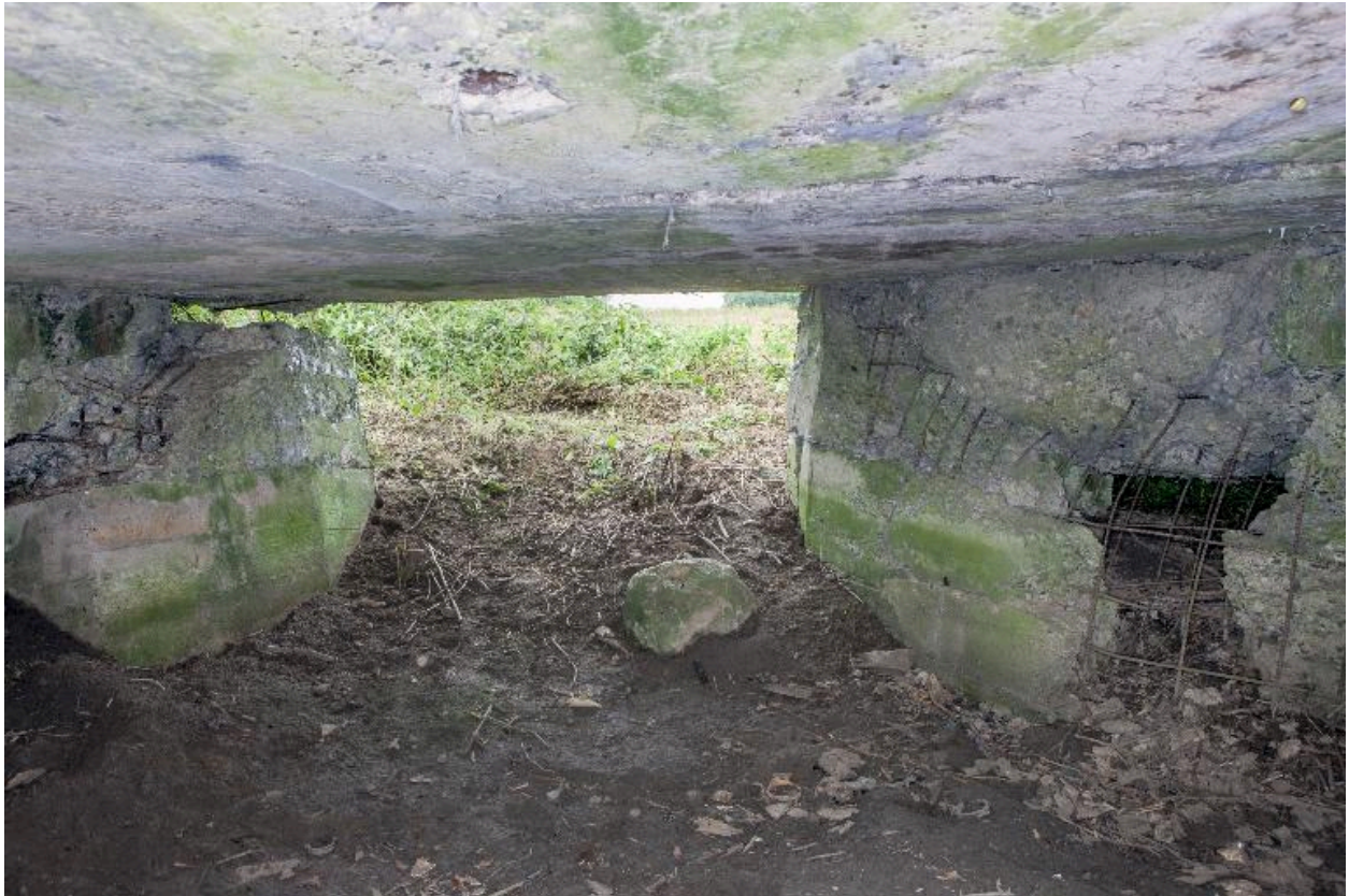
Depuis la chambre de tir vers le sud