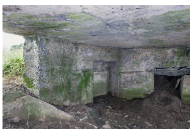
Chambre de tir, vers l'ouest IVR32_20165900983NUCA