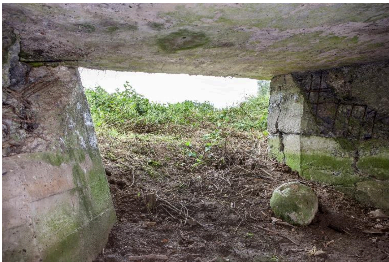
Vue vers le nord, depuis la chambre de tir