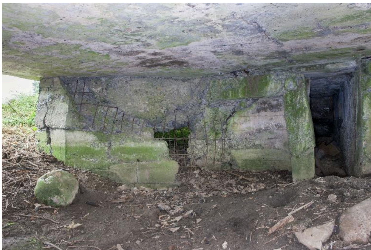
Chambre de tir, vers le nord-est