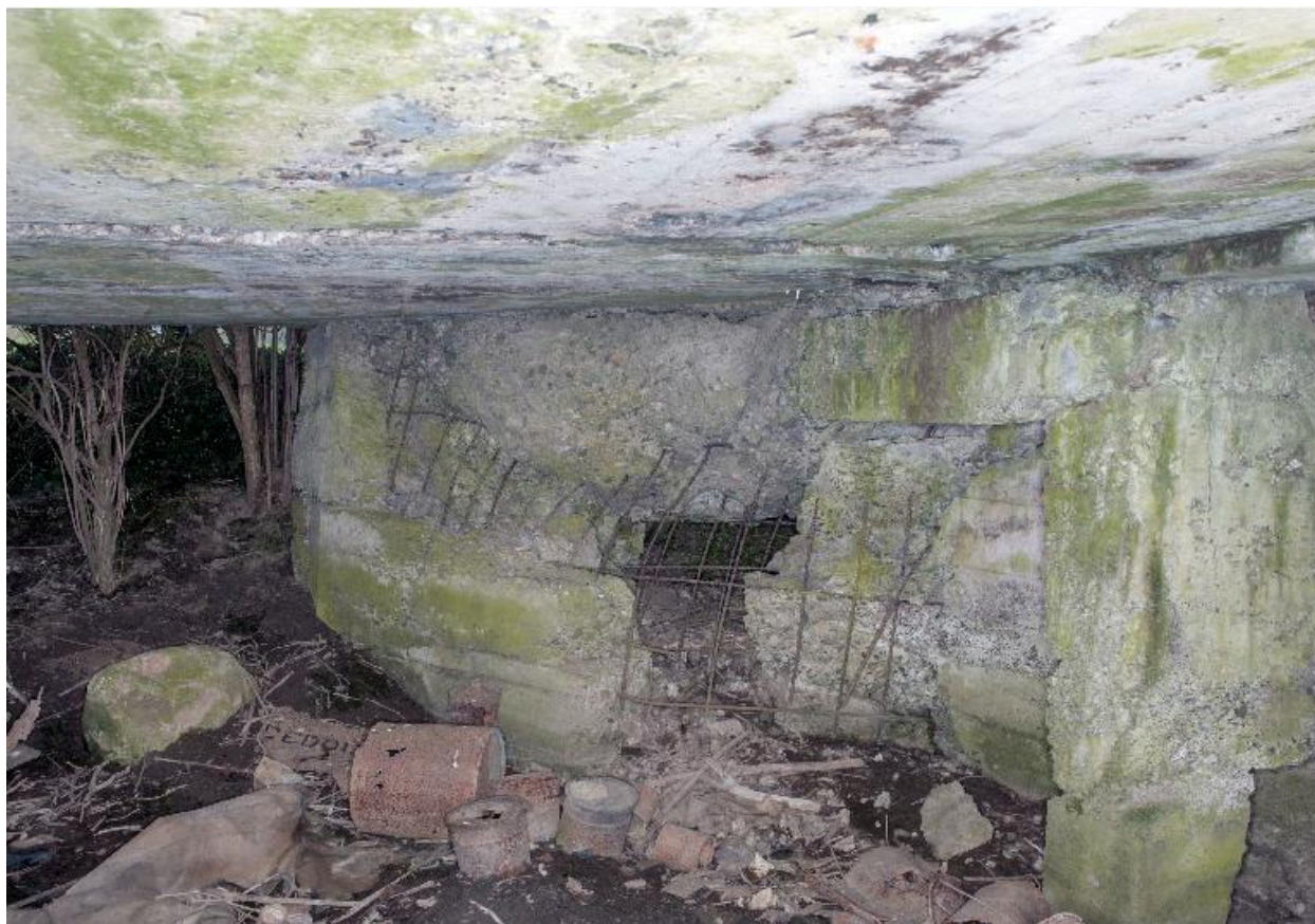
Niche est, depuis la chambre de tir