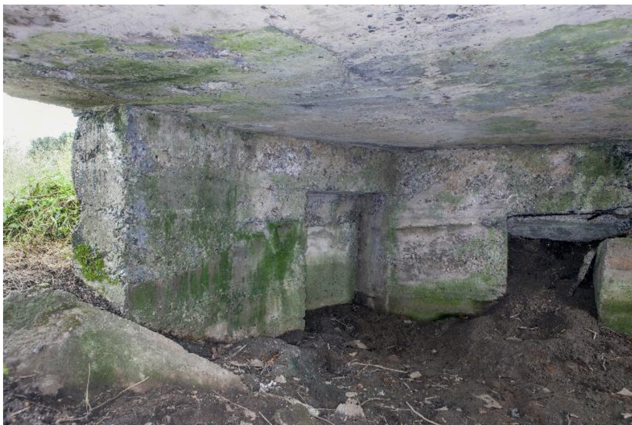
Chambre de tir, vers l'ouest