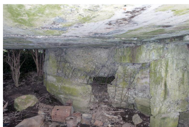
Niche est, depuis la chambre de tir IVR31_20155901161NUCA