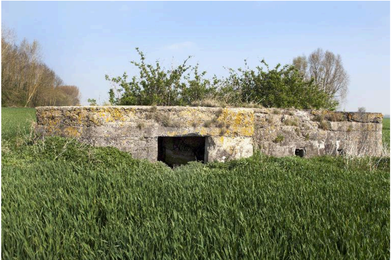
Elévation sud. Entrée