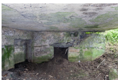
Depuis la chambre de tir, vers l'ouest.