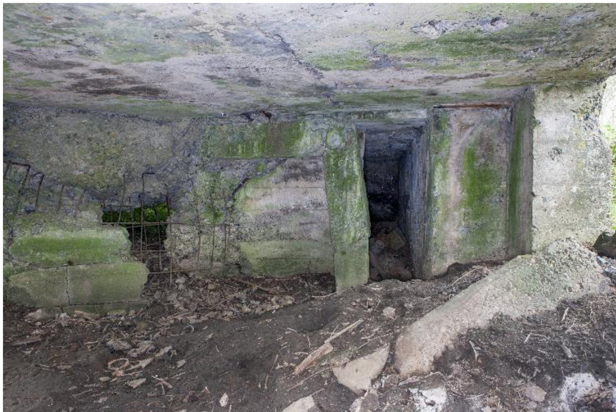
Entrée du magasin à munitions depuis la chambre de tir