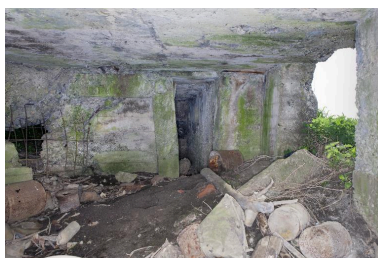
L'entrée de la soute à munitions, depuis la chambre de tir