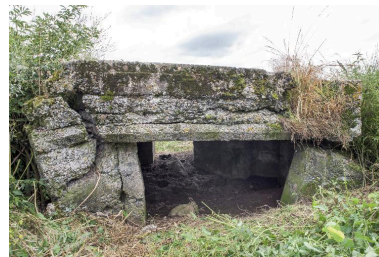
Elevation nord. IVR32_20165900986NUCA