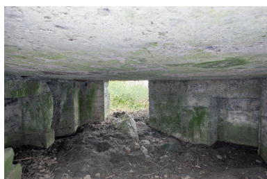
Vue vers le sud, depuis la chambre de tir