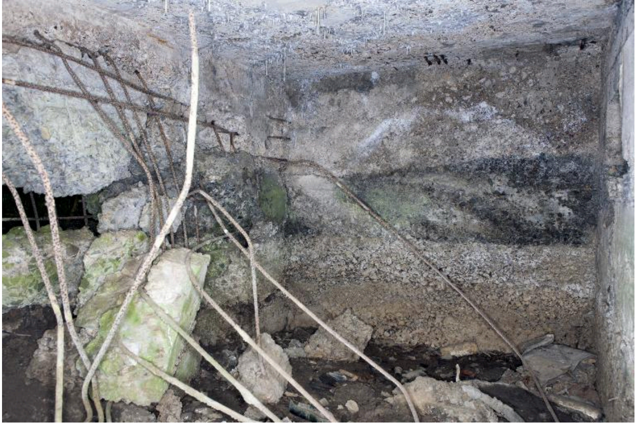
Intérieure du magasin à munitions