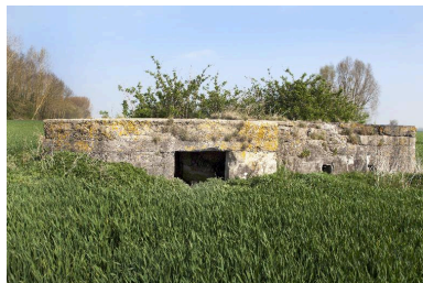
Elévation sud. Entrée