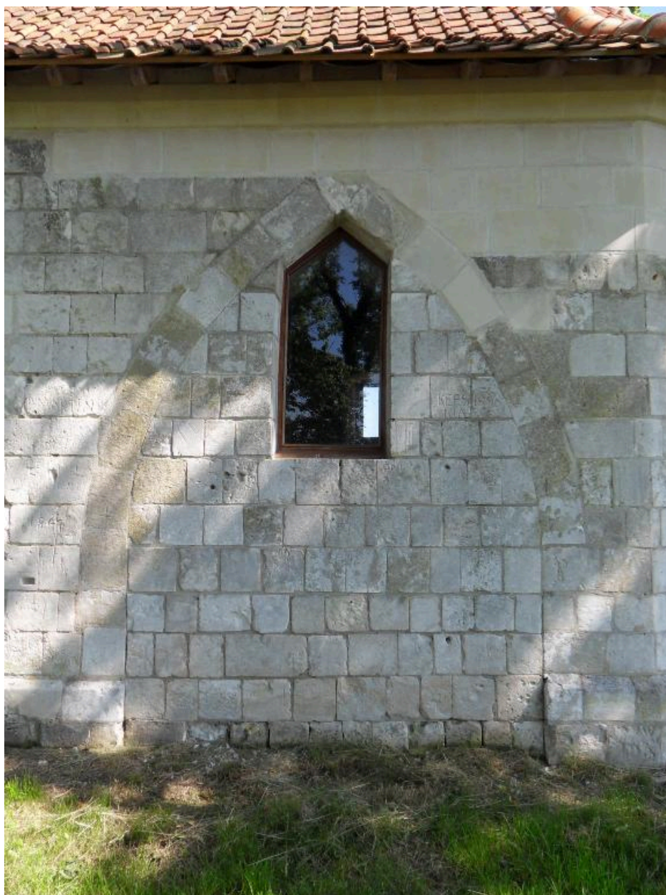
Troisième arcature mur sud.