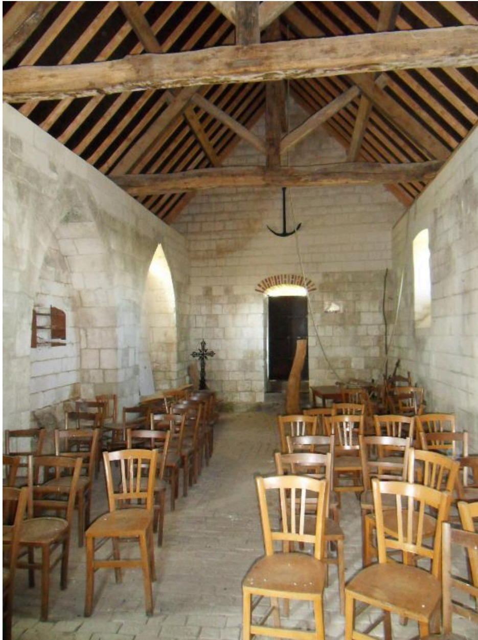
Vue intérieure vers l'entrée.