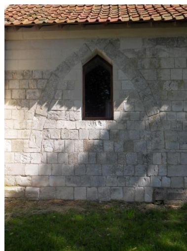
Première arcature mur sud. IVR22_20108010155NUCA