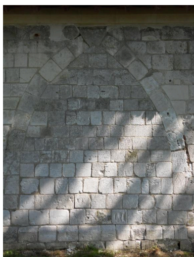
Deuxième arcature mur sud.