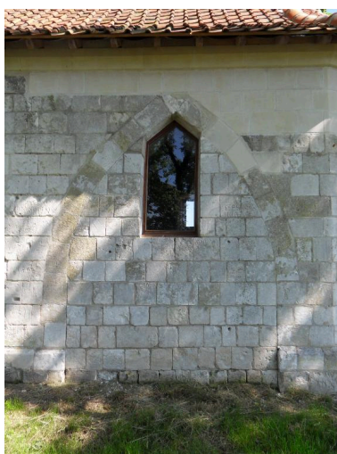
Troisième arcature mur sud.