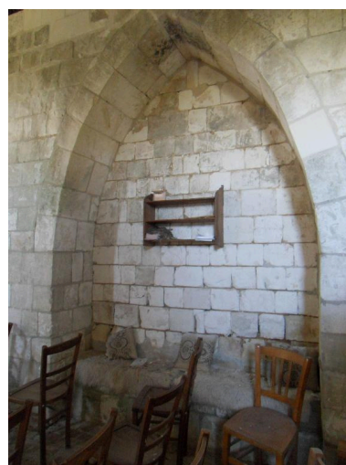
Vue intérieure, deuxième arcature (mur sud).