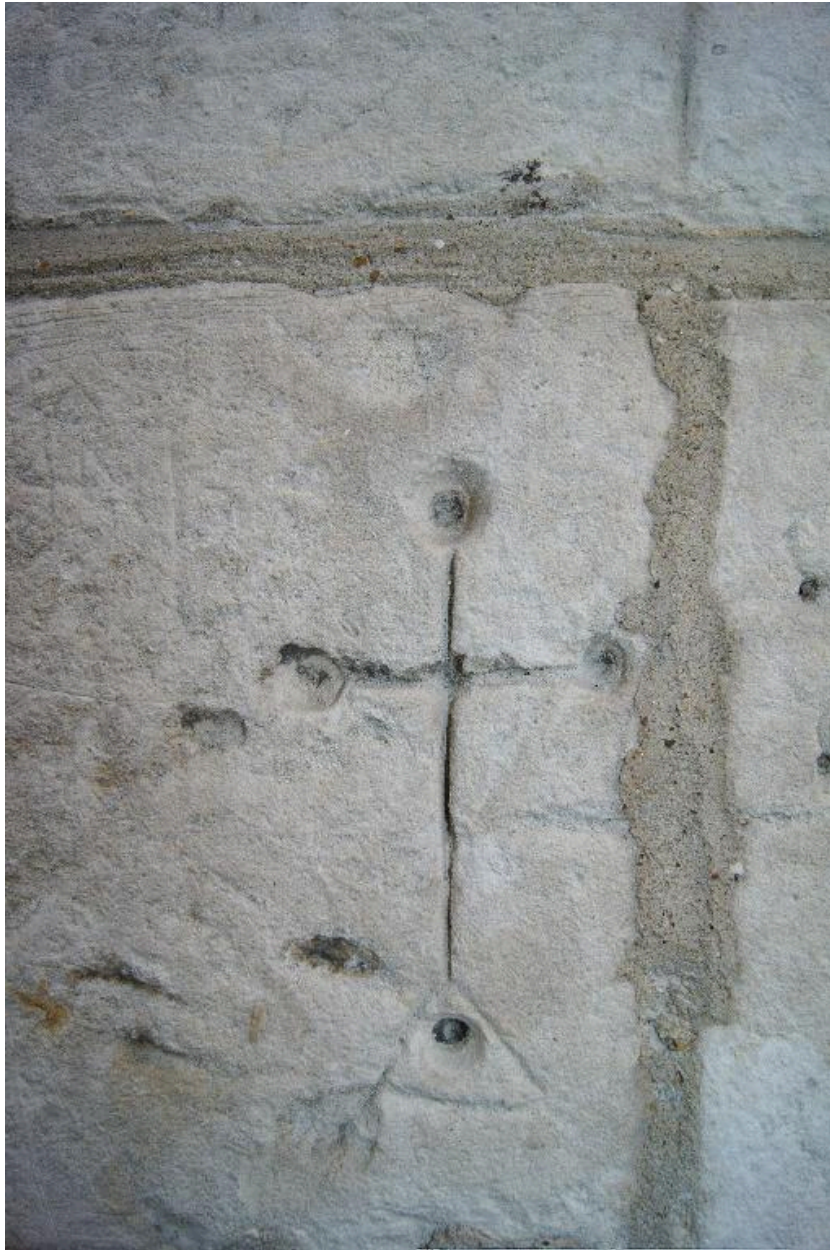
Croix funéraire. Graffiti gravé sur le mur de la chapelle.