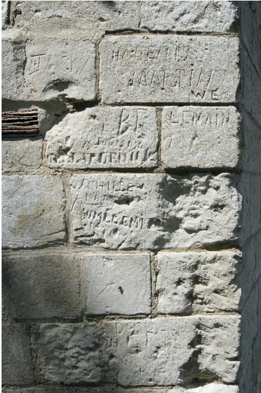
Graffitis gravés sur le mur de la chapelle.