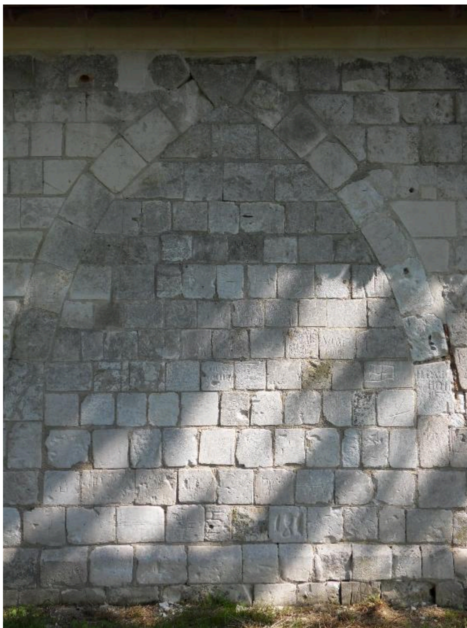
Deuxième arcature mur sud.