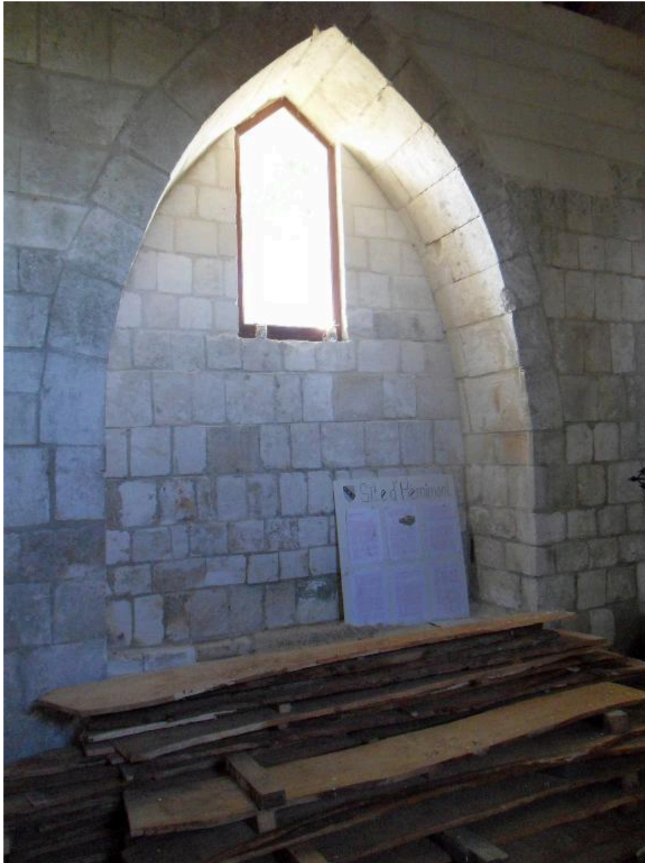
Vue intérieure. Première arcature (mur sud).