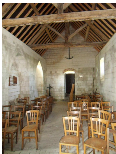
Vue intérieure vers l'entrée. IVR22_20108010131NUCA