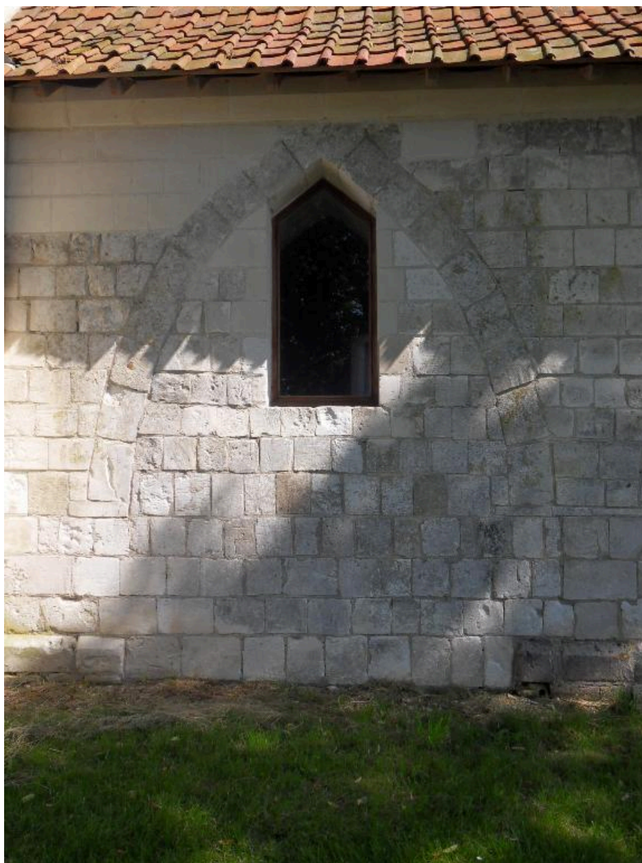
Première arcature mur sud.