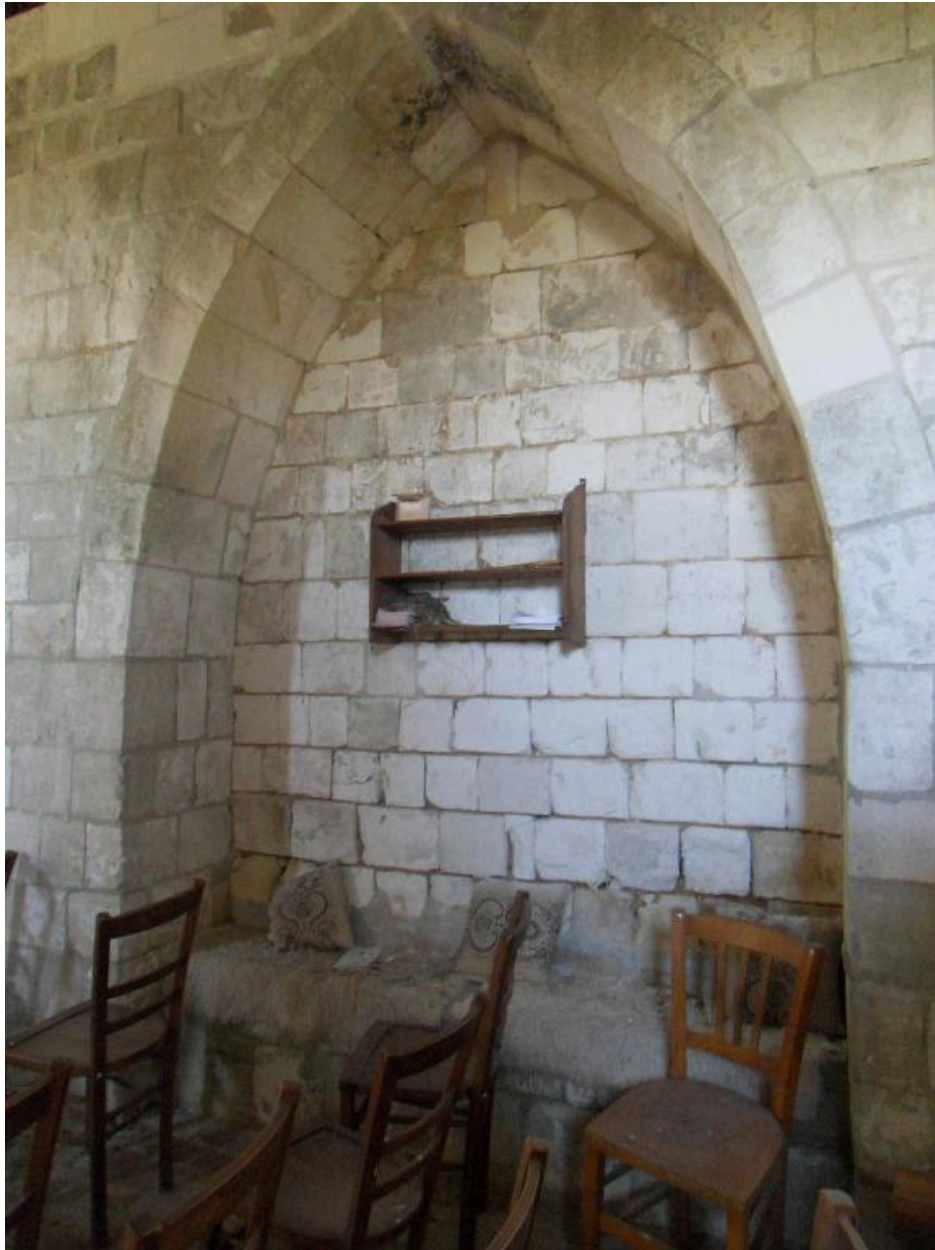
Vue intérieure, deuxième arcature (mur sud).