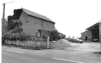
Vue de la boucherie.

Phot. Monnehay-Vulliet Marie-Laure IVR22_20080290215NUCA