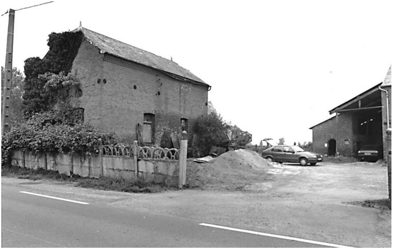
Vue de la boucherie.