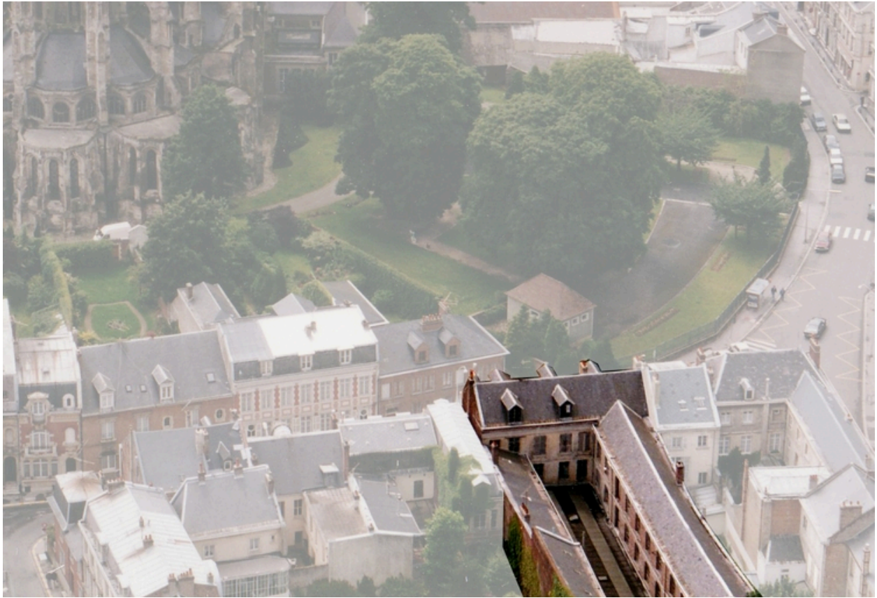
Vue aérienne du site vers 1989.