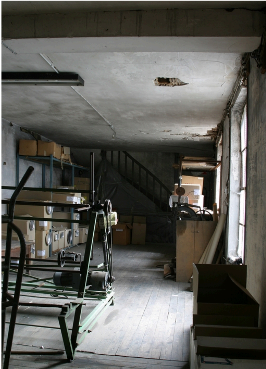
Vue intérieure des anciens magasins (fond de parcelle, 1er étage).