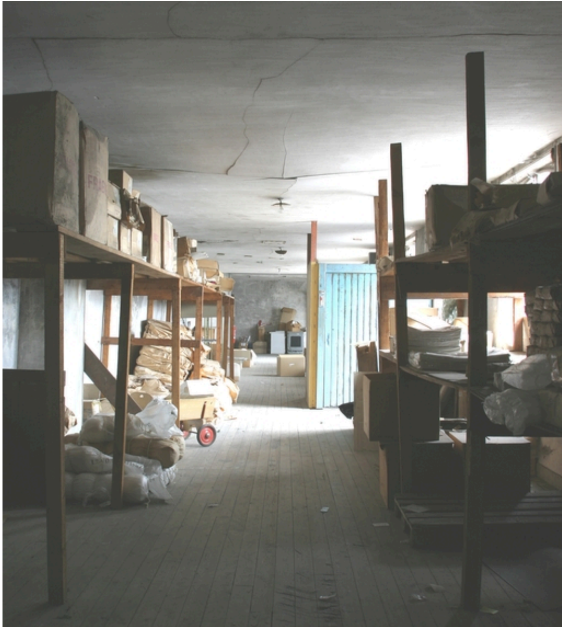
Vue intérieure des anciens magasins (aile gauche, 1er étage).