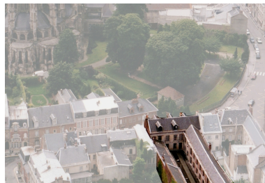
Vue aérienne du site vers 1989.