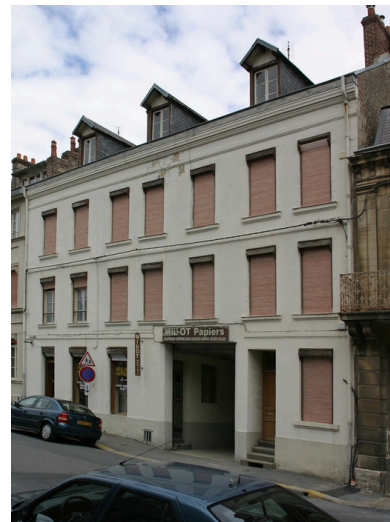
Façade antérieure.