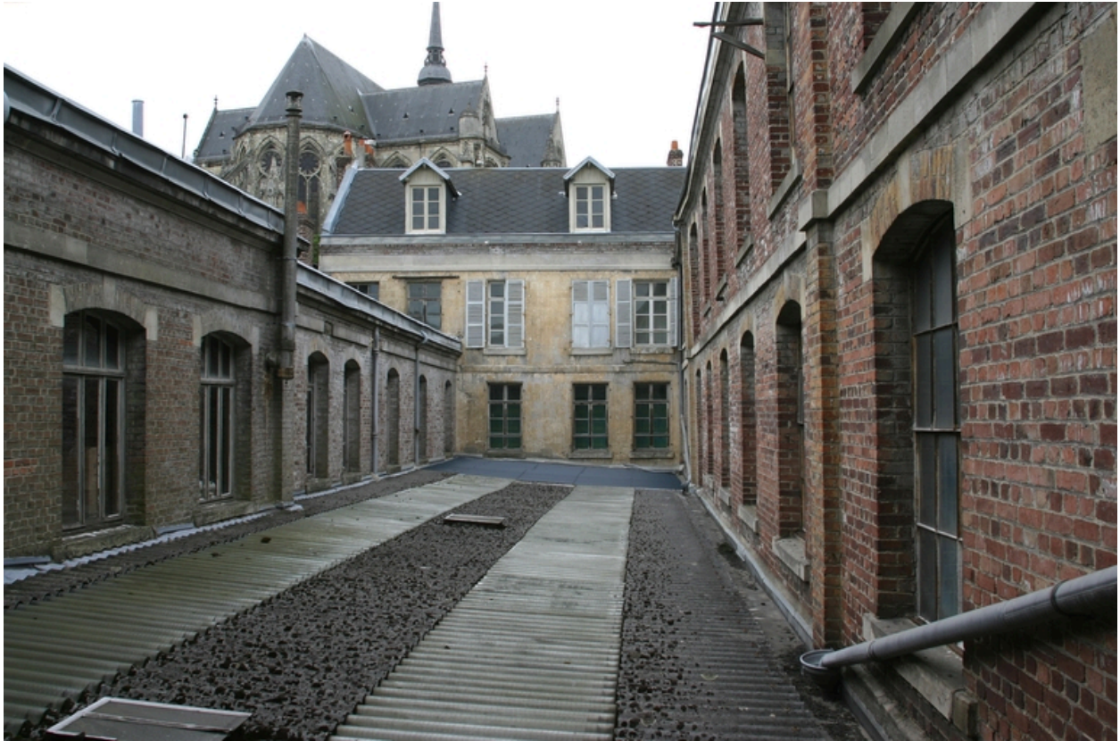
Façades sur cour.