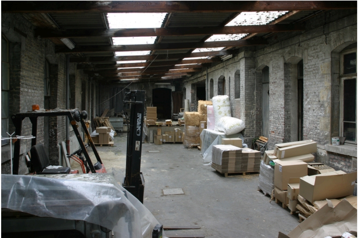
Vue de la cour couverte, depuis la porte cochère.