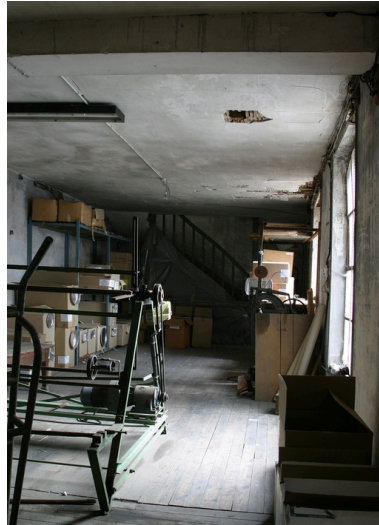
Vue intérieure des anciens magasins (fond de parcelle, 1er étage). IVR22_20050206130NUCA