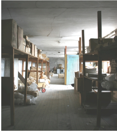
Vue intérieure des anciens magasins (aile gauche, 1er étage). IVR22_20050206129NUCA