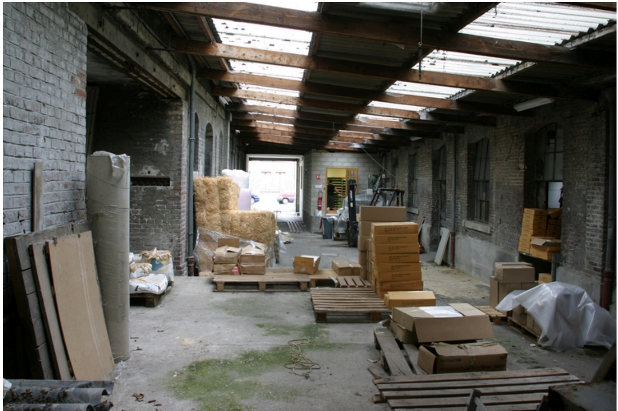
Vue de la cour couverte, depuis le fond de la cour.