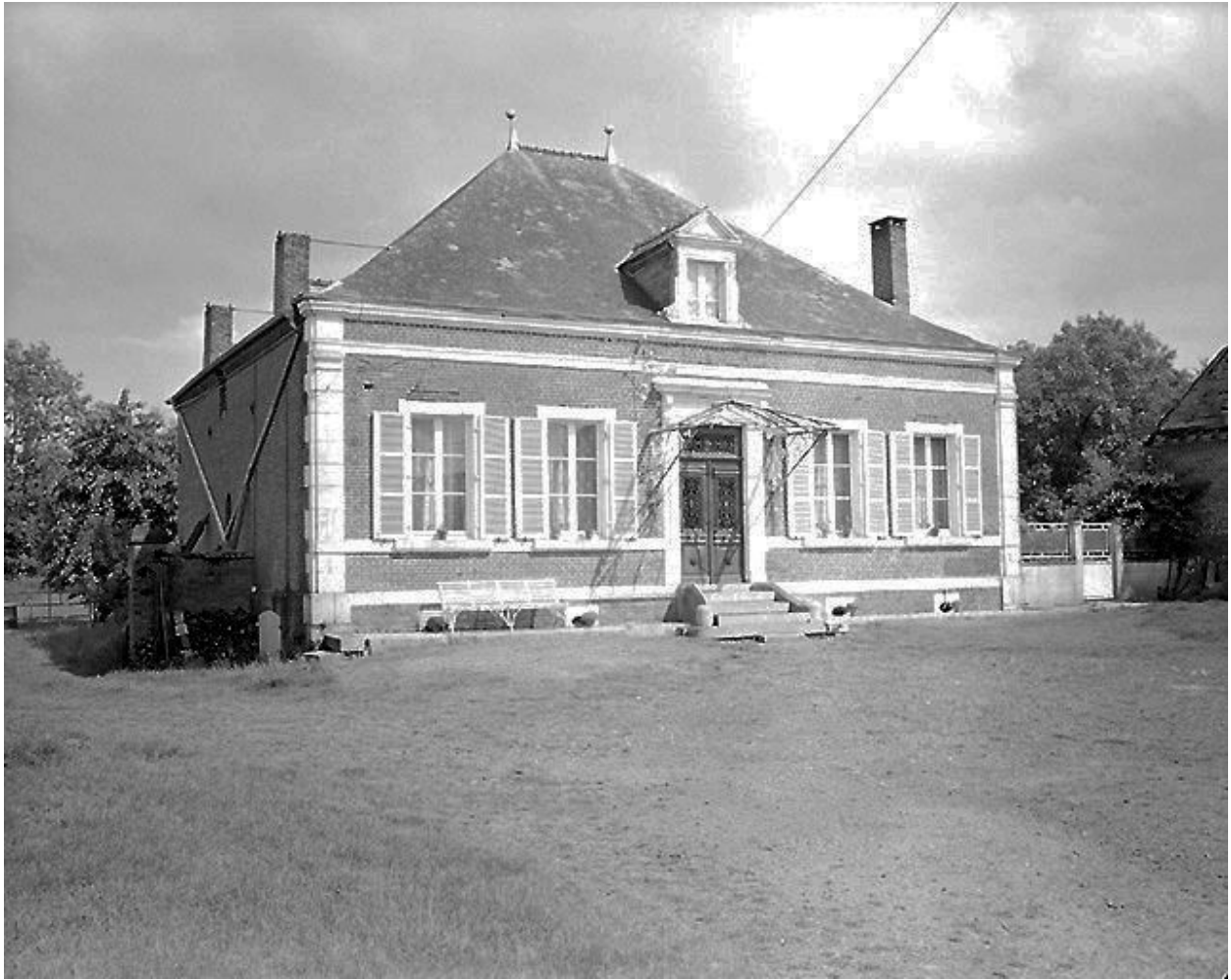
Vue principale du logis.