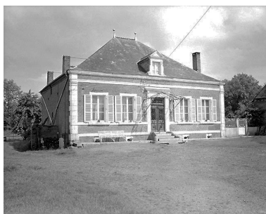
Vue principale du logis.