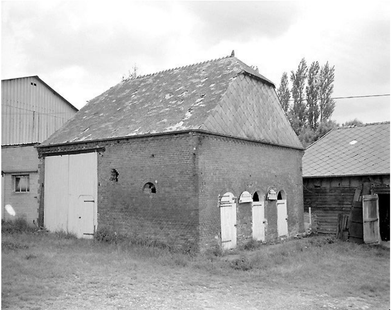
Vue de l'étable.