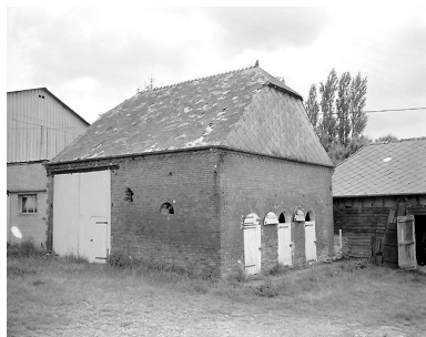
Vue de l'étable. IVR22_19980201010X