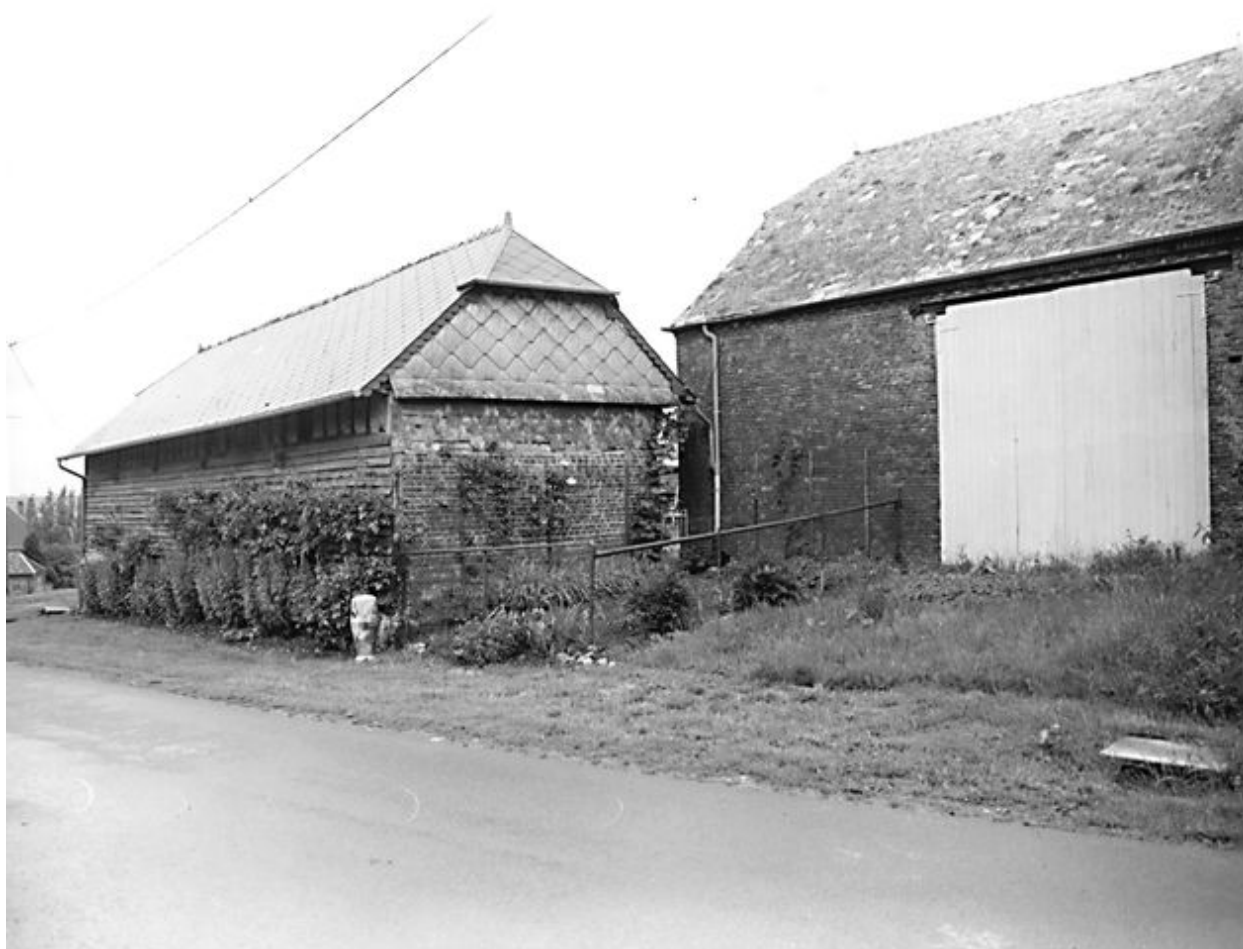
Élévation postérieure de l'étable et de la grange-étable.