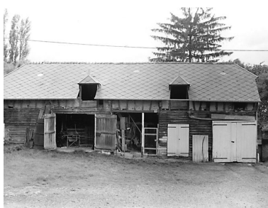
Vue de la grange-étable. IVR22_19980201009X