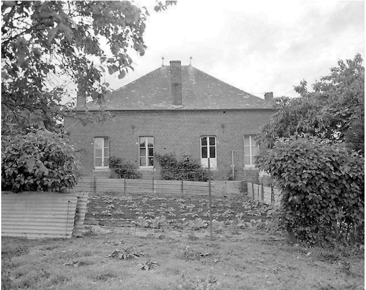
Elévation postérieure du logis.