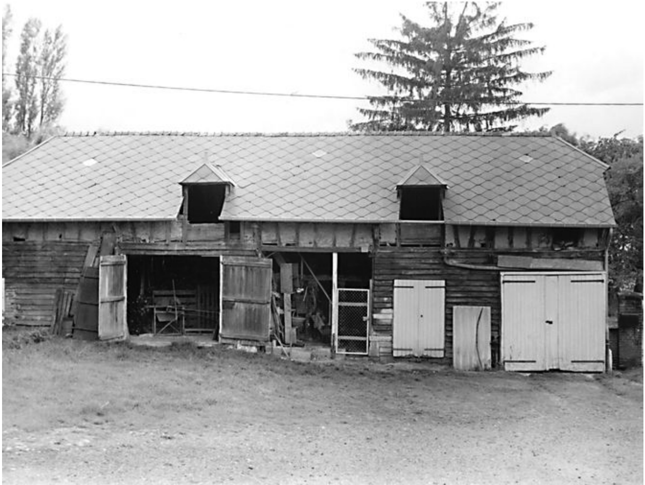
Vue de la grange-étable.