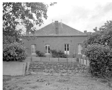
Elévation postérieure du logis.