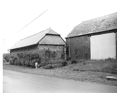
Elévation postérieure de l'étable et de la grange-étable.