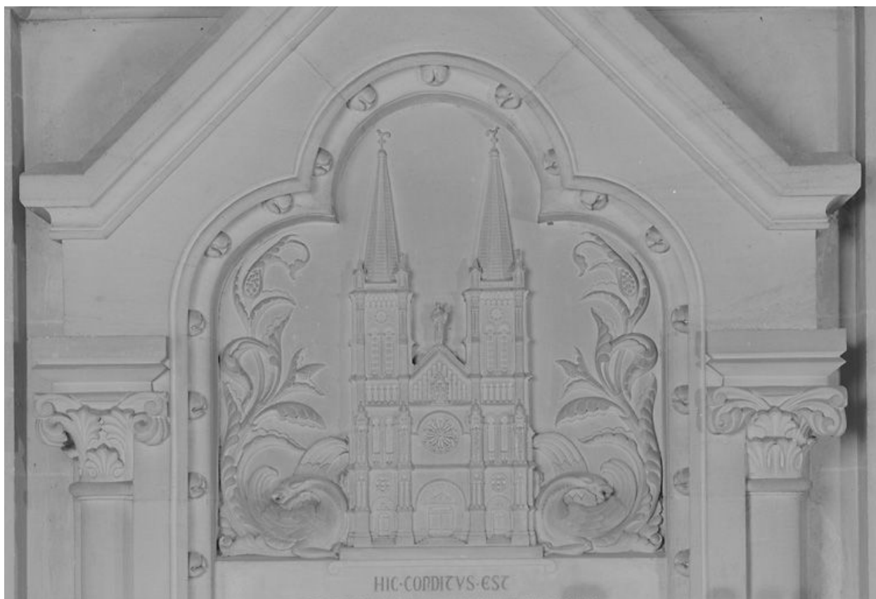
Vue de détail de la représentation figurée.