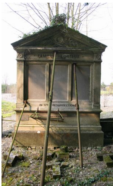
Stèle à entablement et fronton.