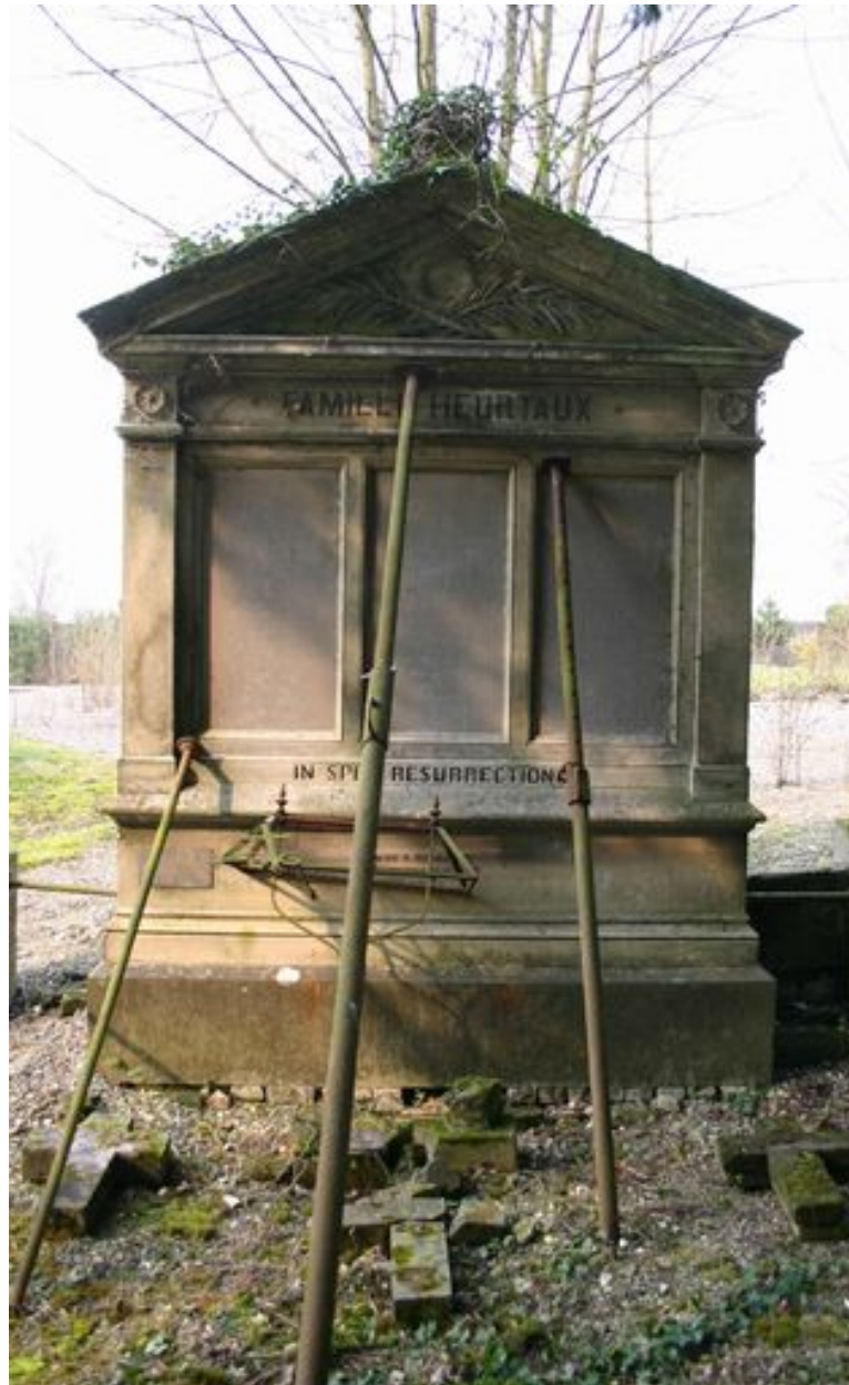
Stèle à entablement et fronton.