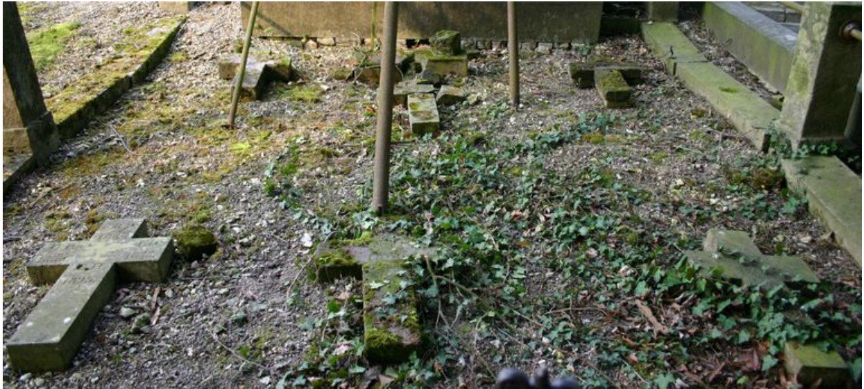
Croix funéraires (déposées).