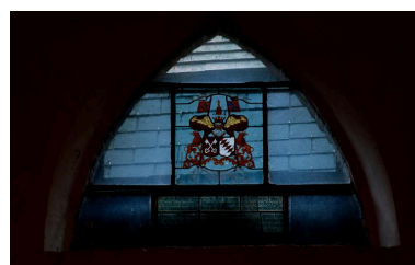
Armes des Glisy et des Clermont Tonnerre (vitrail 19 e siècle) et inscription commémorative en remploi (vitrail de 1624).