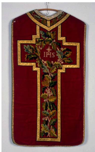
Chasuble en velours rouge. Orfrois brodés en fils chenille, décor de chêne et lettres IHS.

IVR22_20008000149ZA