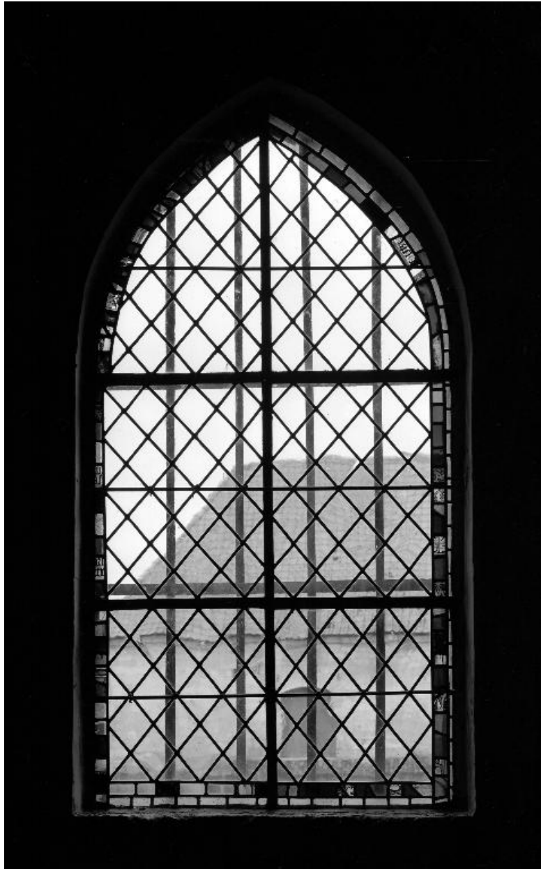
Fragments de vitraux anciens en remploi (baie ouest de la chapelle nord).