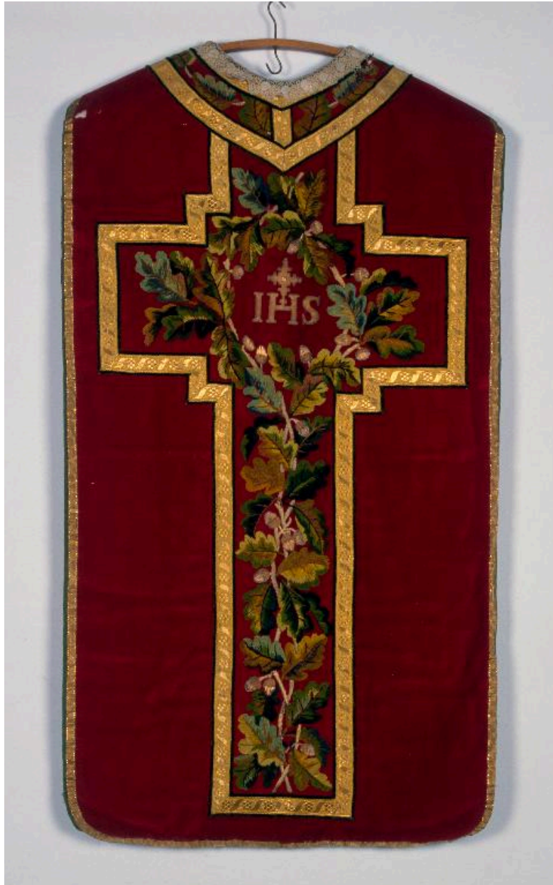
Chasuble en velours rouge. Orfrois brodés en fils chenille, décor de chêne et lettres IHS.