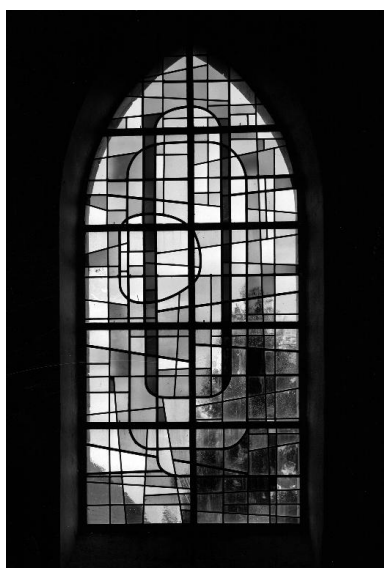
Vitrail contemporain. IVR22_19978000950X