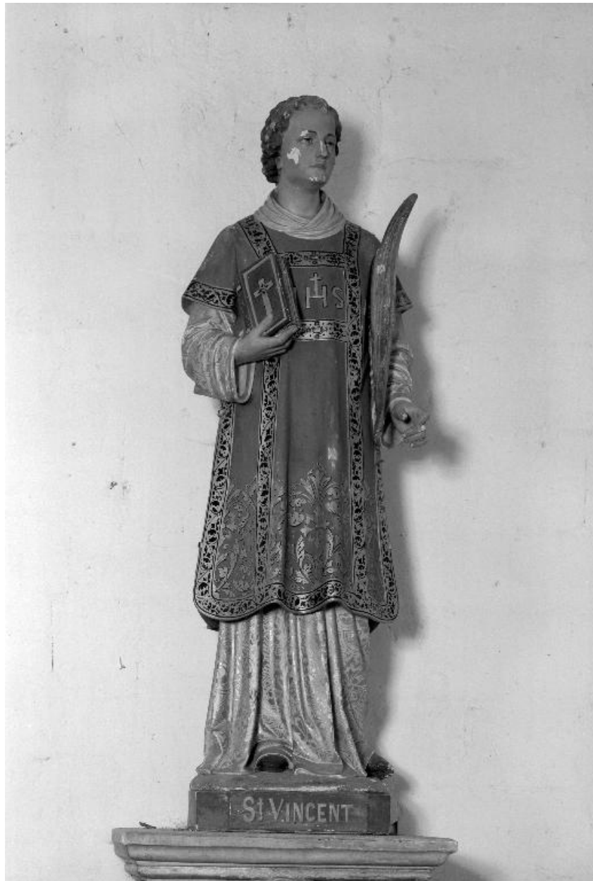
Statue de saint Vincent, signée Hesse.