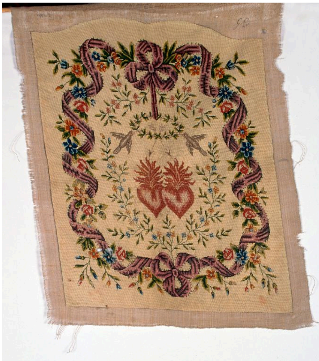
Tapiserie au demi-point sur canevas représentant les Sacrés Coeurs de Jésus et Marie.