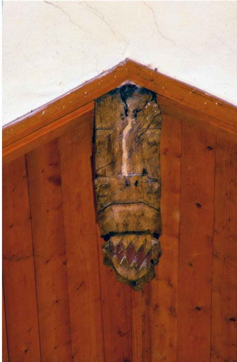
Poinçon pendant armorié portant les armes de la famille de Glisy.