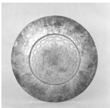
Patène portant un poinçon de garantie et titre argent après 1838.