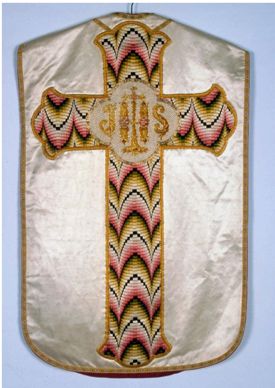
Chasuble en satin de soie blanche. Orfrois brodés en fils de coton colorés, décor géométrique et lettres IHS dans quadrilobe.