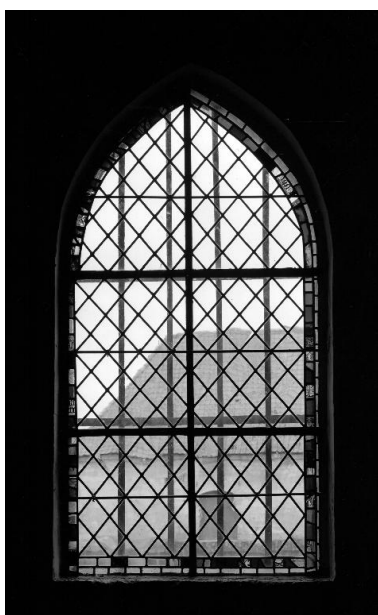
Fragments de vitraux anciens en remploi (baie ouest de la chapelle nord).