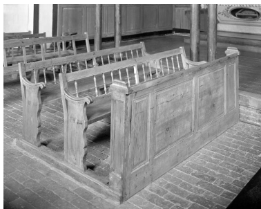
Bancs aux armes des Clermont Tonnerre.