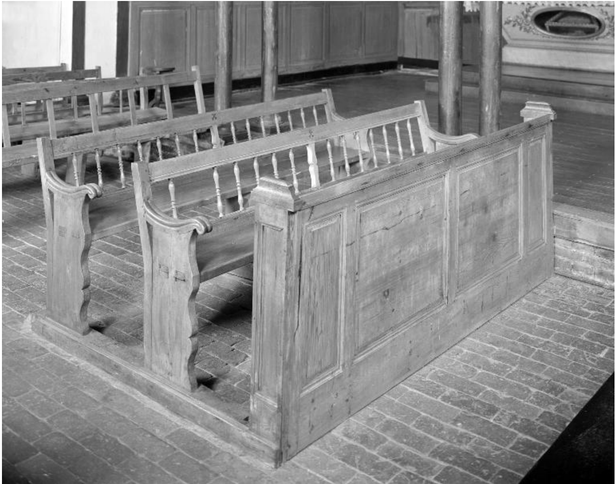
Bancs aux armes des Clermont Tonnerre.