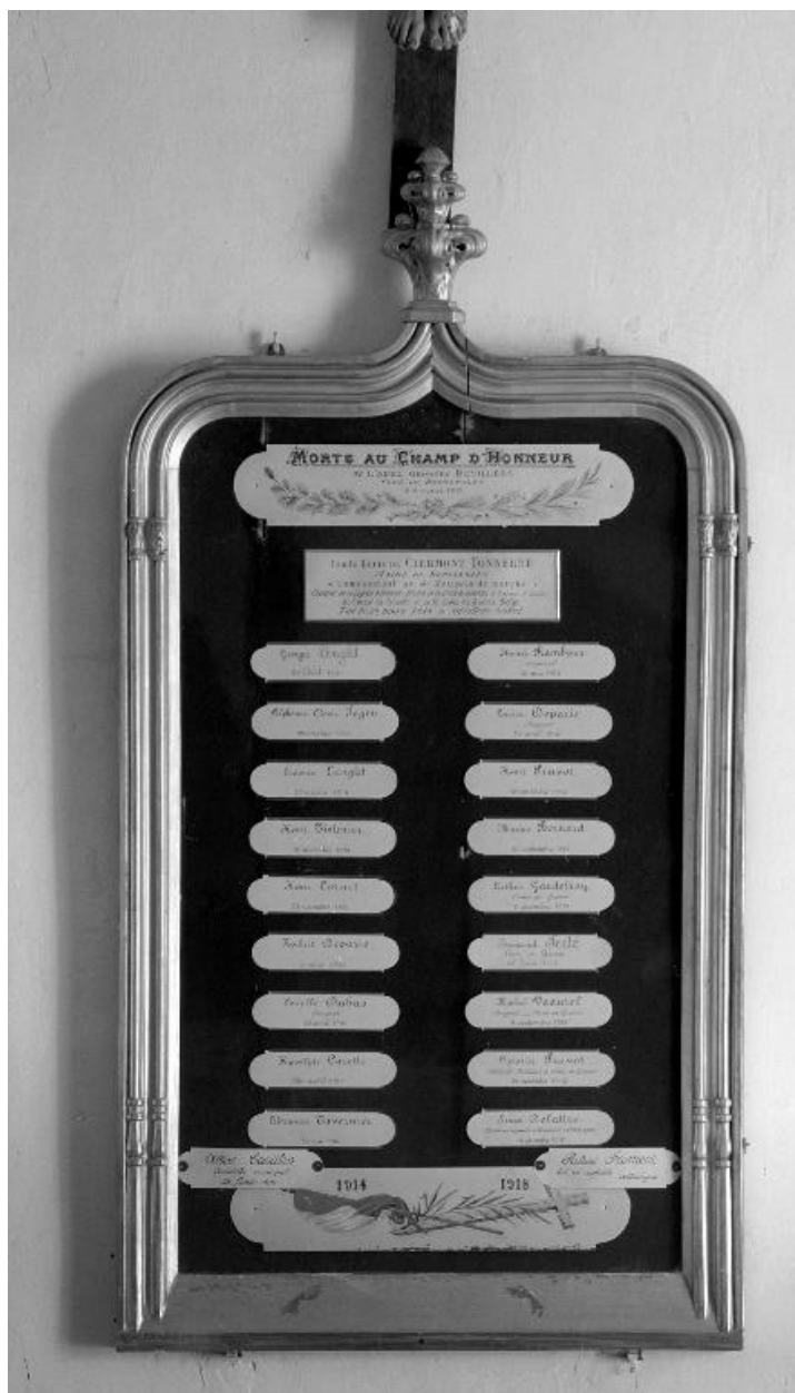
Tableau commémoratif des morts : liste des victimes de la première guerre mondiale à Bertangles, peintes à la main.