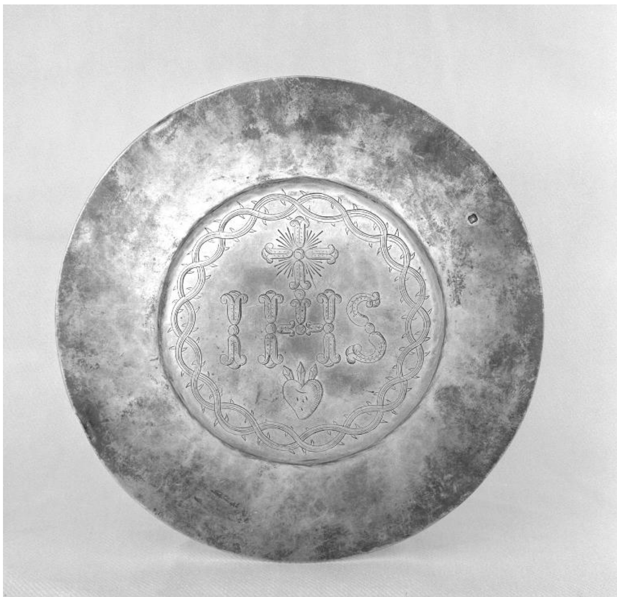
Patène portant un poinçon de garantie et titre argent après 1838.