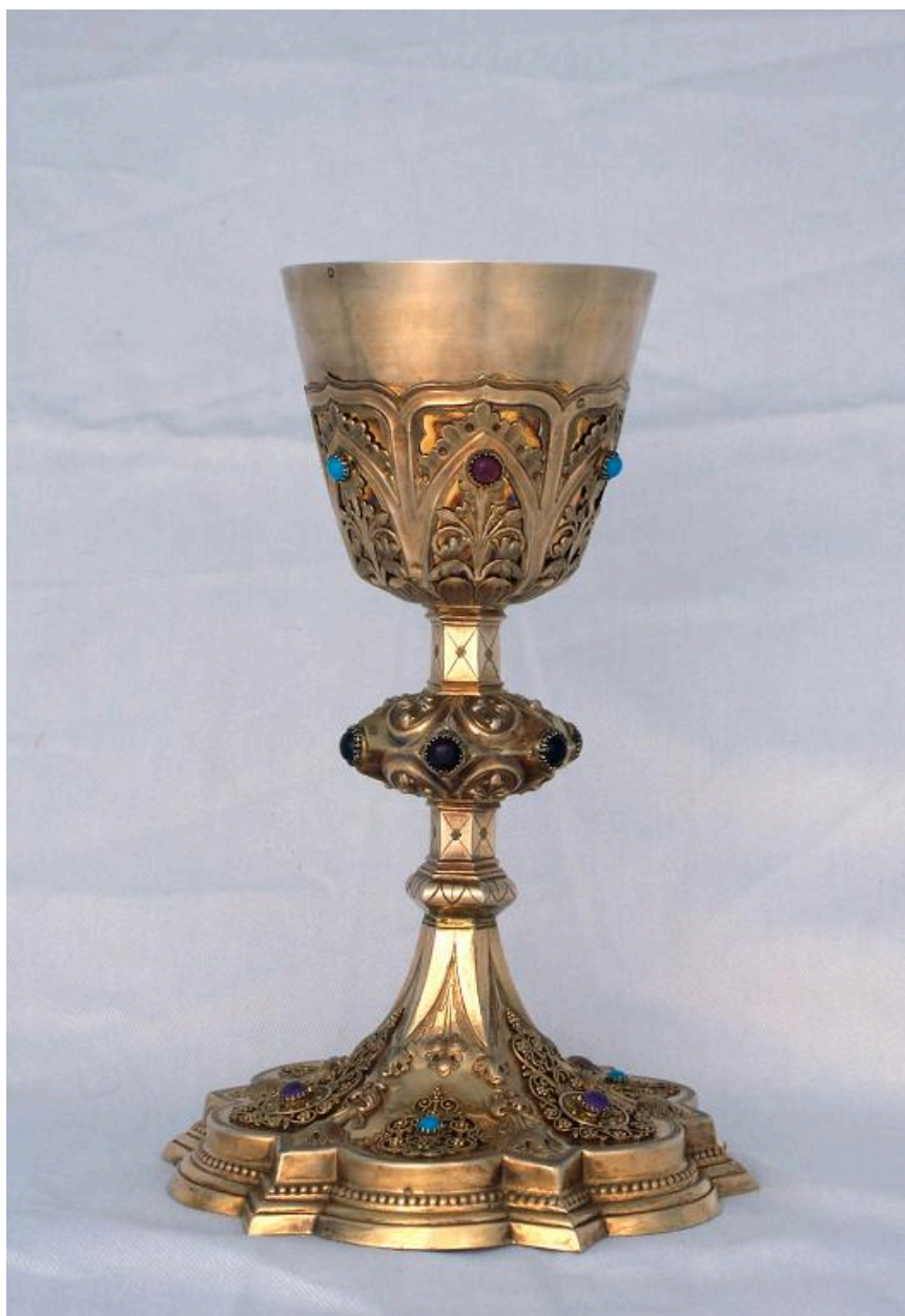
Calice en argent doré avec cabochons, par Chevron.