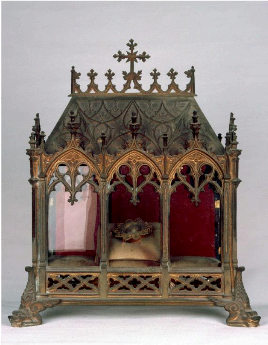
Châsse de saint Vincent.