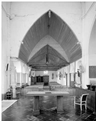
Vue intérieure de l'église, depuis le chœur. IVR22_19978000938V