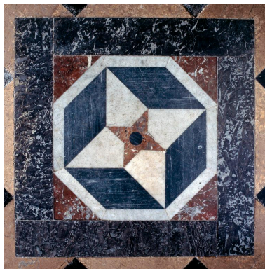
Détail de la marqueterie de marbres formant un motif d'étoile, dans le chœur. IVR22_19978001075XA