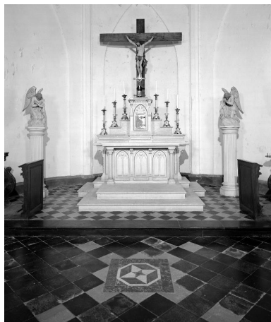
Maître-autel néogothique.