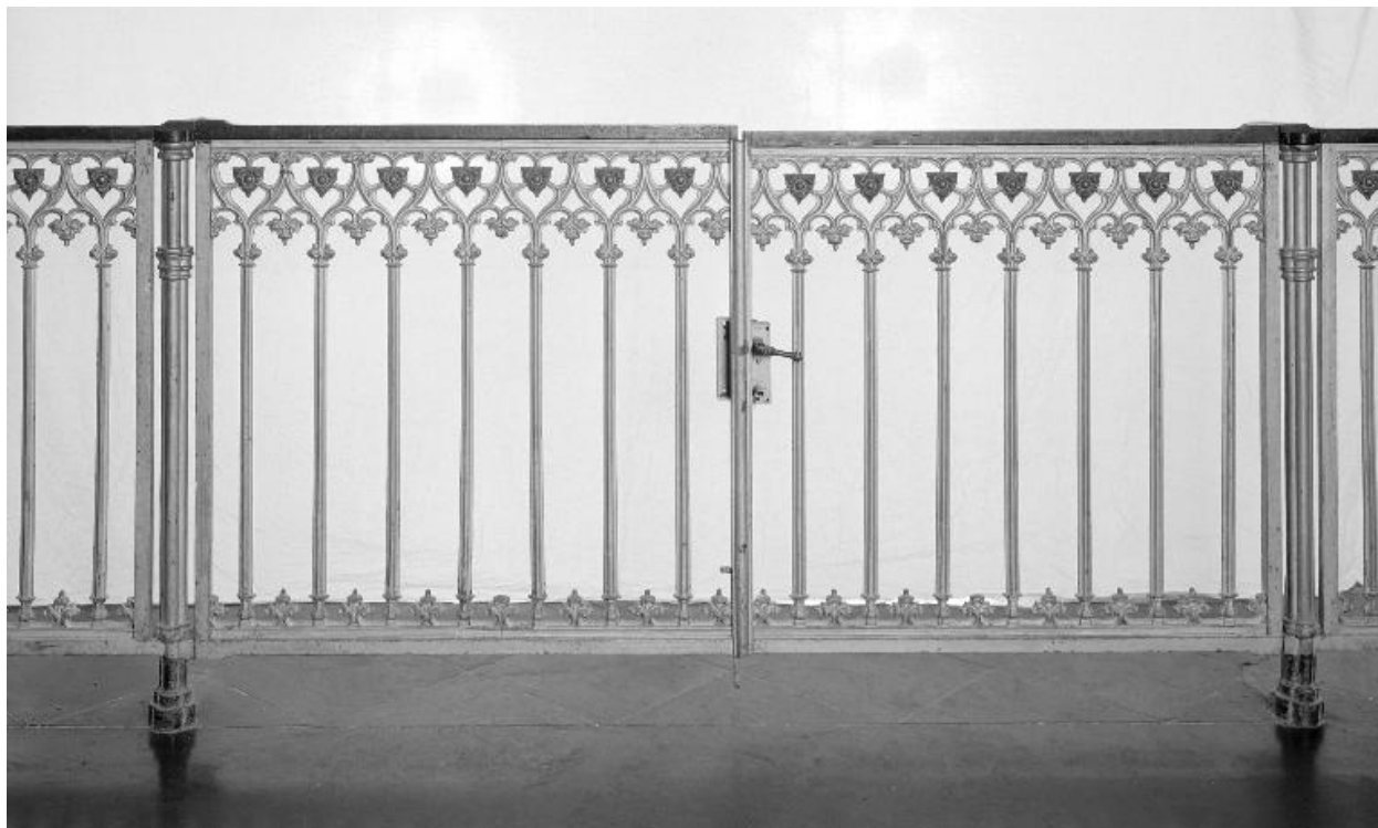
Clôture de chœur.