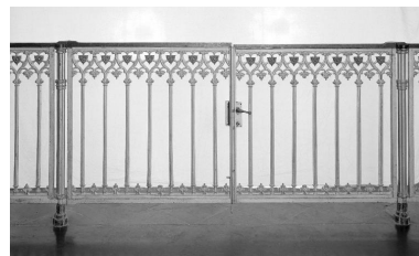
Clôture de chœur. IVR22_19978001079X