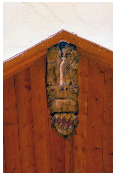
Poinçon pendant armorié portant les armes de la famille de Glisy.