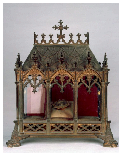
Châsse de saint Vincent.

Phot. Irwin Leullier IVR22_20008000149ZA