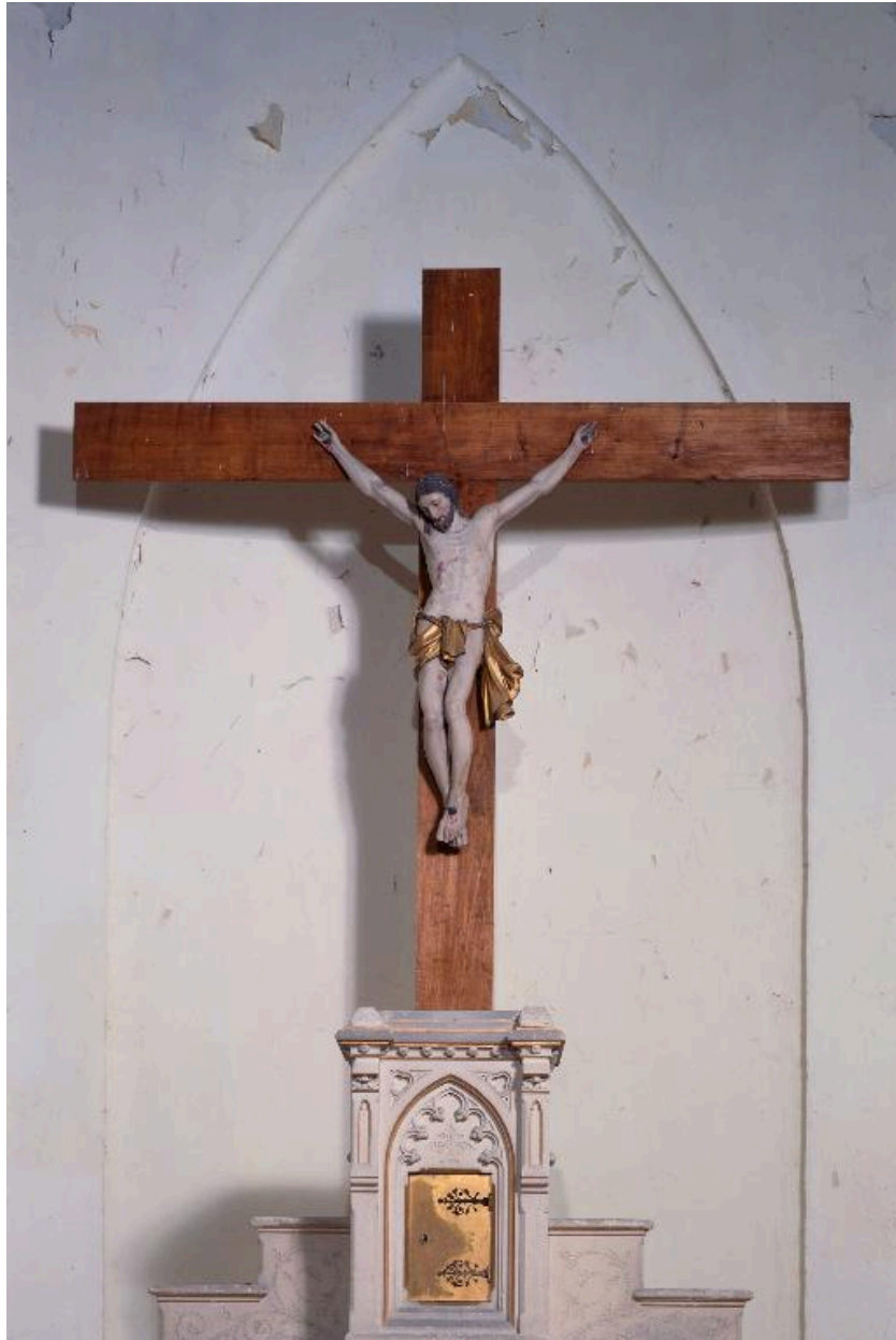
Christ en croix.