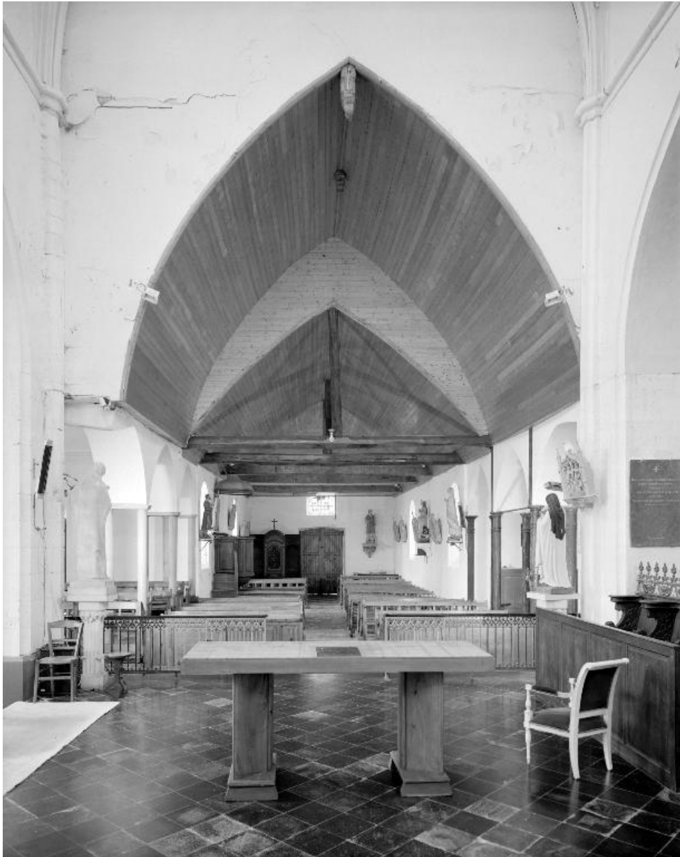
Vue intérieure de l'église, depuis le chœur.