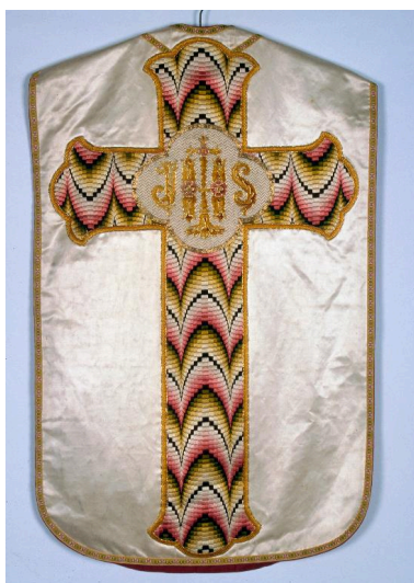
Chasuble en satin de soie blanche. Orfrois brodés en fils de coton colorés, décor géométrique et lettres IHS dans quadrilobe.

IVR22_20008000130ZA