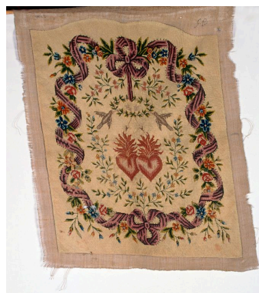
Tapisserie au demi-point sur canevas représentant les Sacrés Coeurs de Jésus et Marie.

Phot. Irwin Leullier IVR22_20008000869ZA