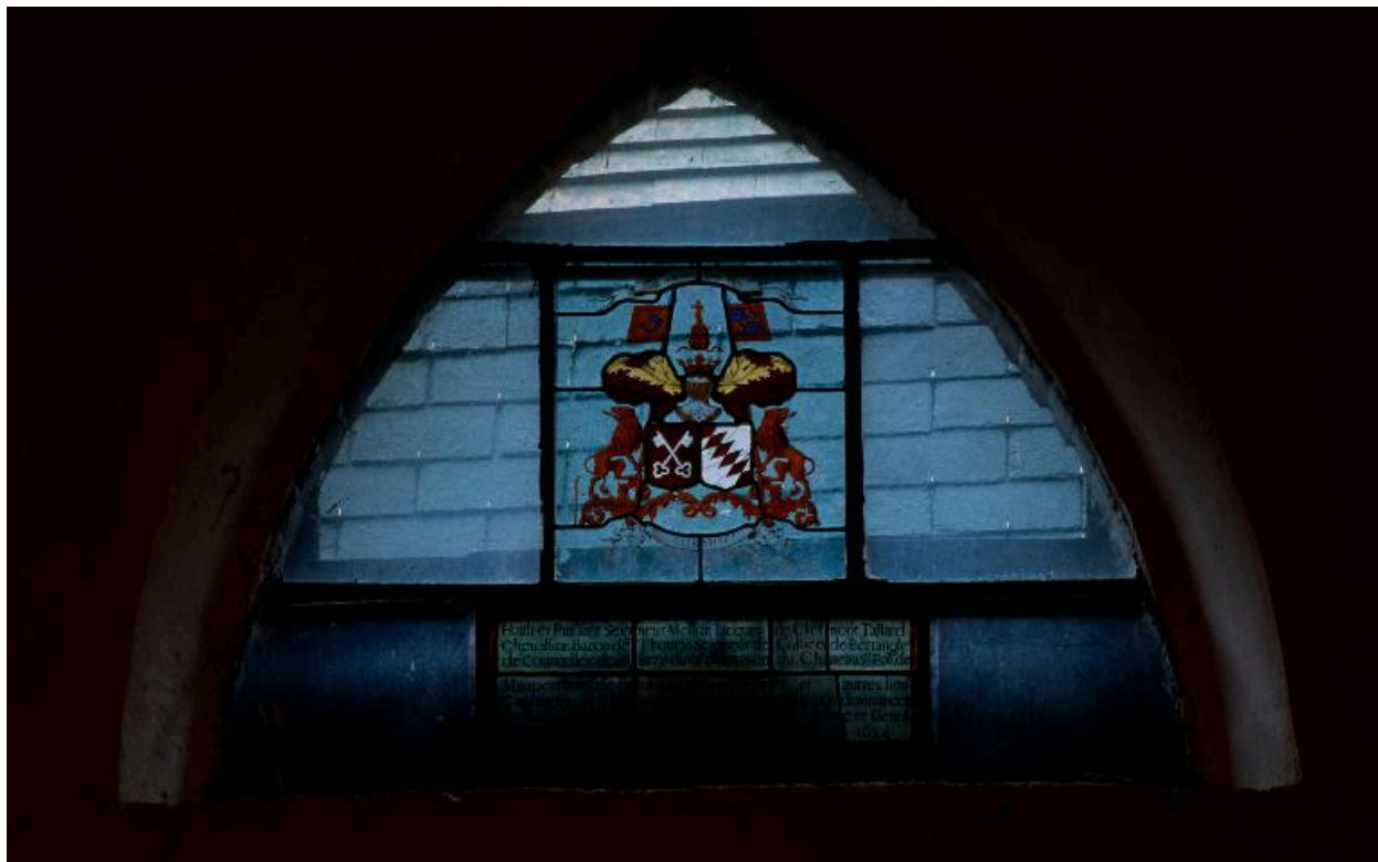
Armes des Glisy et des Clermont Tonnerre (vitrail 19e siècle) et inscription commémorative en remploi (vitrail de 1624).