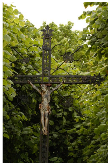
Détail sur la partie supérieure de la croix.