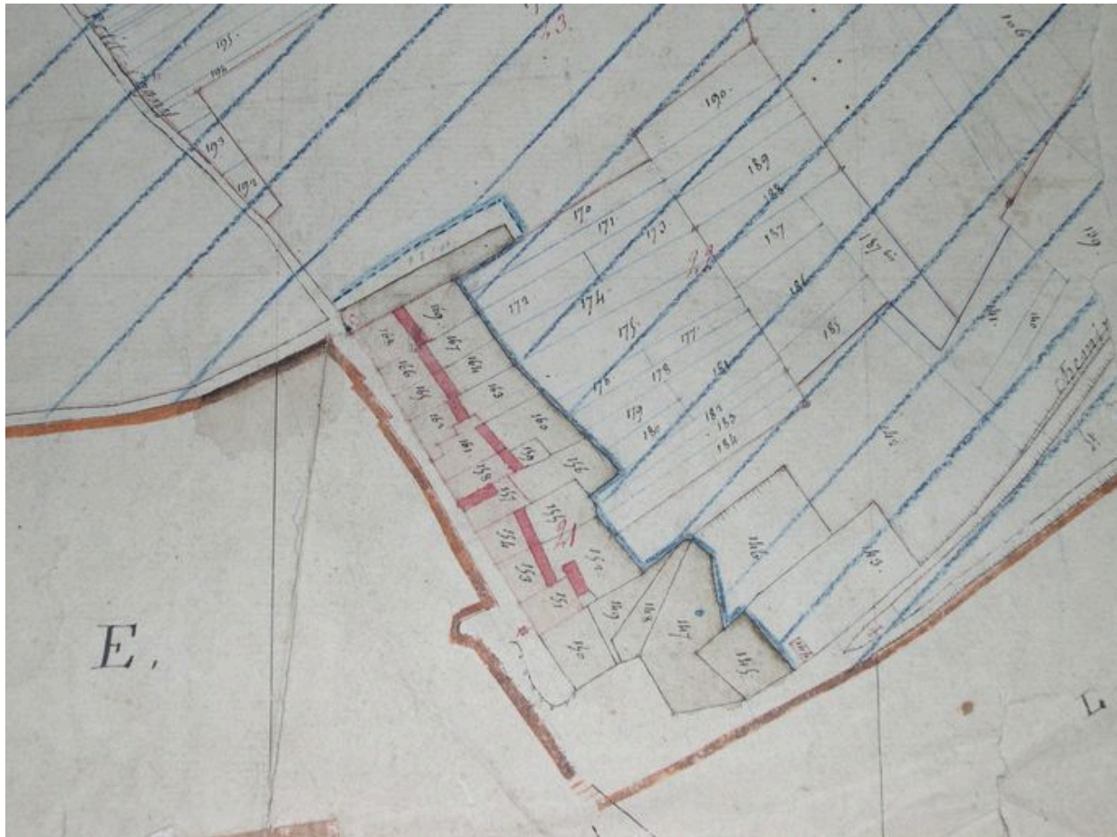
Extrait du cadastre de 1810 (DGI).