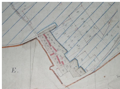
Extrait du cadastre de 1810 (DGI).