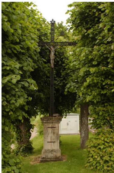
Vue générale. IVR22_20038000420NUCA