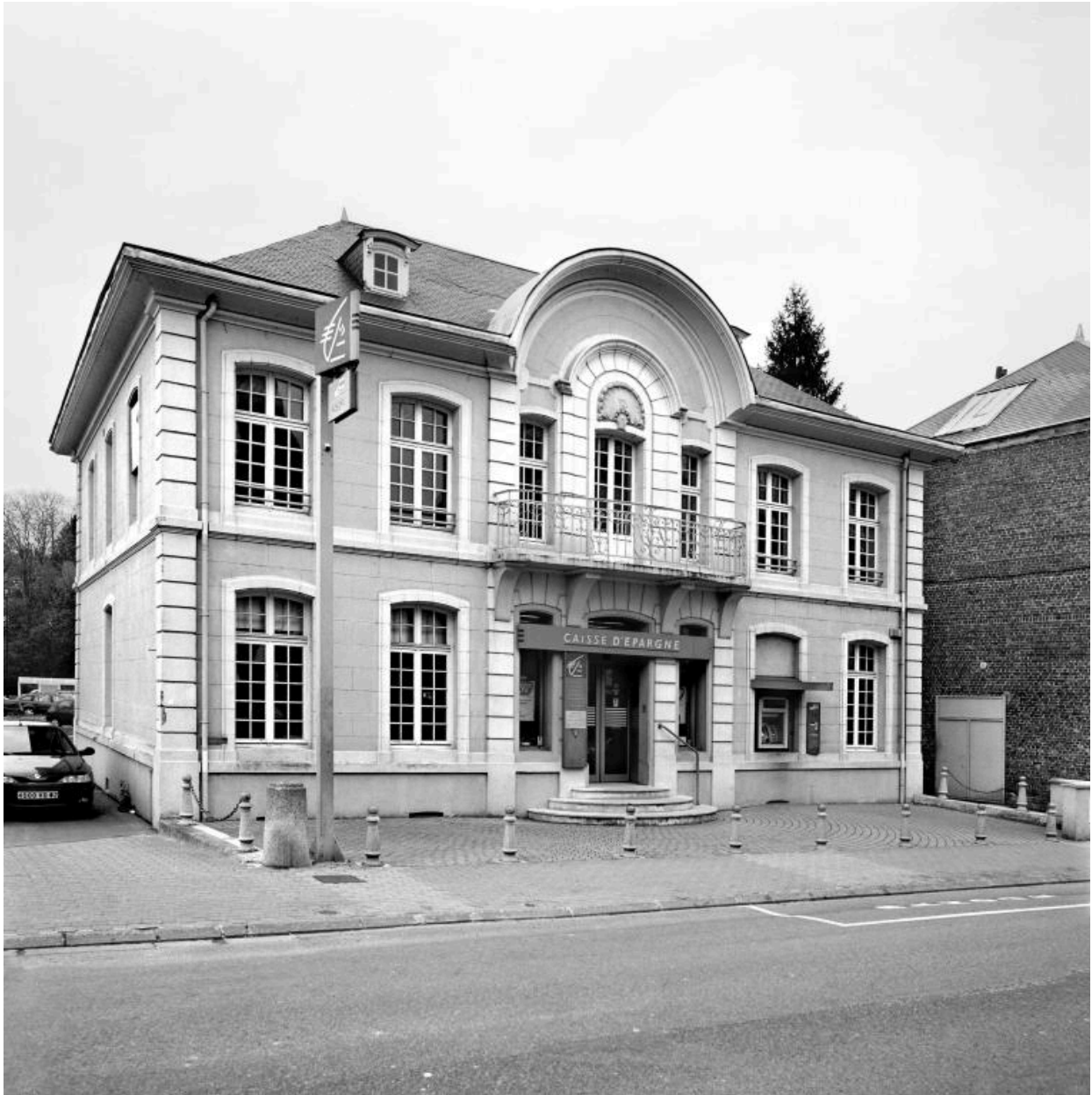
Vue de la façade sur rue de l'ancien logis patronal, abritant aujourd'hui l'agence locale de la Caisse d'épargne.