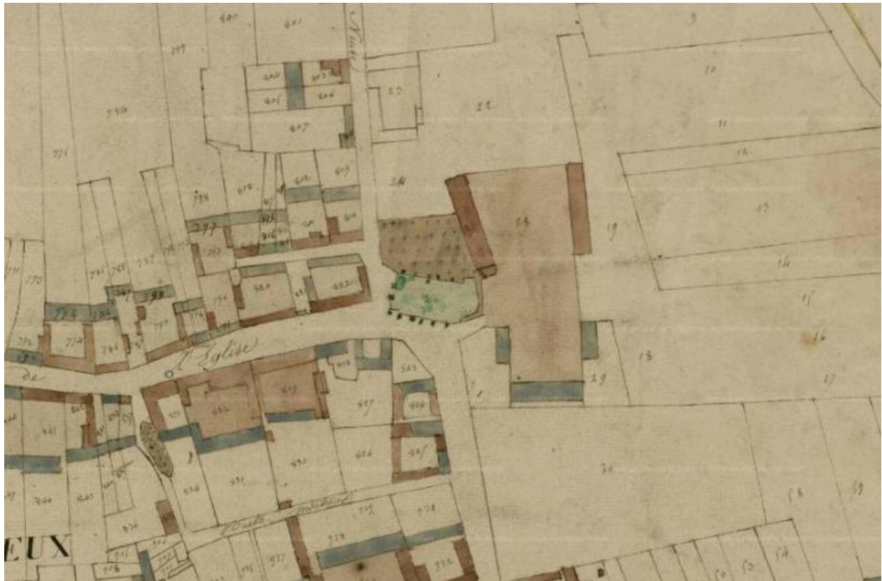
L'église, le cimetière et le château de Villers-Bretonneux sur le cadastre napoléonien (AD Somme).