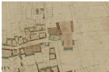
L'église, le cimetière et le château de Villers-Bretonneux sur le cadastre napoléonien (AD Somme).

Repro. Archives départementales de la Somme IVR32_20168005658NUCA