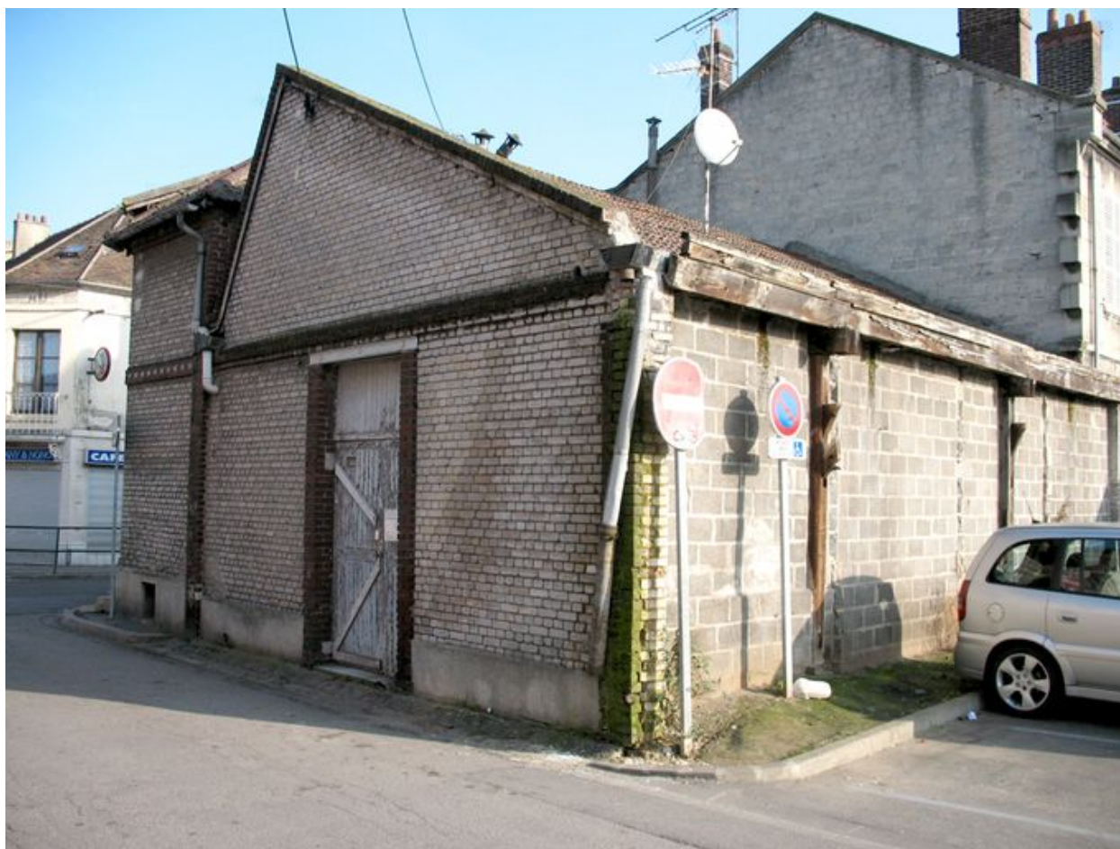
Vestige d'une travée en shed de l'atelier de menuiserie (Nogent-sur-Oise).