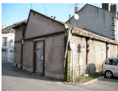
Vestige d'une travée en shed de l'atelier de menuiserie (Nogent-sur-Oise). IVR22_20096005048NUCA