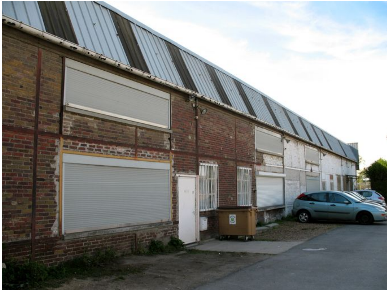
Façade est de l'ancien atelier des fûts étanches.