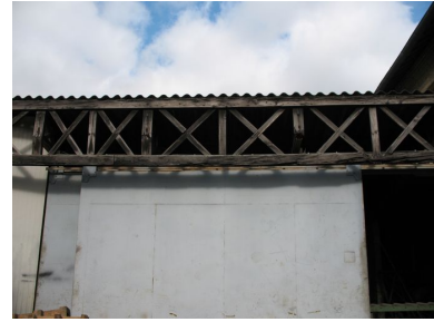
Détail de la charpente en bois entre l'atelier et le magasin. IVR22_20096005157NUCA