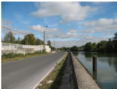
L'Oise, le quai d'Amont et l'ancien site de la tonnellerie.