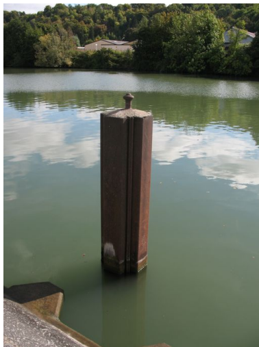
Bittes d'amarrage en fonte de l'ancien port de la tonnellerie.