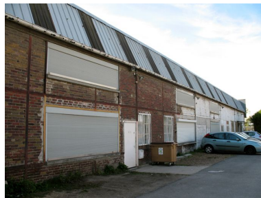
Façade est de l'ancien atelier des fûts étanches.