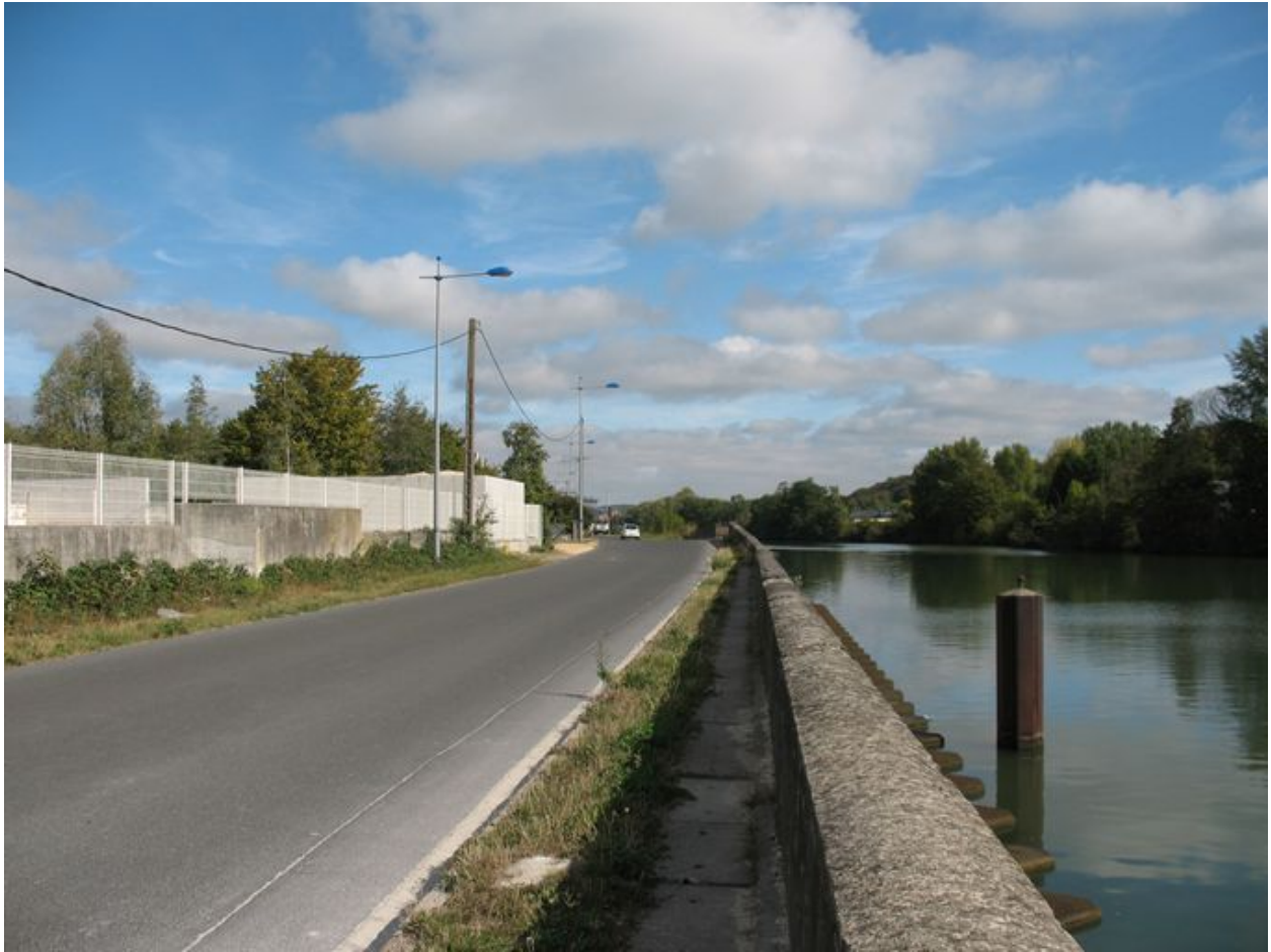
L'Oise, le quai d'Amont et l'ancien site de la tonnellerie.