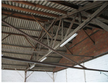
Détail de la charpente en bois du magasin de stock des fûts. IVR22_20096005156NUCA