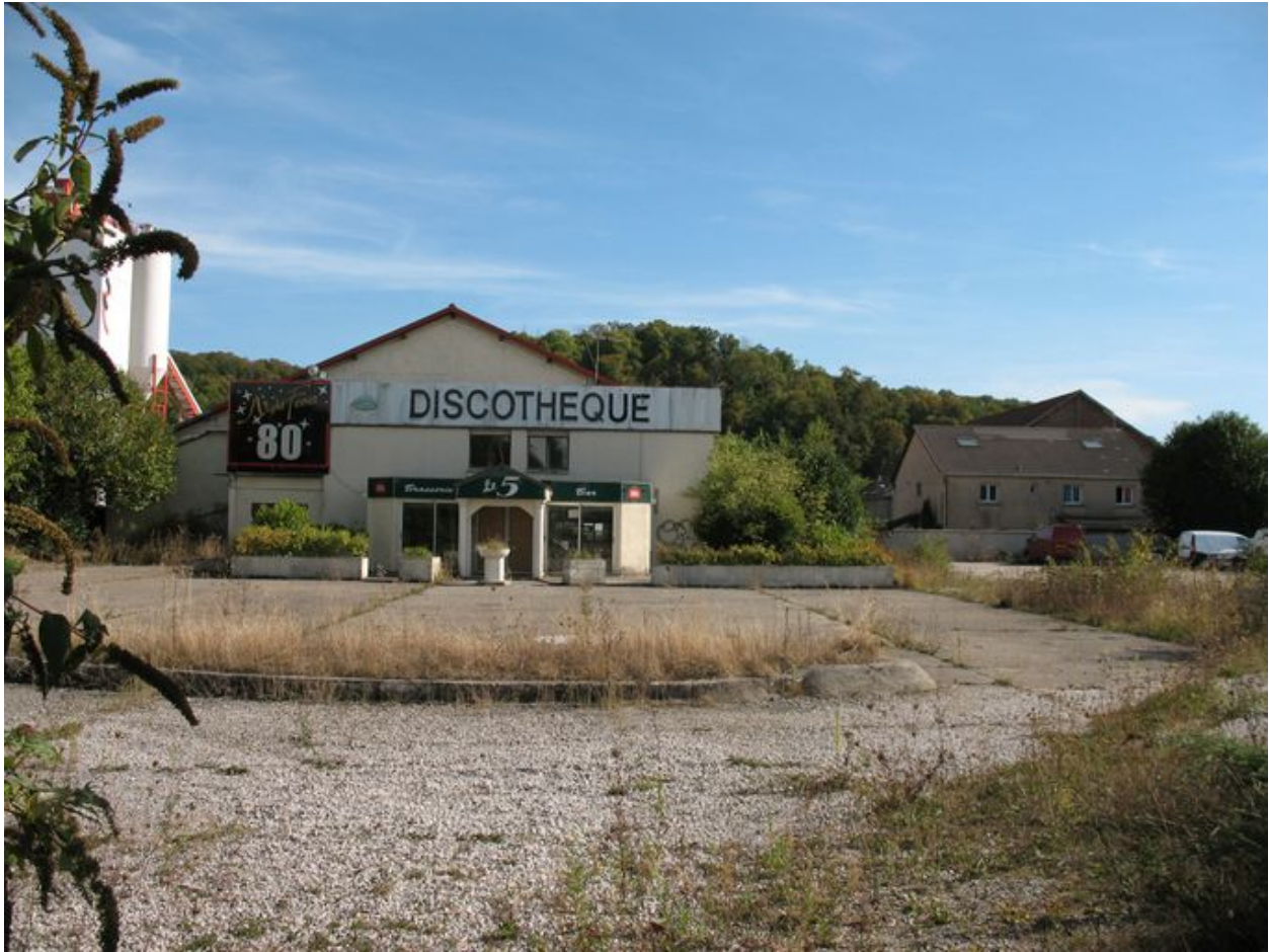
Ancienne scierie transformée en discothèque.