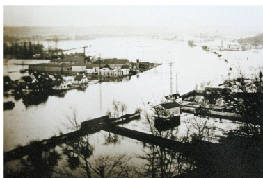
La tonnellerie sous les eaux de l'Oise lors de la crue de janvier 1926.