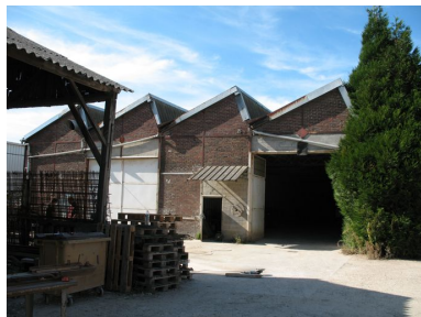
Anciens ateliers de vernissage et de vérification des fûts étanches.