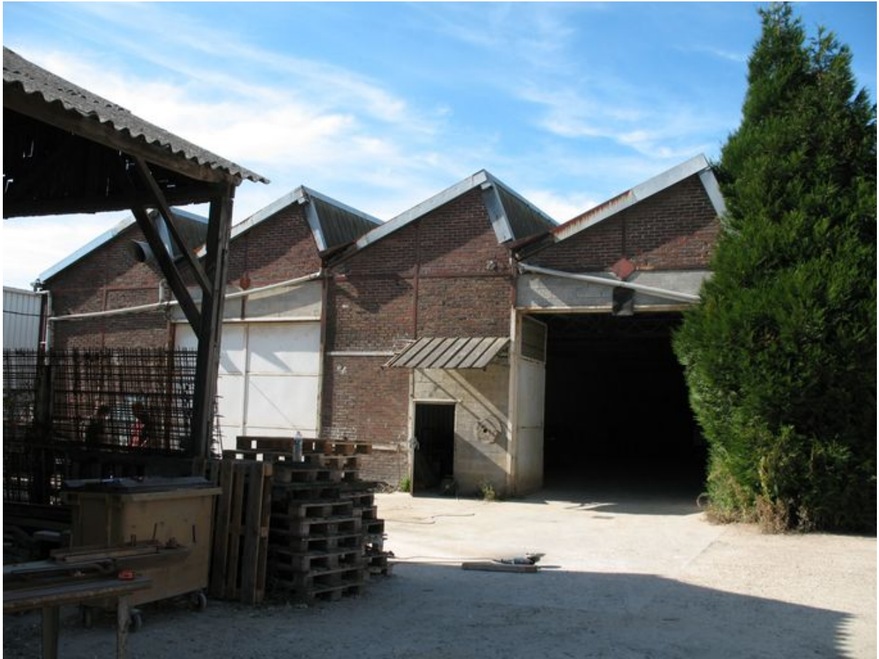
Anciens ateliers de vernissage et de vérification des fûts étanches.