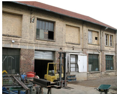
Façade ouest de l'ancien atelier des fûts d'emballage. IVR22_20096005144NUCA