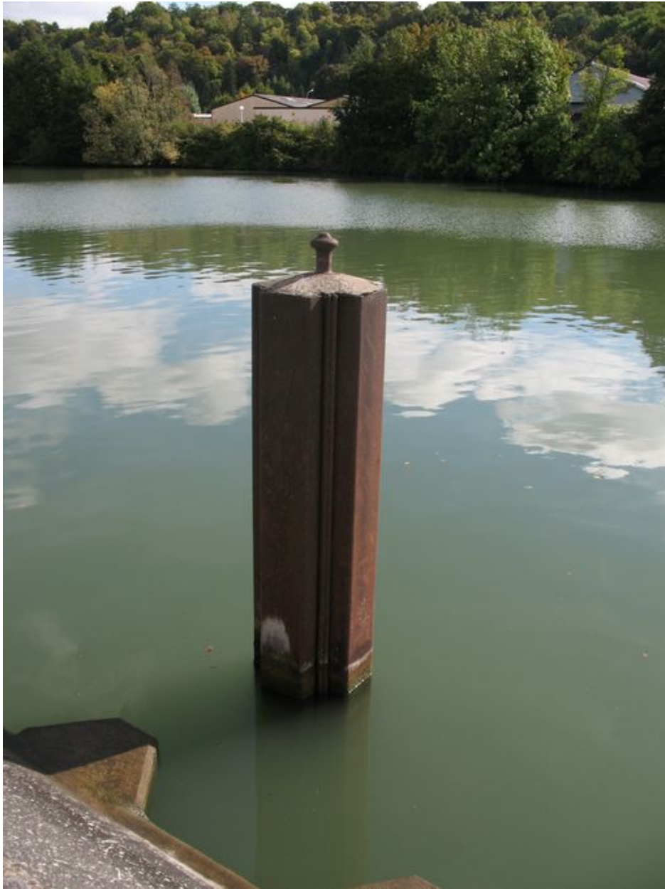
Bittes d'amarrage en fonte de l'ancien port de la tonnellerie.