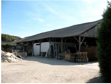
Hangar en bois construit pour le stock des fûts. IVR22_20096005155NUCA