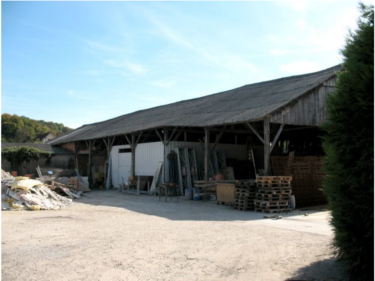
Hangar en bois construit pour le stock des fûts.