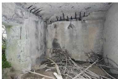
Vue intérieure, salle sud, vers l'ouest