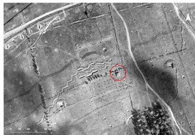
Situation de l'édifice le 8 août 1918 (cercle rouge). A l'ouest et au sud : une voie ferrée de faible écartement, au nord une rangée d'arbres puis un réseau de tranchées derrière protégé de 6 mètres de fil barbelé. En haut, la route d'Aubers à Fromelles