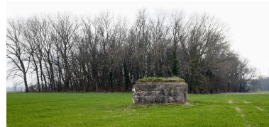
Vue générale vers le sud IVR31_20155900601NUCA