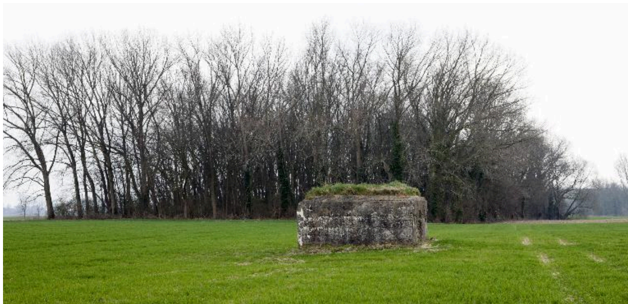
Vue générale vers le sud