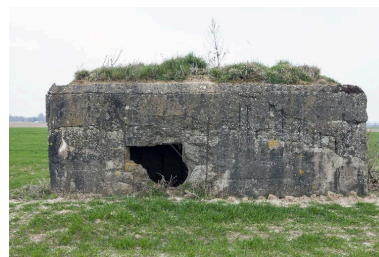
Elévation est IVR31_20155900603NUCA