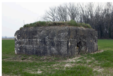
Vue générale vers le sud-est. IVR31_20155900602NUCA