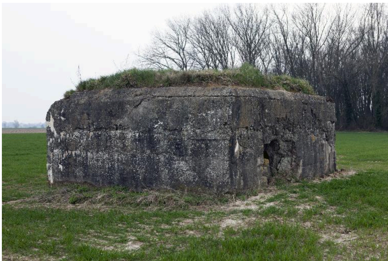
Vue générale vers le sud-est.