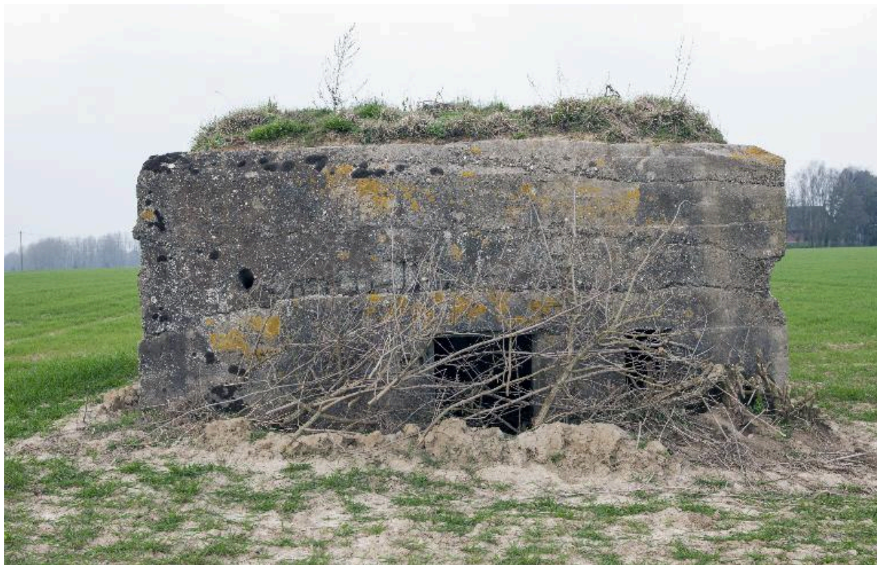
Elévation sud, entrée