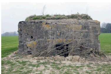
Elévation sud, entrée