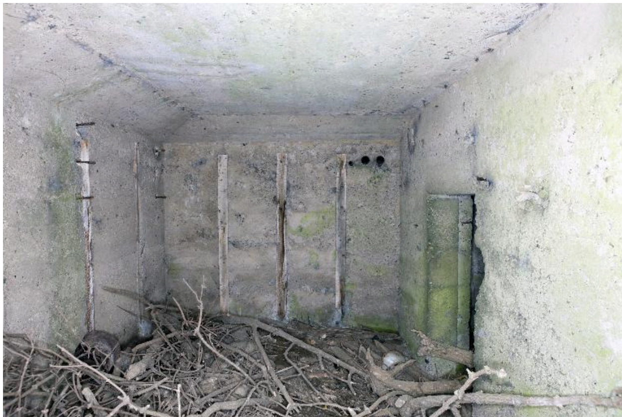
Vue intérieure, salle nord, vers l'est