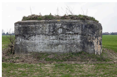
Elévation nord.