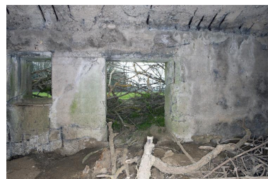
Vue intérieure, salle sud, vers l'est