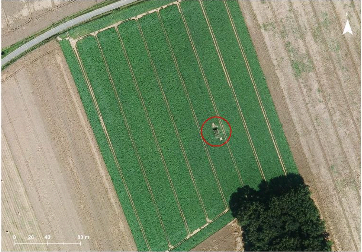
Situation de l'édifice en 2015. En haut, la route d'Aubers à Fromelles