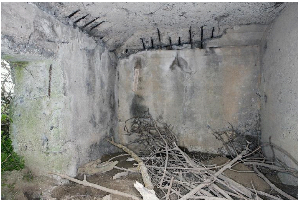
Vue intérieure, salle sud, vers l'ouest