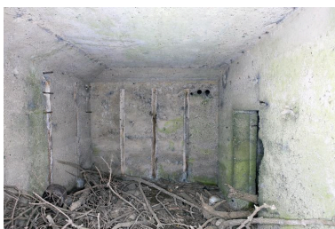
Vue intérieure, salle nord, vers l'est