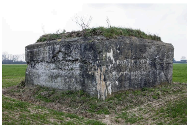
Vue vers de sud-ouest IVR31_20155900606NUCA