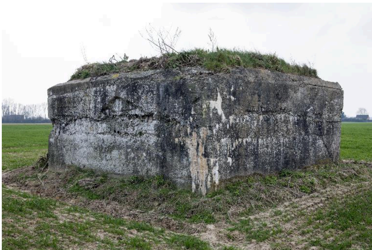
Vue vers de sud-ouest