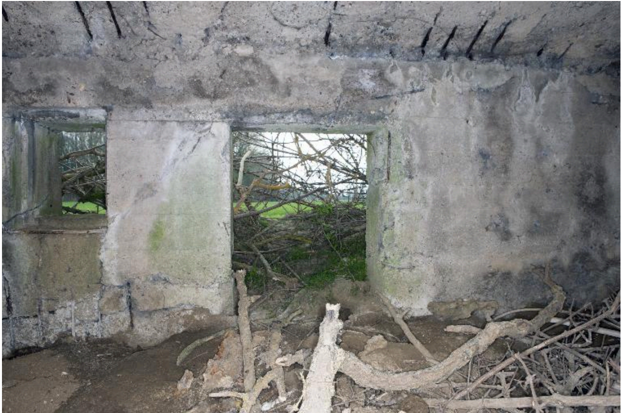
Vue intérieure, salle sud, vers l'est