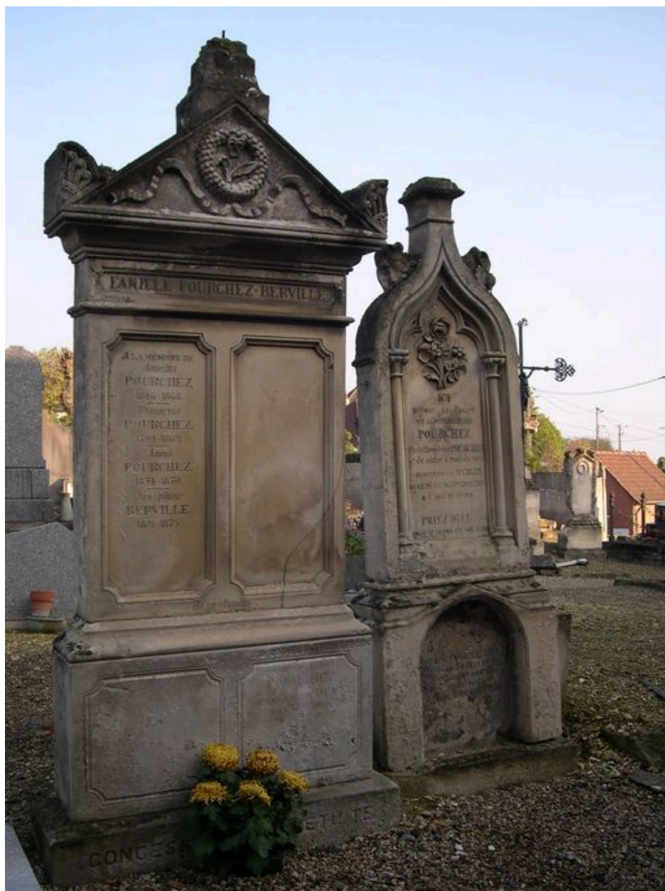
Vue des stèles.