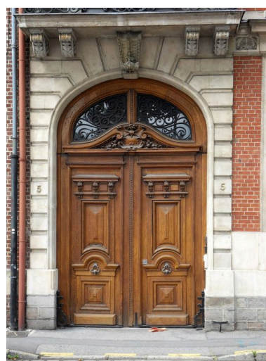
Vue de détail du portail. IVR22_20118010035NUCA