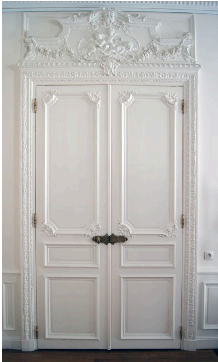
Porte d'une des chambres du premier étage.