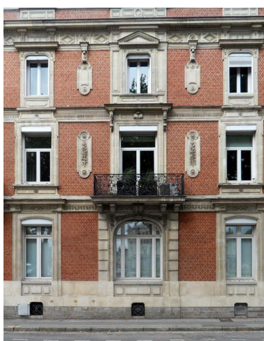
Vue de détail des trois travées centrales de la façade antérieure.