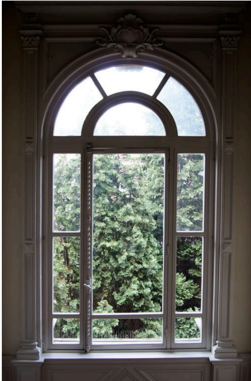
Baie éclairant la cage de l'escalier.