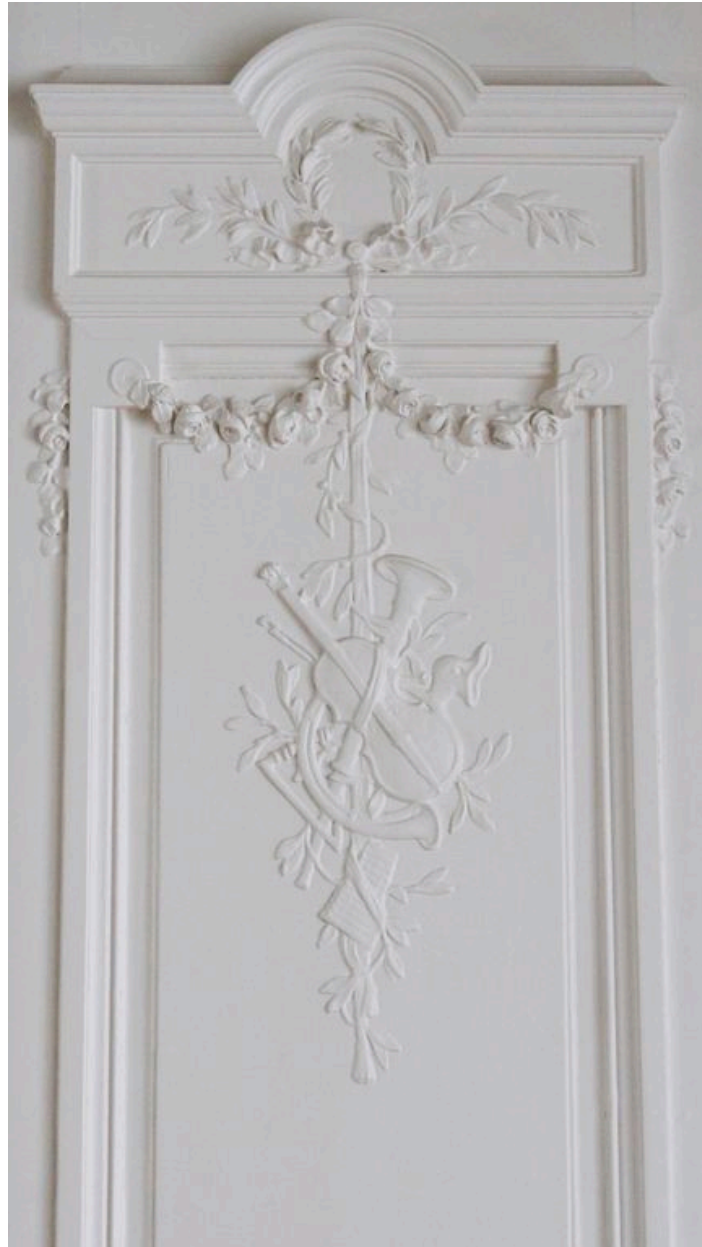
Vue du décor sculpté des portes de la salle à manger.