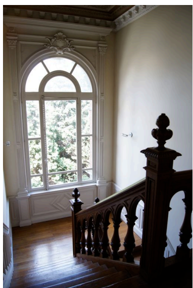
Vue de la cage d'escalier, depuis le palier du premier étage.