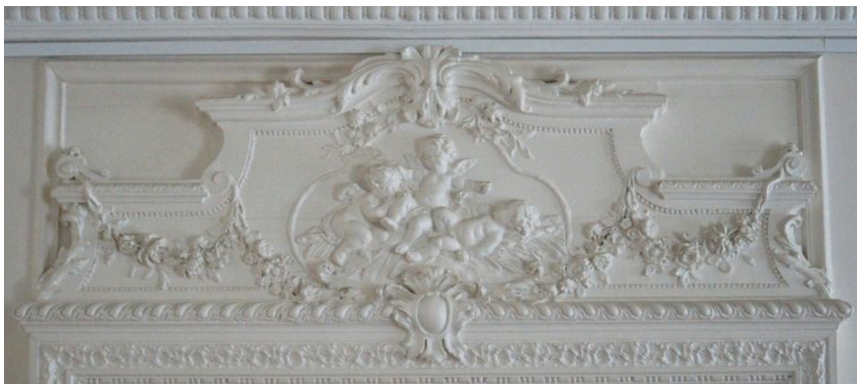
Trumeau de la porte d'une chambre du premier étage.