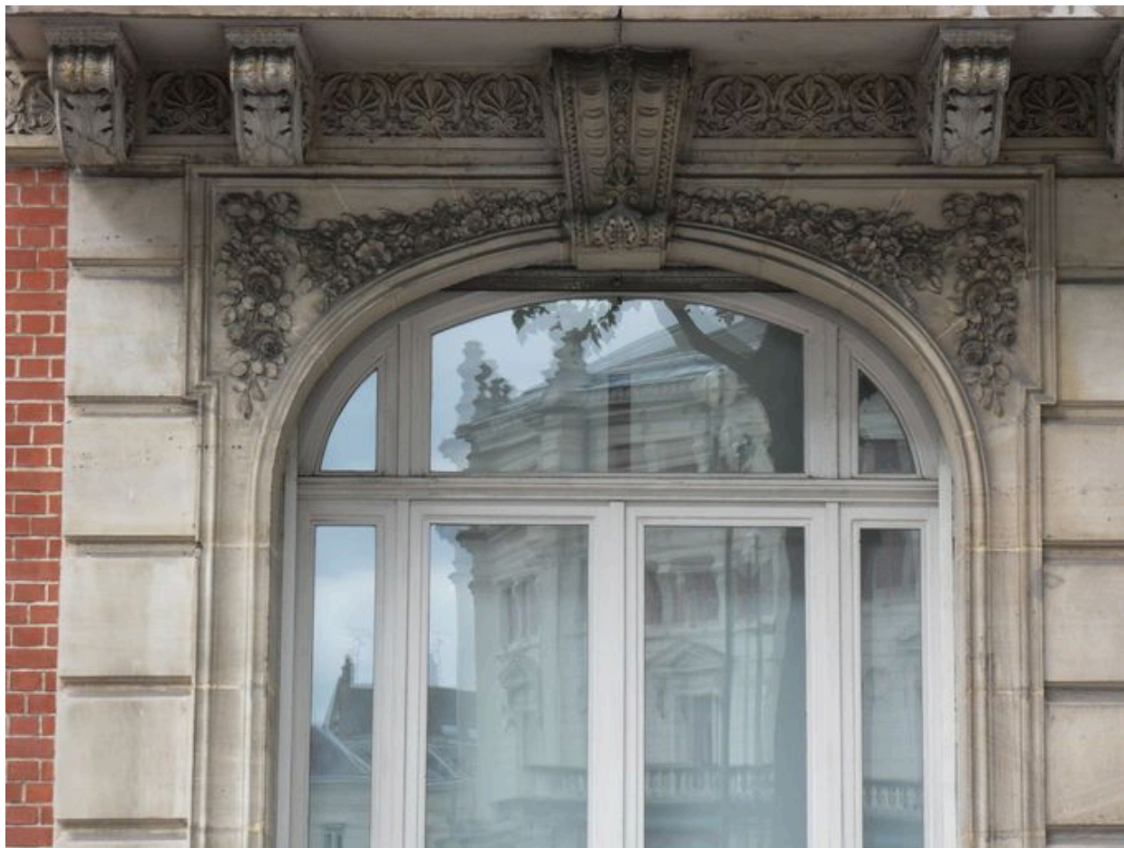
Vue de détail sur le décor sculpté du linteau de la baie du rez-de-chaussée.