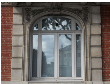
Vue de détail sur la fenêtre du petit salon.