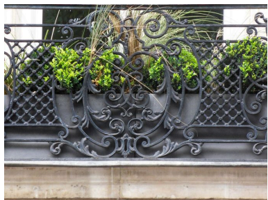
Vue de détail de la feronnerie du balcon. IVR22_20118010037NUCA