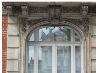
Vue de détail sur le décor sculpté du linteau de la baie du rez-de-chaussée. IVR22_20118010036NUCA