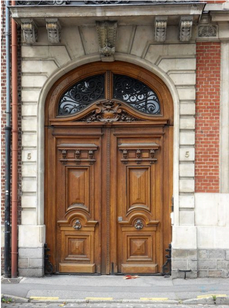
Vue de détail du portail.