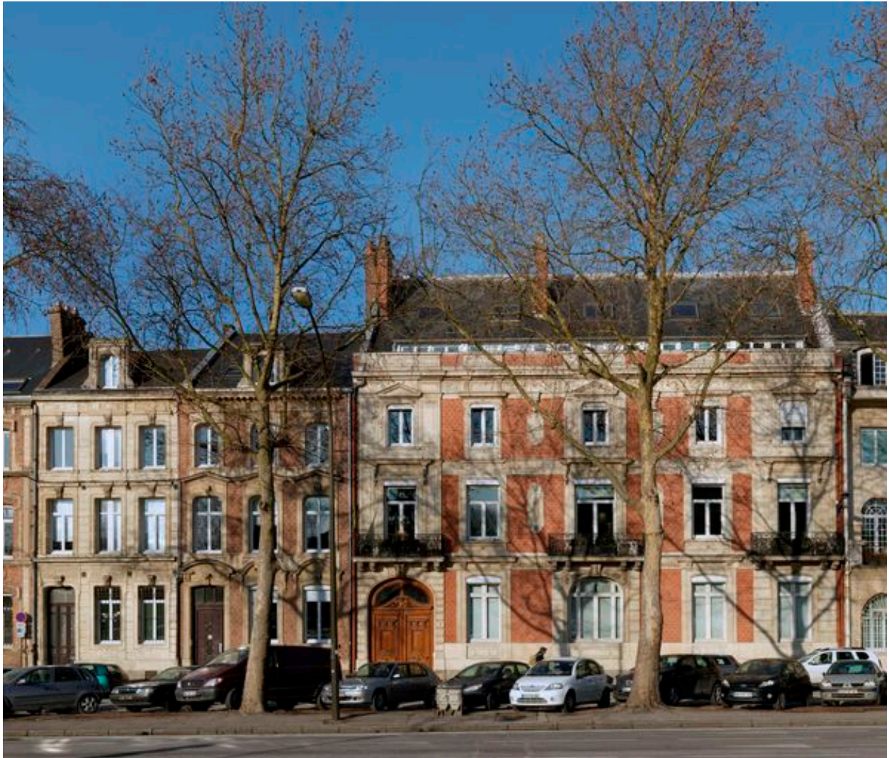
Vue de situation, hôtel à droite de l'image.