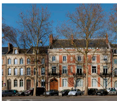
Vue de situation, hôtel à droite de l'image.