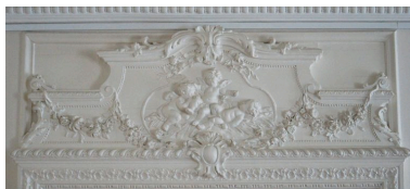
Trumeau de la porte d'une chambre du premier étage.

IVR22_20118000294NUC2A