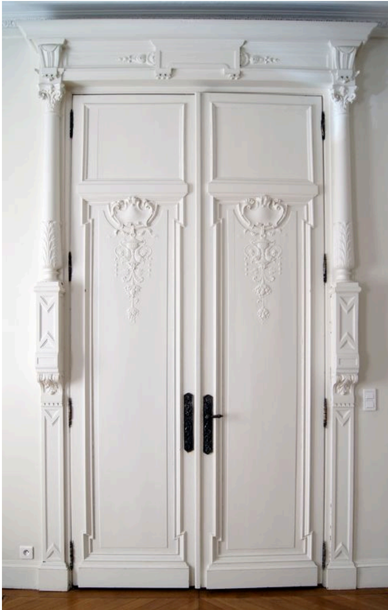
Porte de séparation entre le grand salon et le petit salon.