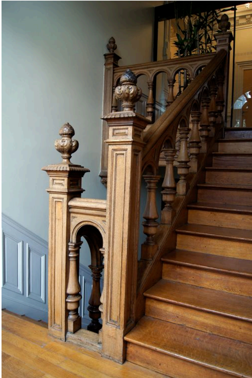
Vue de la rampe d'escalier.