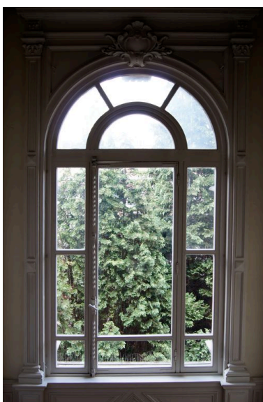
Baie éclairant la cage de l'escalier.