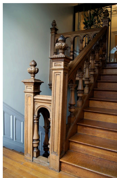
Vue de la rampe d'escalier.