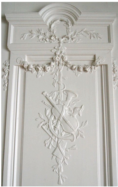
Vue du décor sculpté des portes de la salle à manger. IVR22_20118000303NUC2A