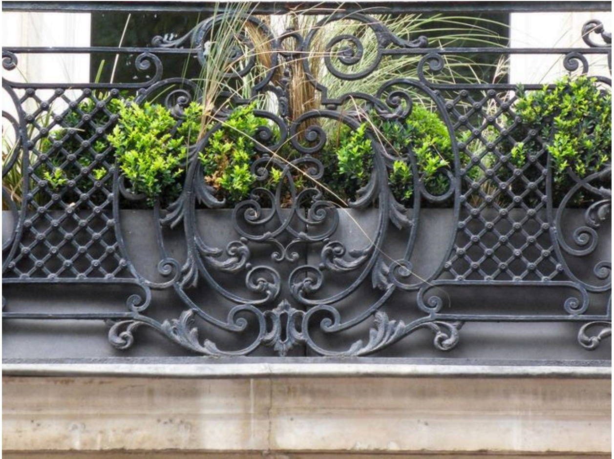
Vue de détail de la ferronnerie du balcon.