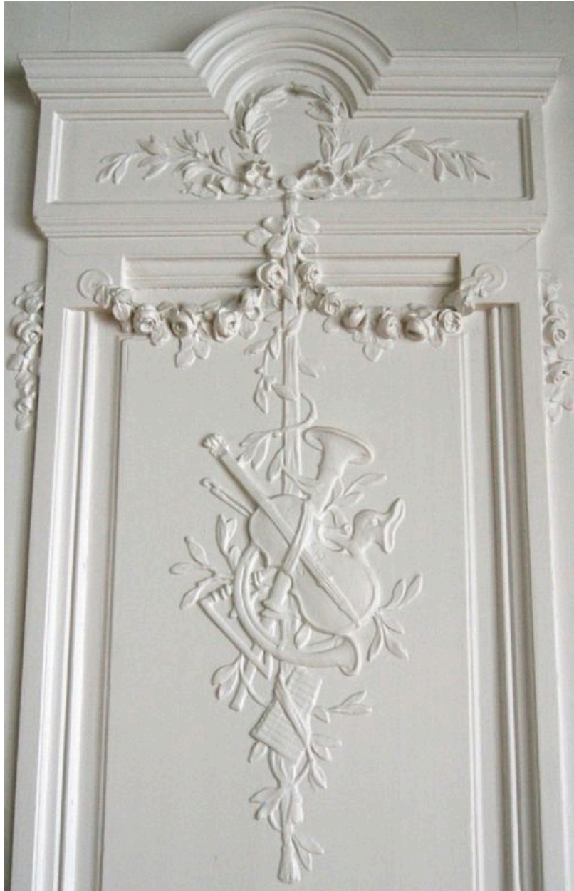
Vue du décor sculpté des portes de la salle à manger.