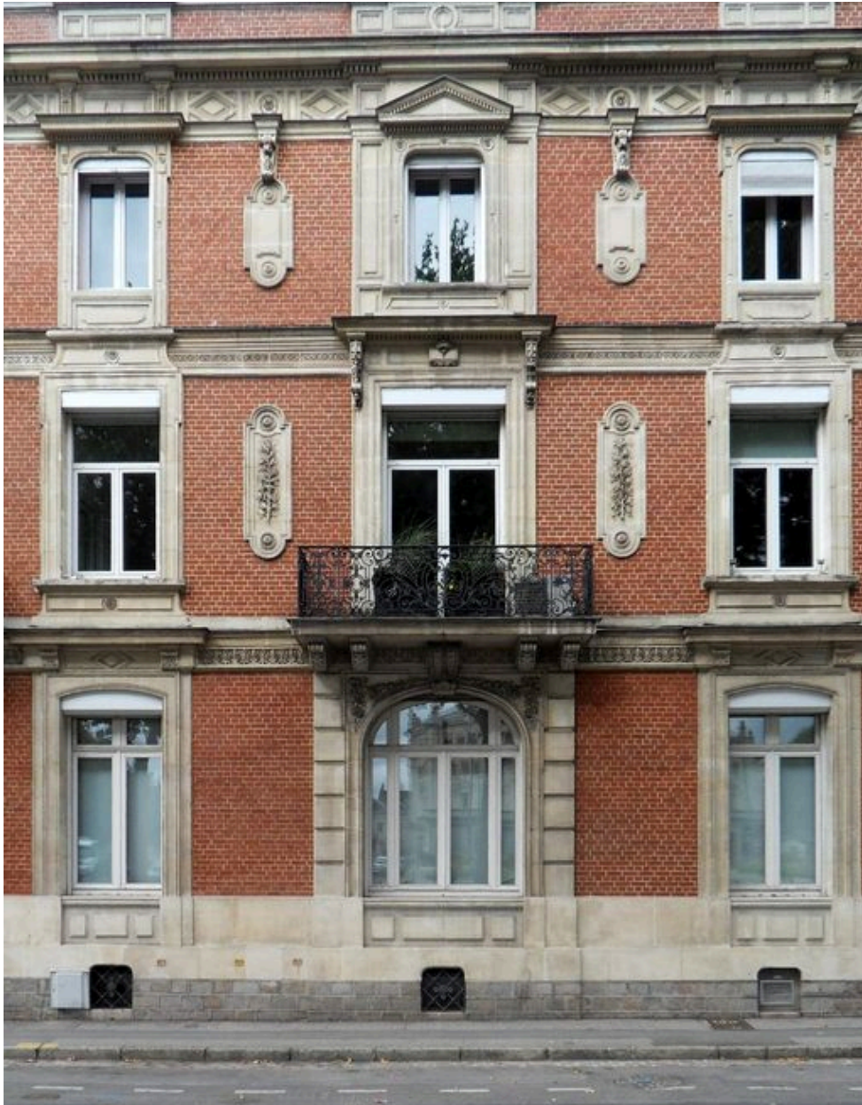
Vue de détail des trois travées centrales de la façade antérieure.