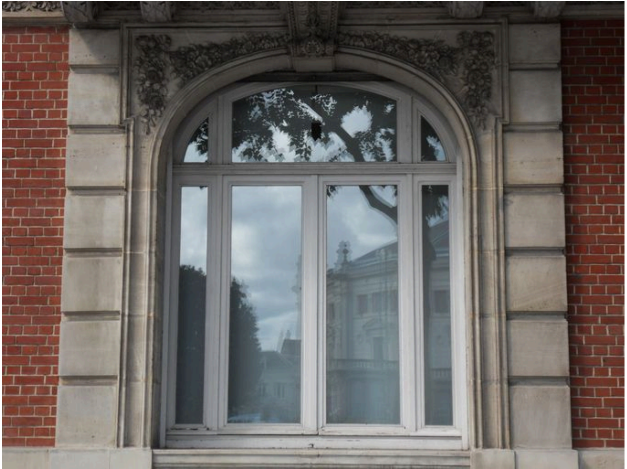
Vue de détail sur la fenêtre du petit salon.