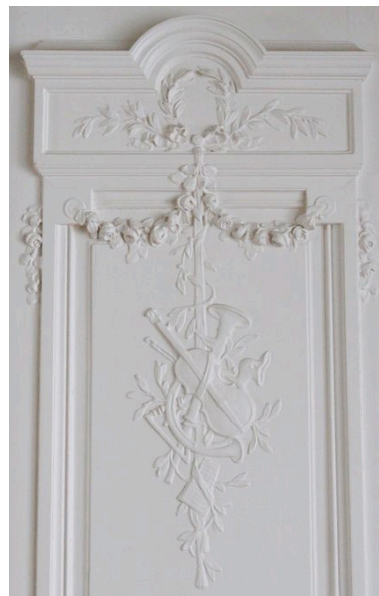
Vue du décor sculpté des portes de la salle à manger.