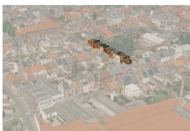
Vue aérienne, vers 1989.