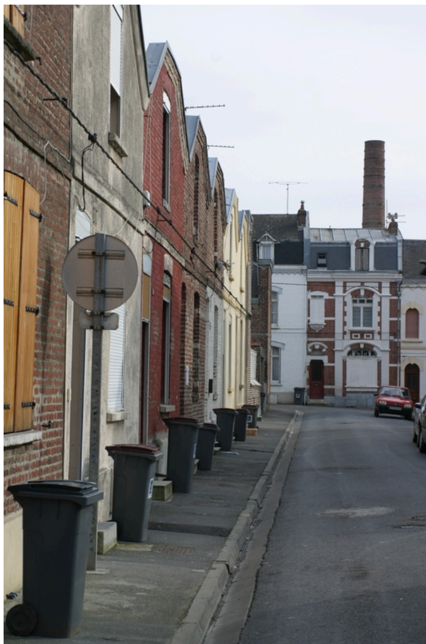
A gauche la cité Cartignies, au fond, la cheminée d'usine de l'ancien tissage Taine, Guillot et Cie.