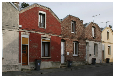
Quatre logements.