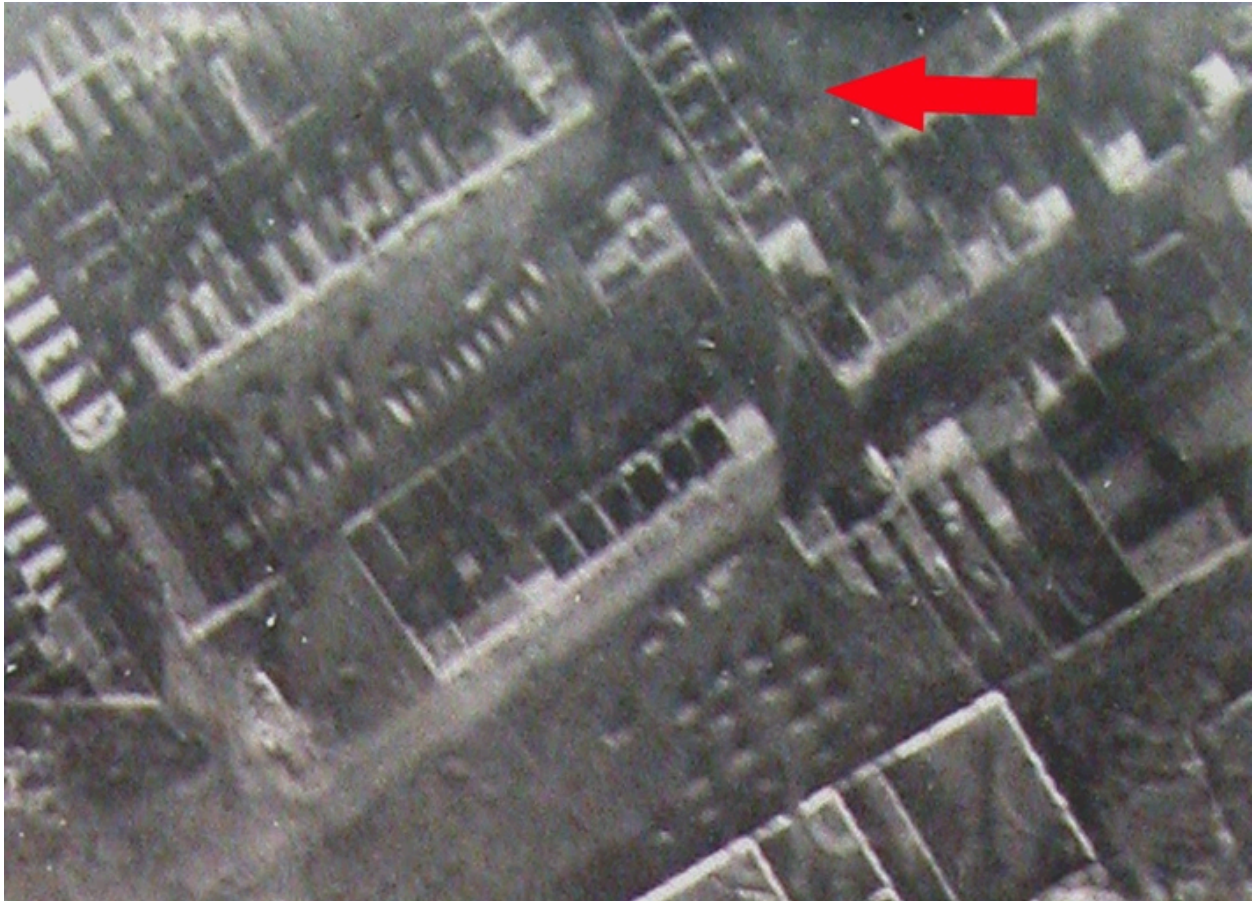
Vue aérienne des habitations en novembre 1918 : les toitures ont disparu.