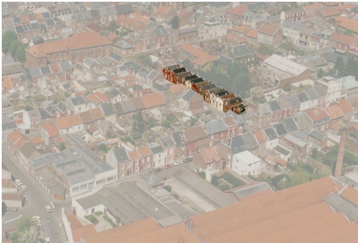
Vue aérienne, vers 1989.