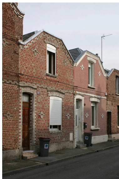
Deux logements. IVR22_20060205099NUCA