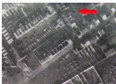
Vue aérienne des habitations en novembre 1918 : les toitures ont disparu (AD Aisne).

Phot. Pillet Frédéric IVR22_20050206655NUCAB