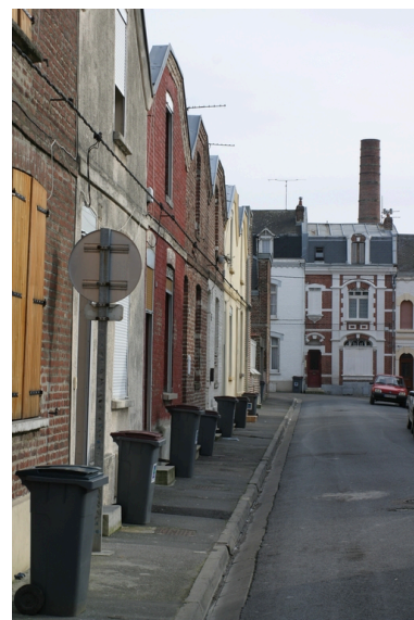
A gauche la cité Cartignies, au fond, la cheminée d'usine de l'ancien tissage Taine, Guillot et Cie.