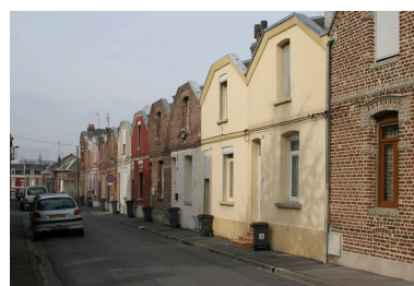
Vue d'ensemble.