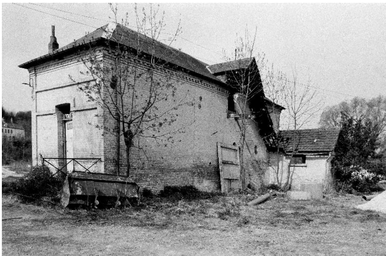
Conciergerie, élévation postérieure.