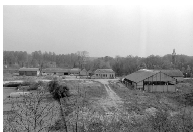
Vue générale de l'usine.