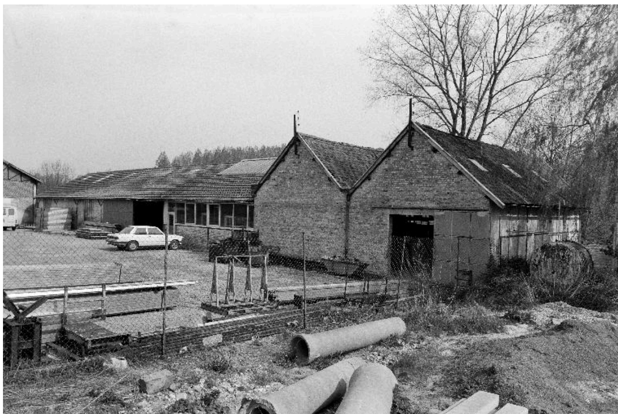
Ateliers de fabrication.