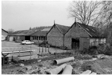
Ateliers de fabrication. IVR22_19888000602Z