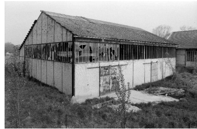
Magasin industriel ?