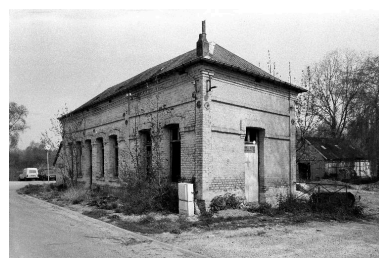
Conciergerie. Elévation antérieure. IVR22_19888000592Z