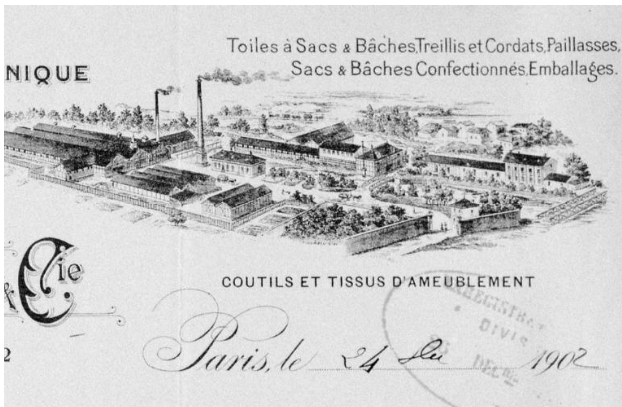
Vue cavalière de l'usine Bernheim Frères et Cie, vers 1902 (AD Somme ; M 96857).