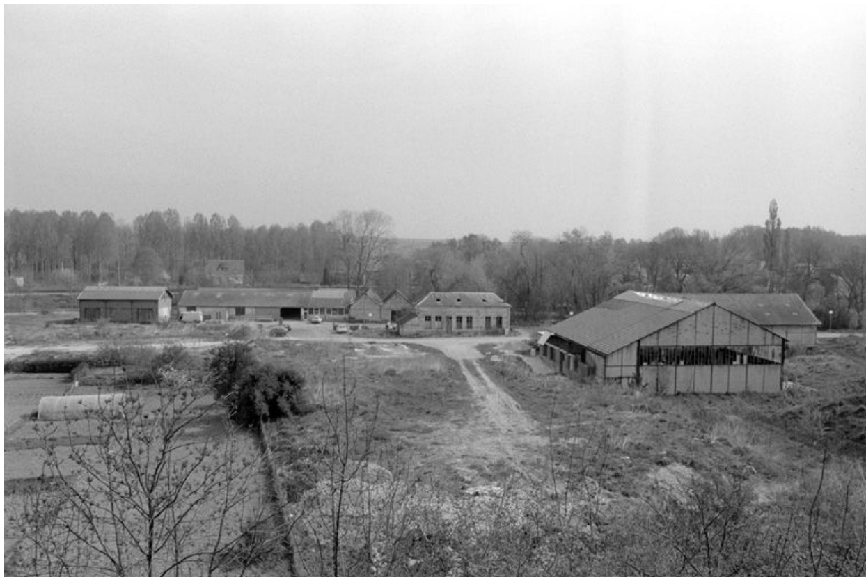
Vue générale de l'usine.