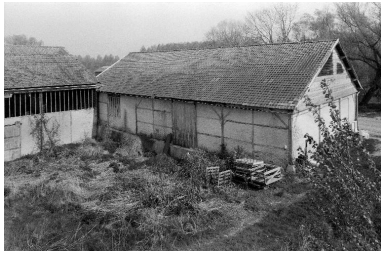
Magasin industriel ?