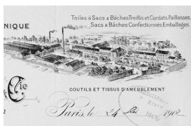
Vue cavalière de l'usine Bernheim Frères et Cie, vers 1902