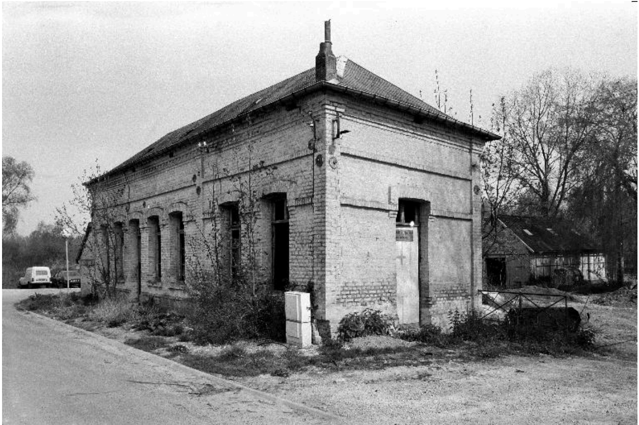
Conciergerie. Elévation antérieure.