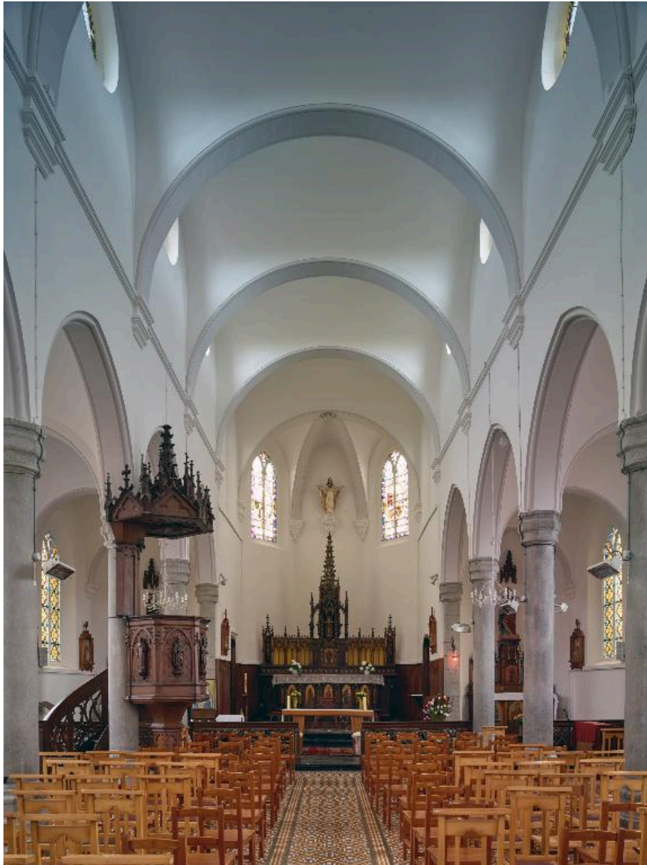
Vue générale intérieure vers le chœur.