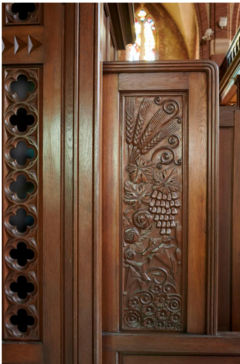
Détail du décor d'un panneau des loges latérales.