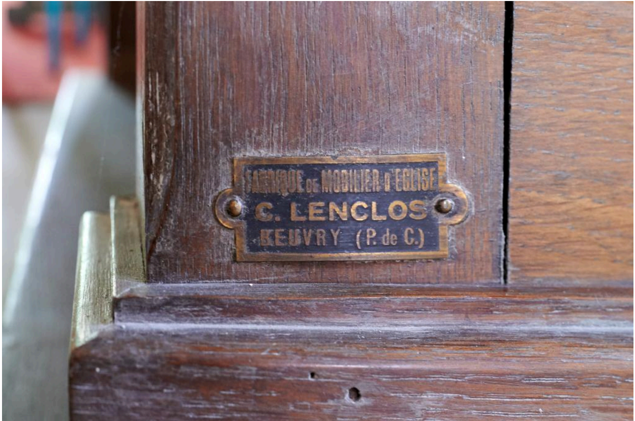
Étiquette métallique de l'entreprise C. Lenclos apposée à l'avant gauche du confessionnal situé sur le côté gauche de la nef.