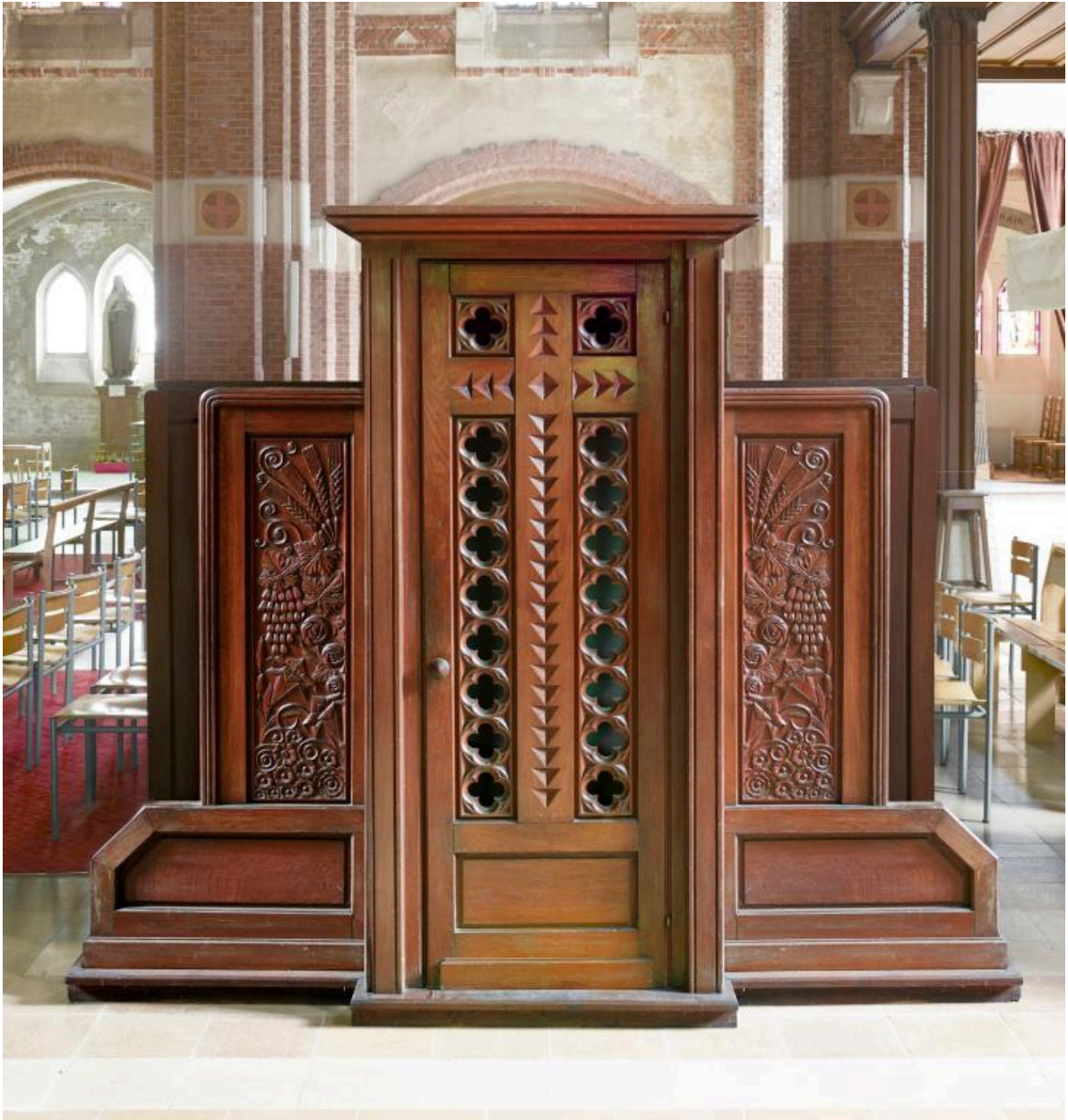
Vue générale de face depuis la nef.