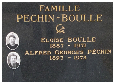
Vue de détail de la stèle.