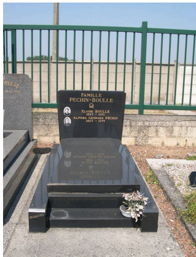
Vue générale. IVR22_20078010068NUCA