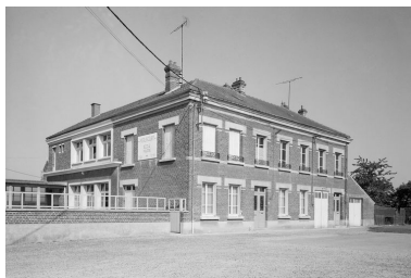
Vue générale. IVR22_19856000898X