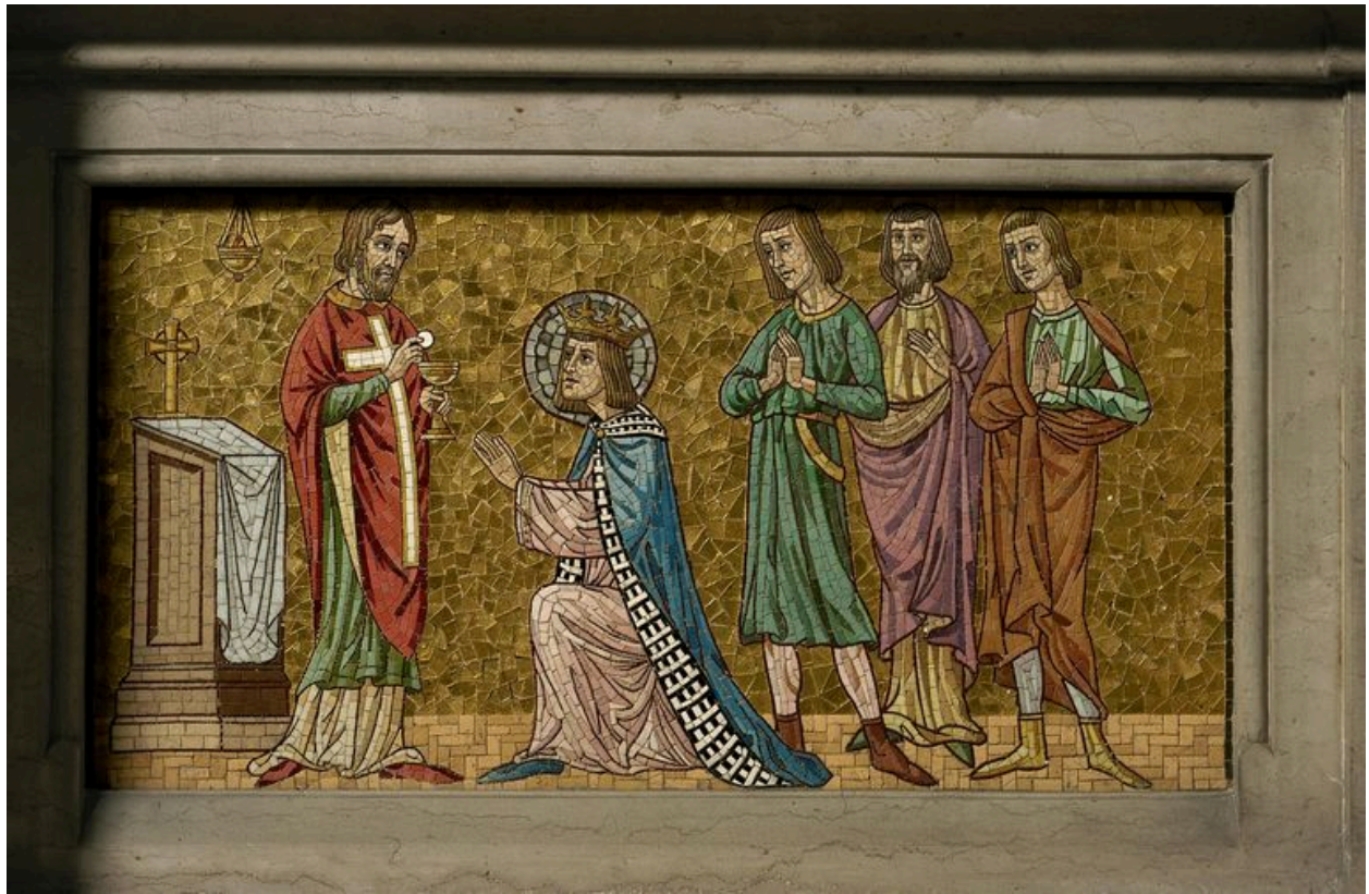
Détail sur le décor du gradin.