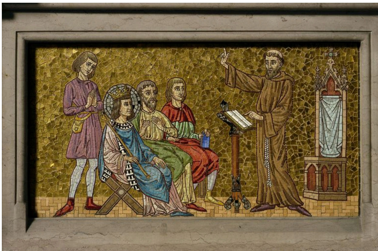
Détail sur le décor du gradin.