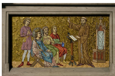
Détail sur le décor du gradin. IVR22_20068000302NUCA