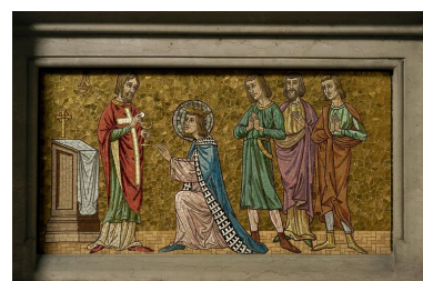
Détail sur le décor du gradin. IVR22_20068000303NUCA