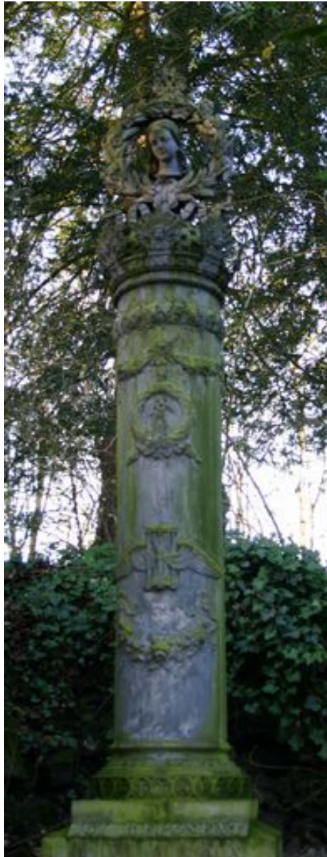
Détail du fût de la colonne funéraire monumentale, face antérieure.