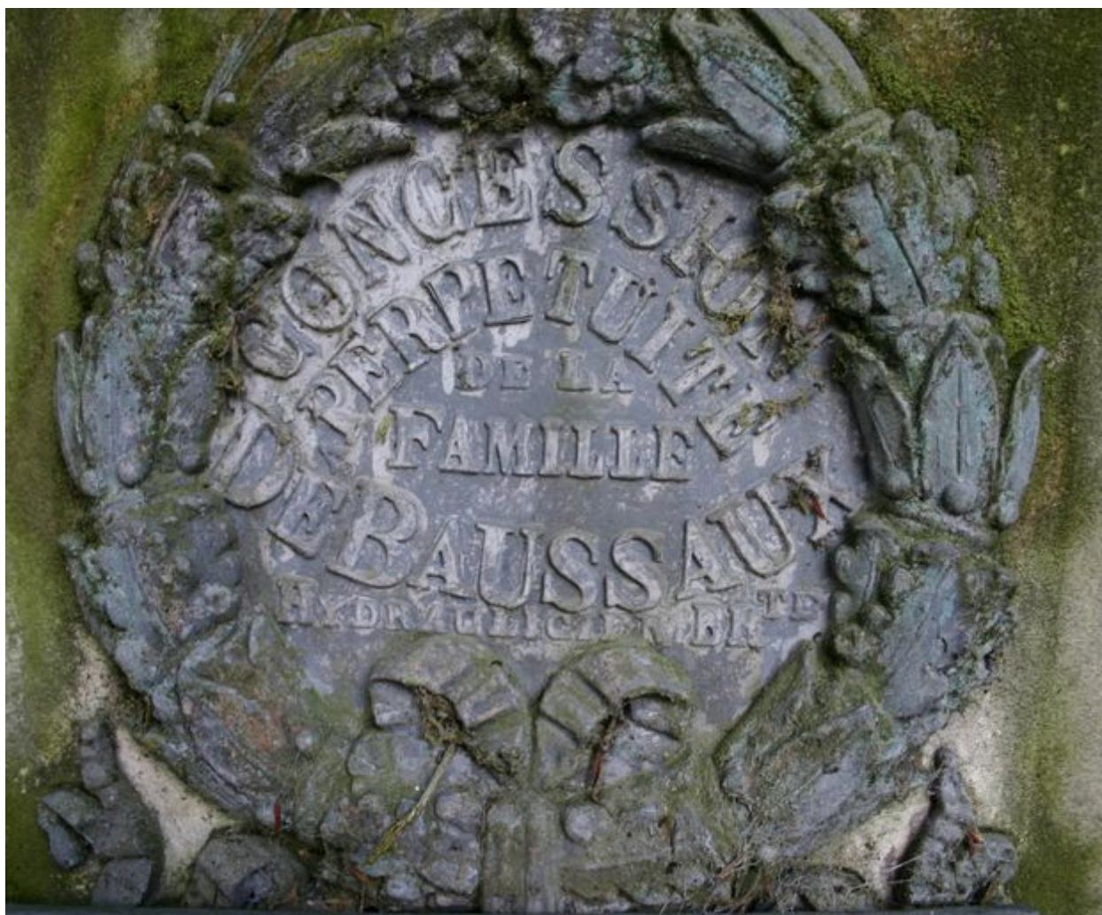
Détail du médaillon, ornant le socle de la colonne funéraire monumentale.