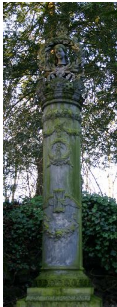
Détail du fût de la colonne funéraire monumentale, face antérieure.

Phot. Isabelle Barbedor IVR22_20098000782NUCA