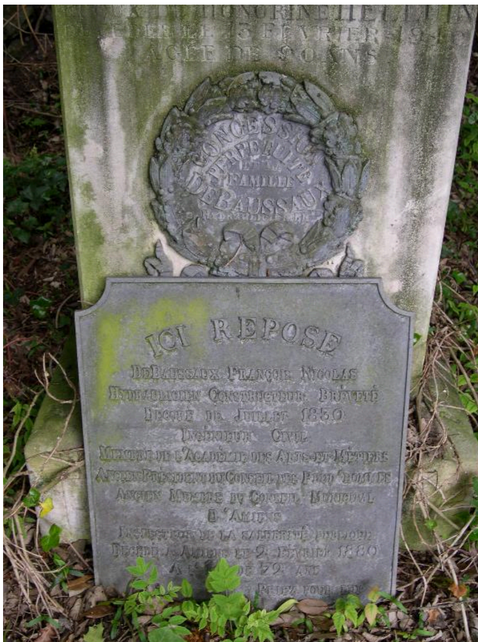
Détail du socle de la colonne funéraire monumentale.