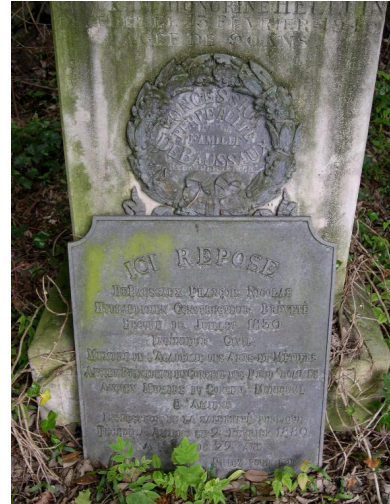
Détail du socle de la colonne funéraire monumentale. IVR22_20088000934NUCA