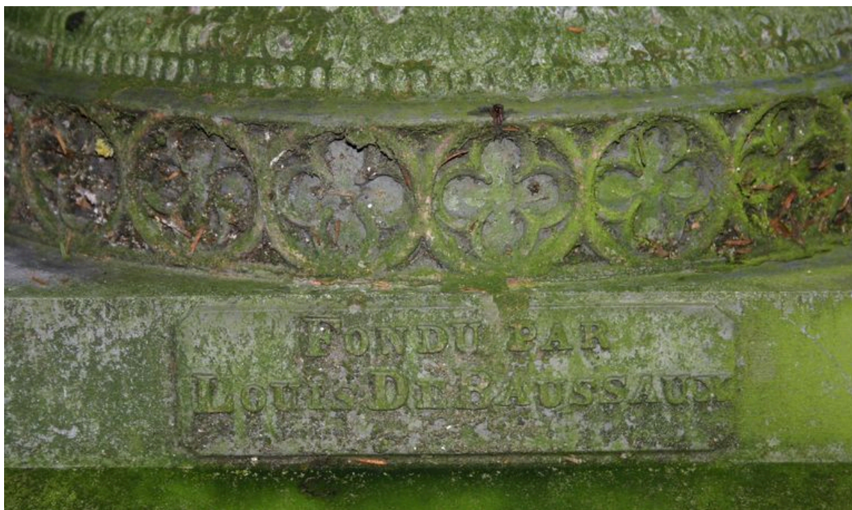
Signature du fondeur Louis Debaussaux.