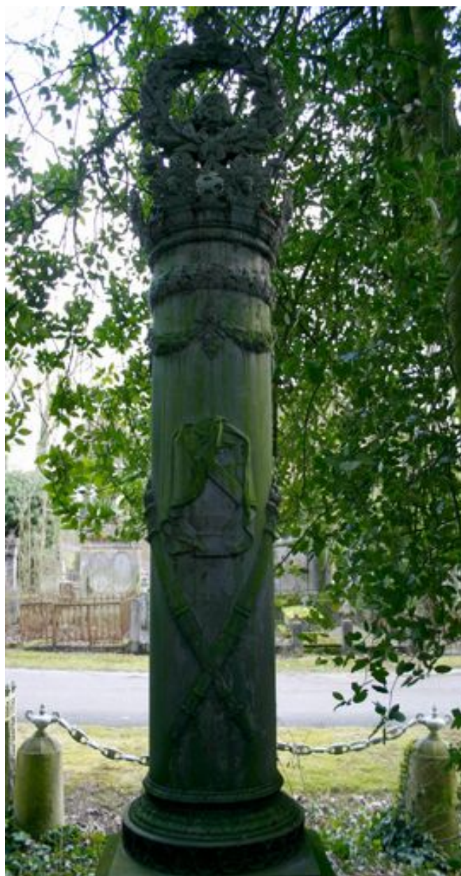
Détail du fût de la colonne funéraire monumentale, face postérieure.