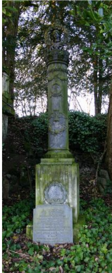
Colonne funéraire monumentale.