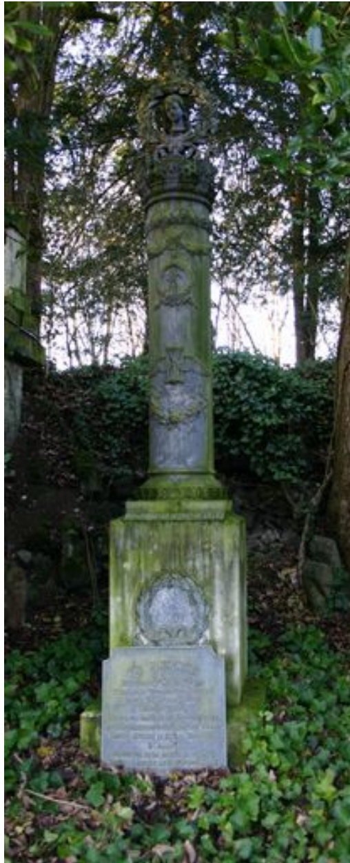
Colonne funéraire monumentale.