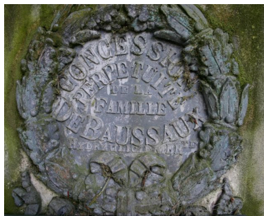
Détail du médaillon, ornant le socle de la colonne funéraire monumentale.

IVR22_20098000780NUCA