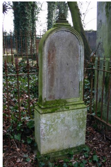
Stèle funéraire, vers 1836.

Les croix funéraires. De gauche à droite : croix funéraire en fer forgé, vers 1835, croix funéraire en marbre, vers 1896, croix funéraire de Jean-Baptiste Correur, vers 1840. IVR22_20138000567NUC2A