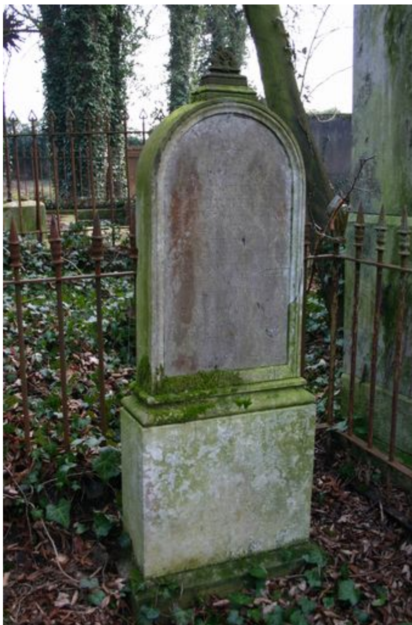
Stèle funéraire, vers 1836.