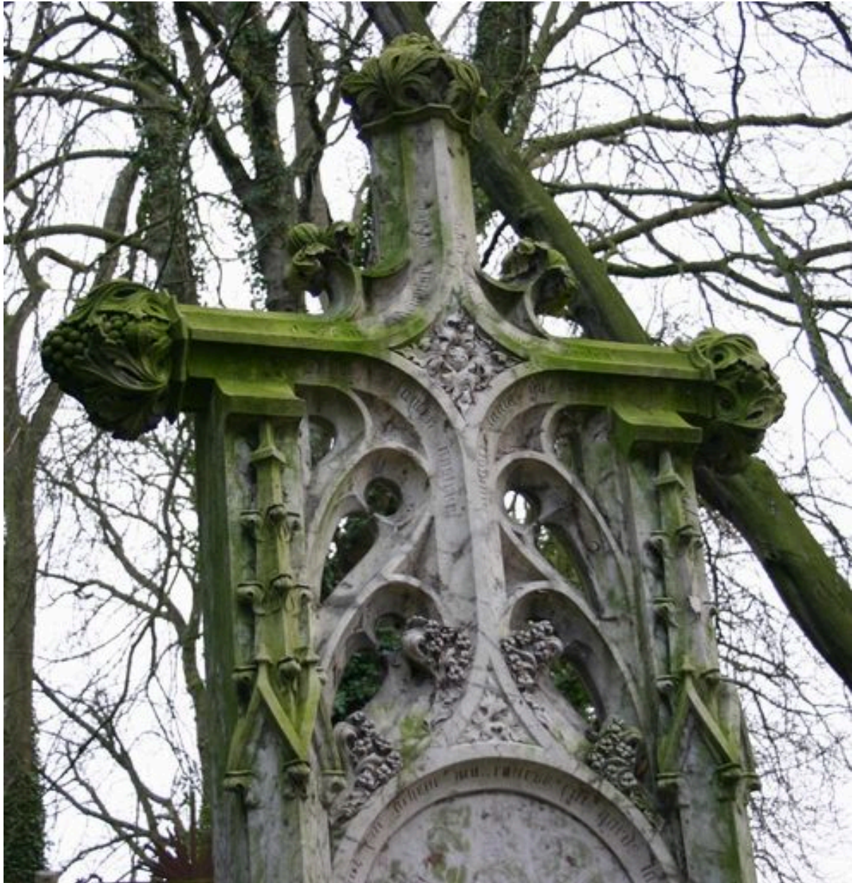
Détail de la partie supérieure sculptée de la stèle funéraire d'Adélaïde Herbert.