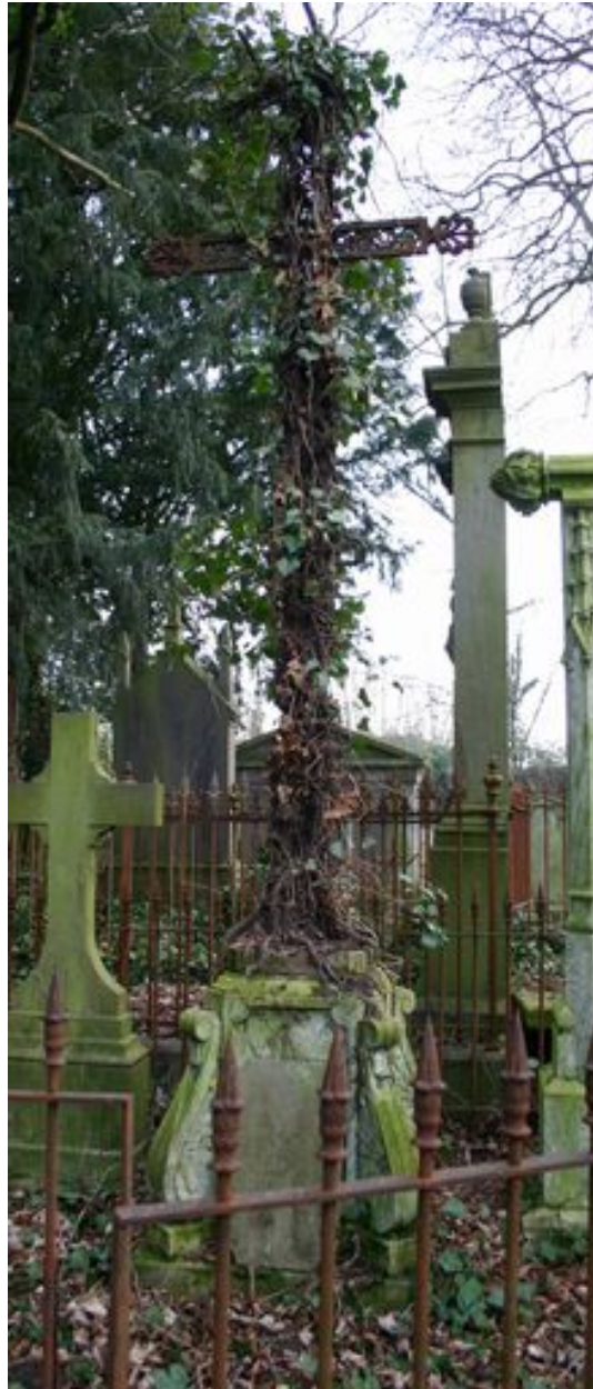
Croix funéraire du chanoine Jean-Baptiste Correur, vers 1840.