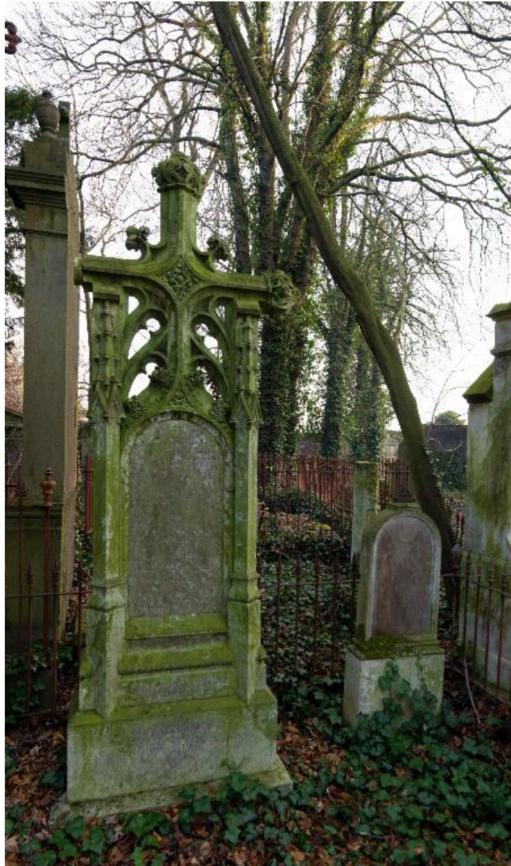
Stèle funéraire d'Adélaïde Herbert, vers 1859 et stèle funéraire, vers 1836, à droite de l'image.