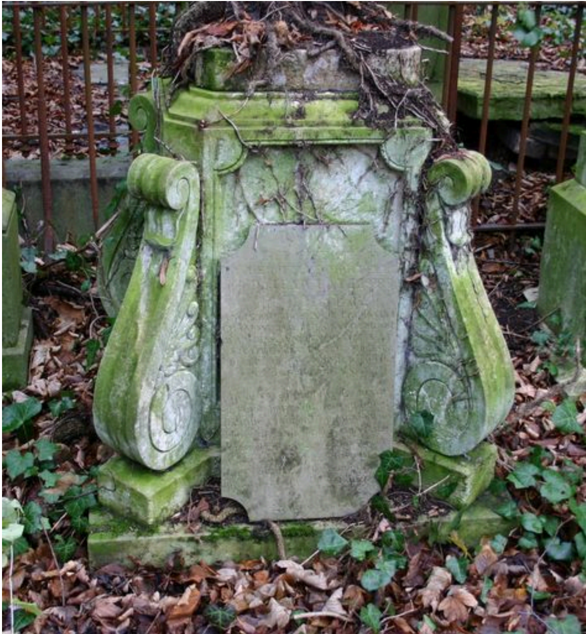
Détail de la base de la croix funéraire de Jean-Baptiste Correur.