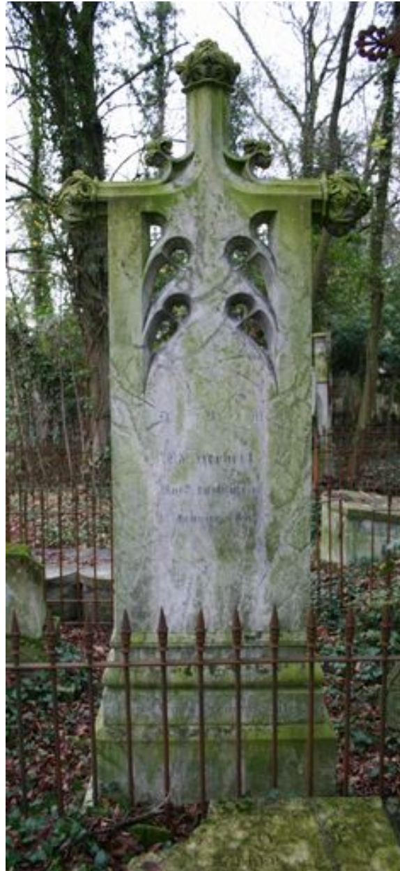
Stèle funéraire d'Adélaïde Herbert, face postérieure.