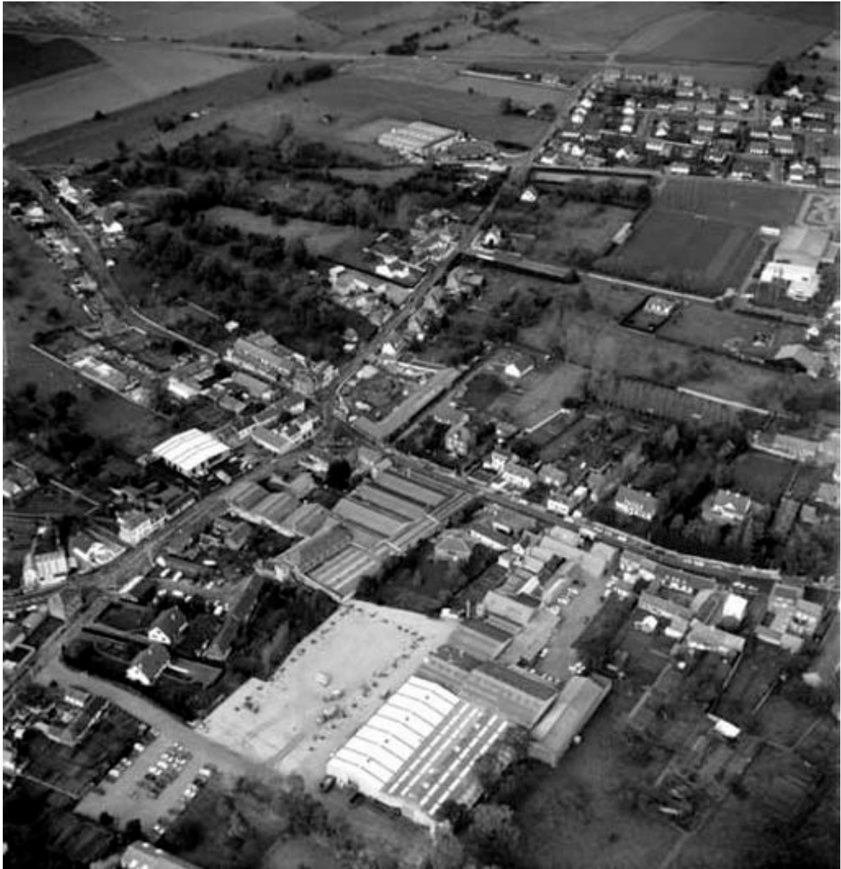
Vue aérienne en 1988, flanc sud.