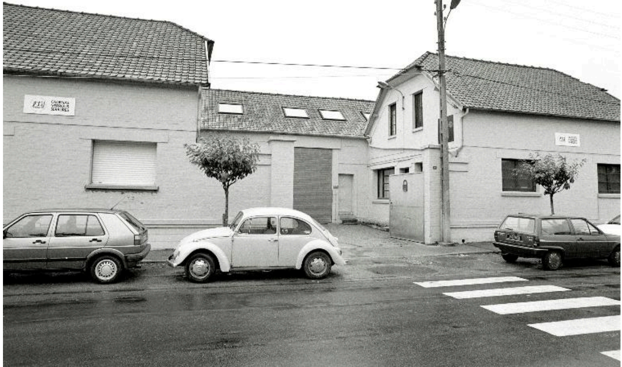
L'entrée principale, 45 rue Jean-Jaurès, en 1990.