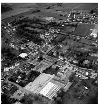
Vue aérienne en 1988, flanc sud.