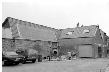
Atelier de fabrication, vue partielle en 1990, flanc est.