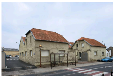
Entrée principale, 45 rue Jean-Jaurès.