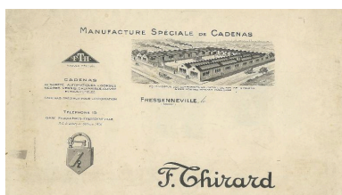
Vue cavalière, vers 1940 (coll. part.).