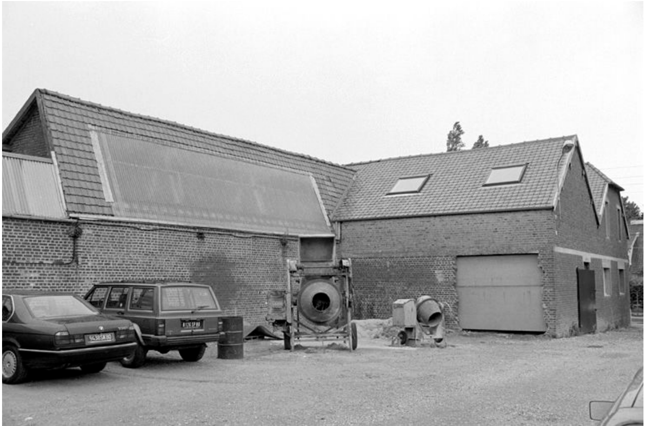
Atelier de fabrication, vue partielle en 1990, flanc est.