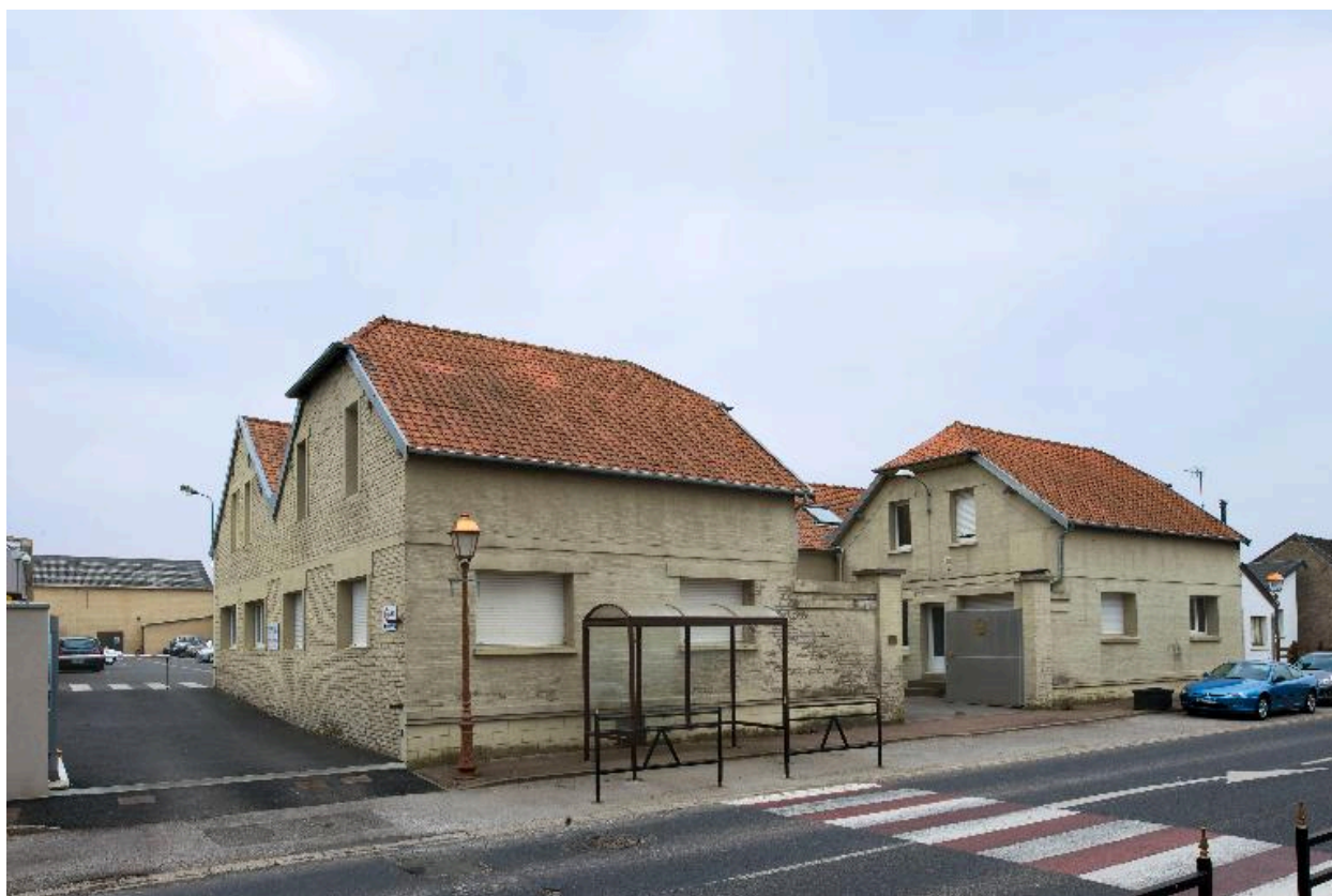
Entrée principale, 45 rue Jean-Jaurès.