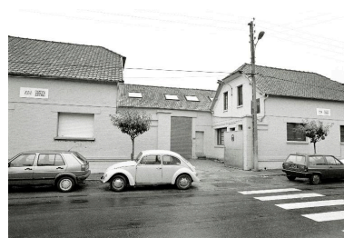
L'entrée principale, 45 rue Jean-Jaurès, en 1990.