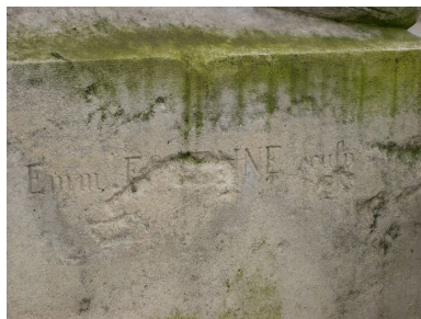
Vue de détail sur la signature du sculpteur : Emmanuel Fontaine.