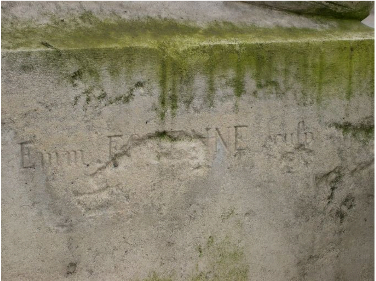
Vue de détail sur la signature du sculpteur : Emmanuel Fontaine.