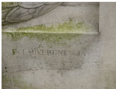
Vue de détail sur la signature de l'entrepreneur : F. Lauvergne.