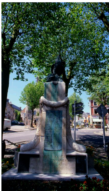
Vue de l'obélisque. IVR22_19948000325ZA