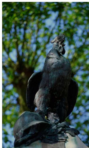
Détail du coq. IVR22_19948000328ZA