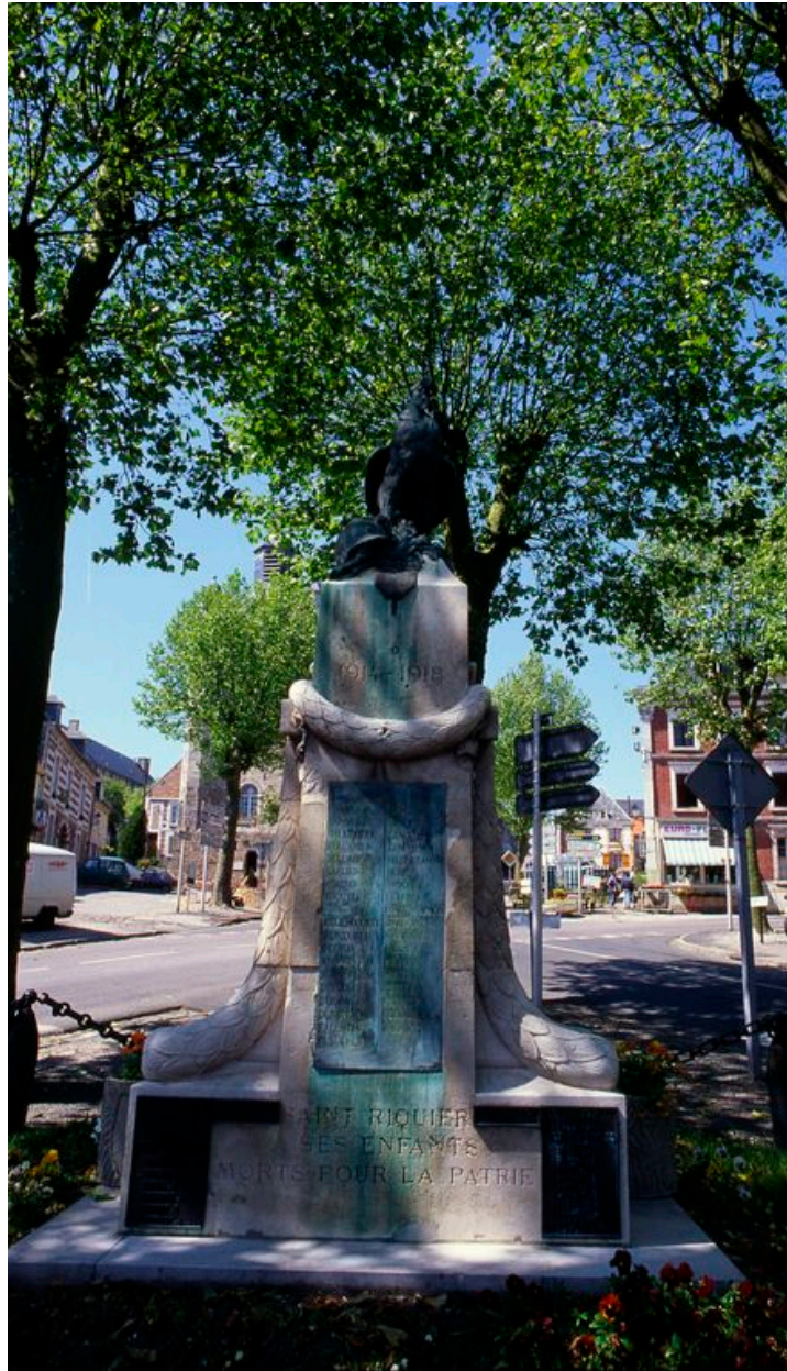
Vue de l'obélisque.