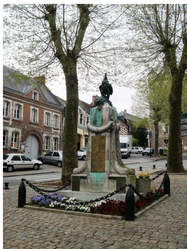
Vue générale. IVR22_20118005029NUCA