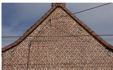
Détail du pignon portant la date 1833. IVR31_20095903233NUCA