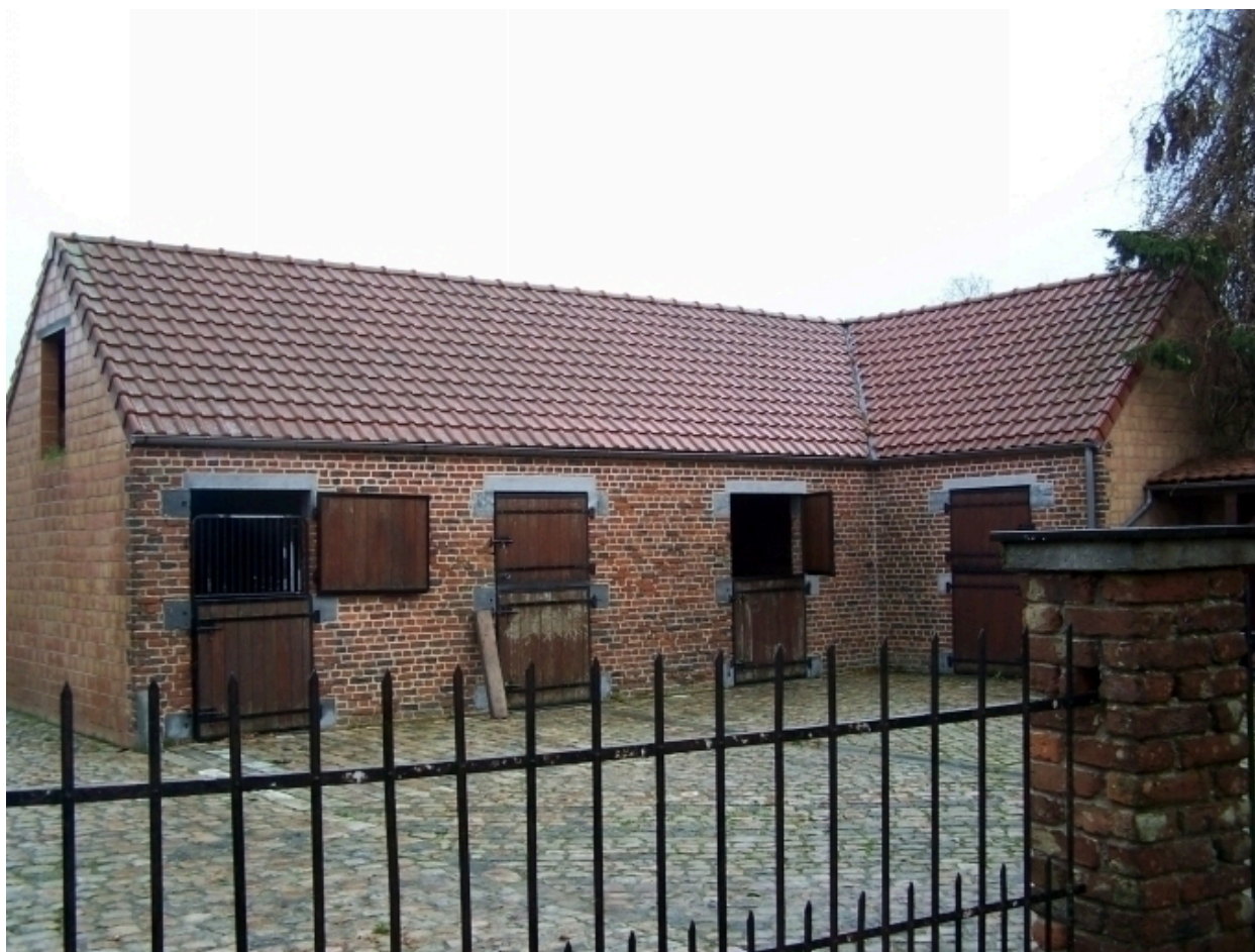
Vue des écuries.