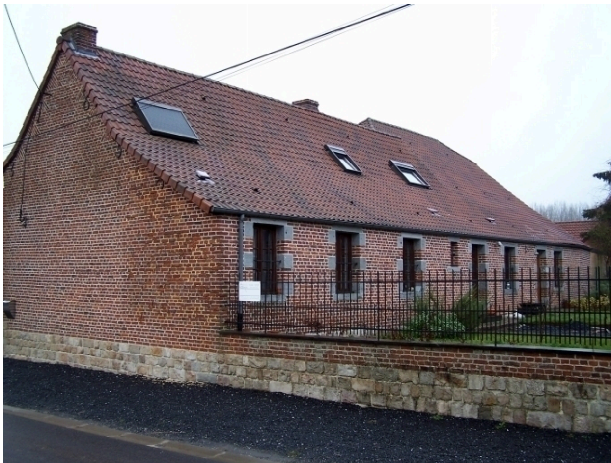
Vue de l'arrière du corps de logis.