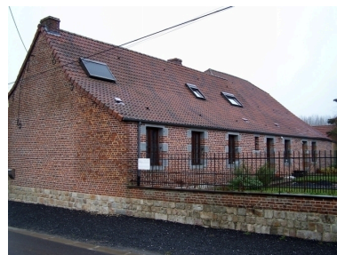
Vue de l'arrière du corps de logis.