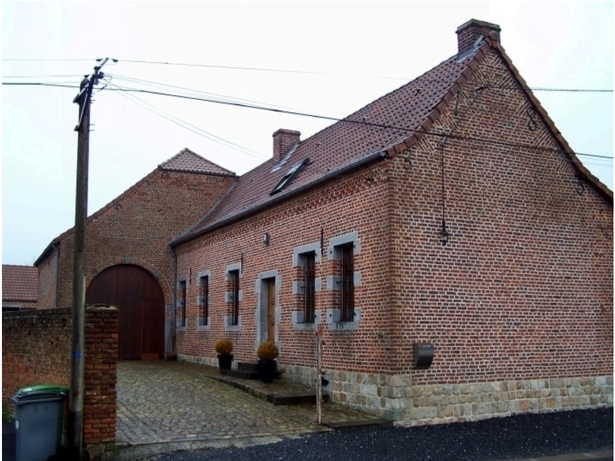
Vue générale du logis et de la grange.