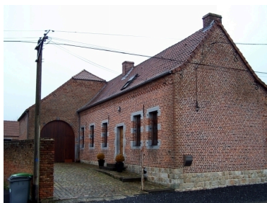
Vue générale du logis et de la grange. IVR31_20085900668NUCA