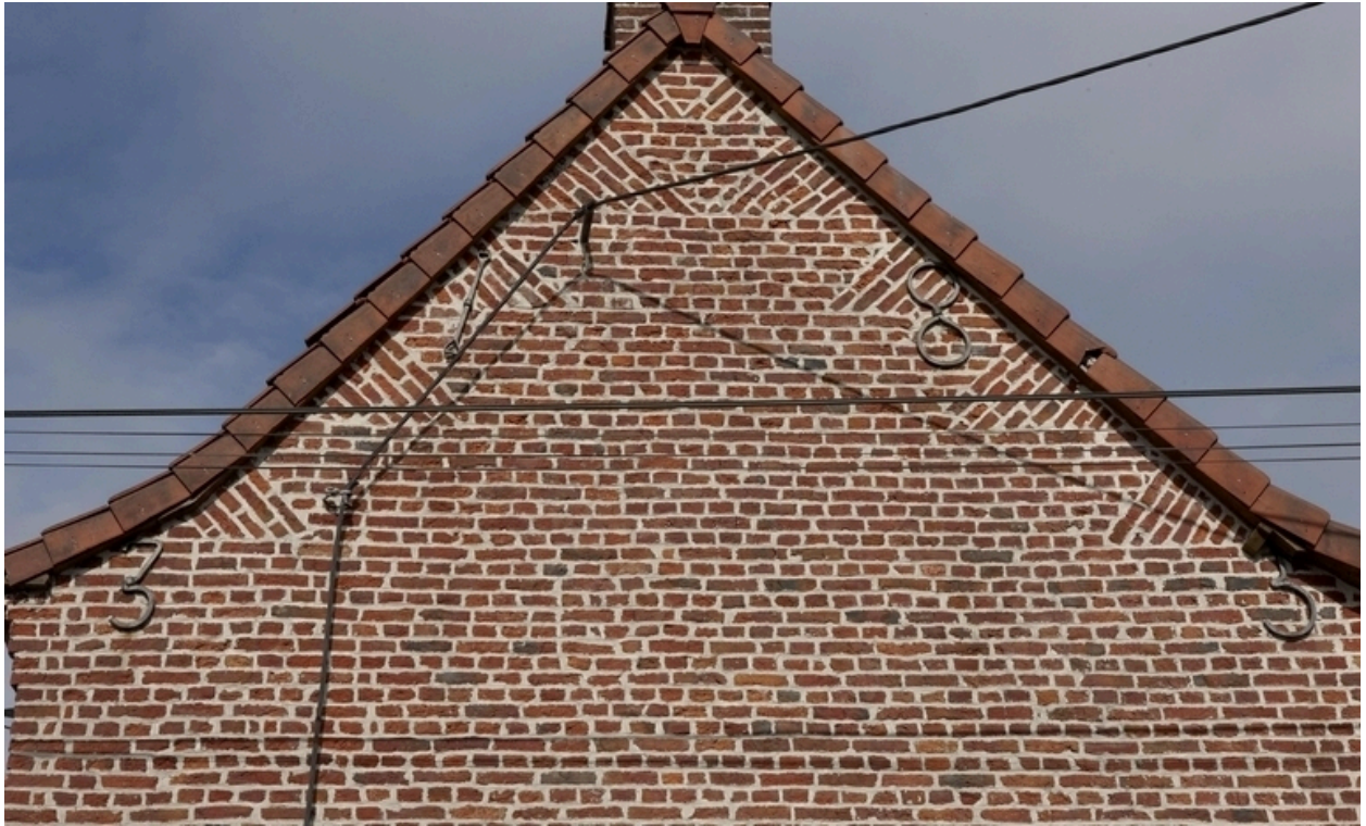
Détail du pignon portant la date 1833.