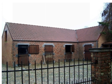
Vue des écuries.