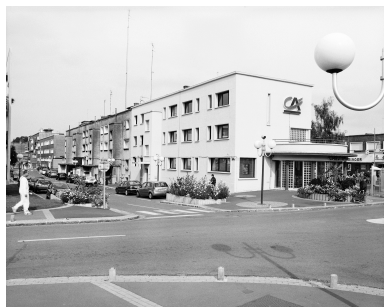
Vue générale de l'îlot M, l'élévation postérieure, rue de la porte de France.