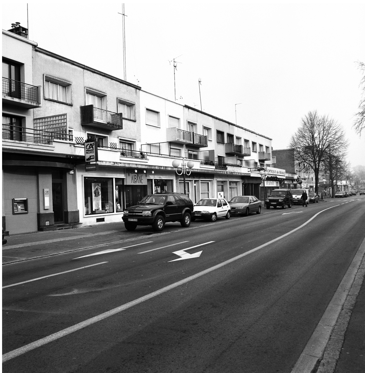
Vue générale de l'îlot M, l'élévation antérieure, donnant sur l'avenue de France.