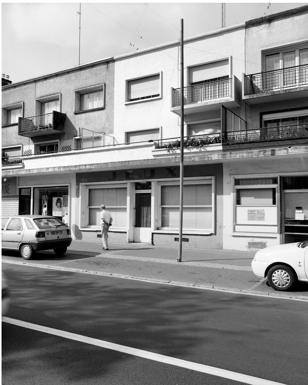
Vue générale d'un module avec magasin bien conservé au rez-de-chaussée, îlot M.