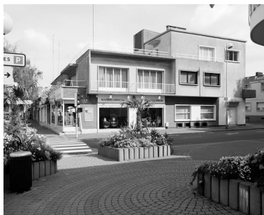
Vue générale de l'immeuble situé à l'angle de l'avenue de France et l'avenue des Provinces Françaises.