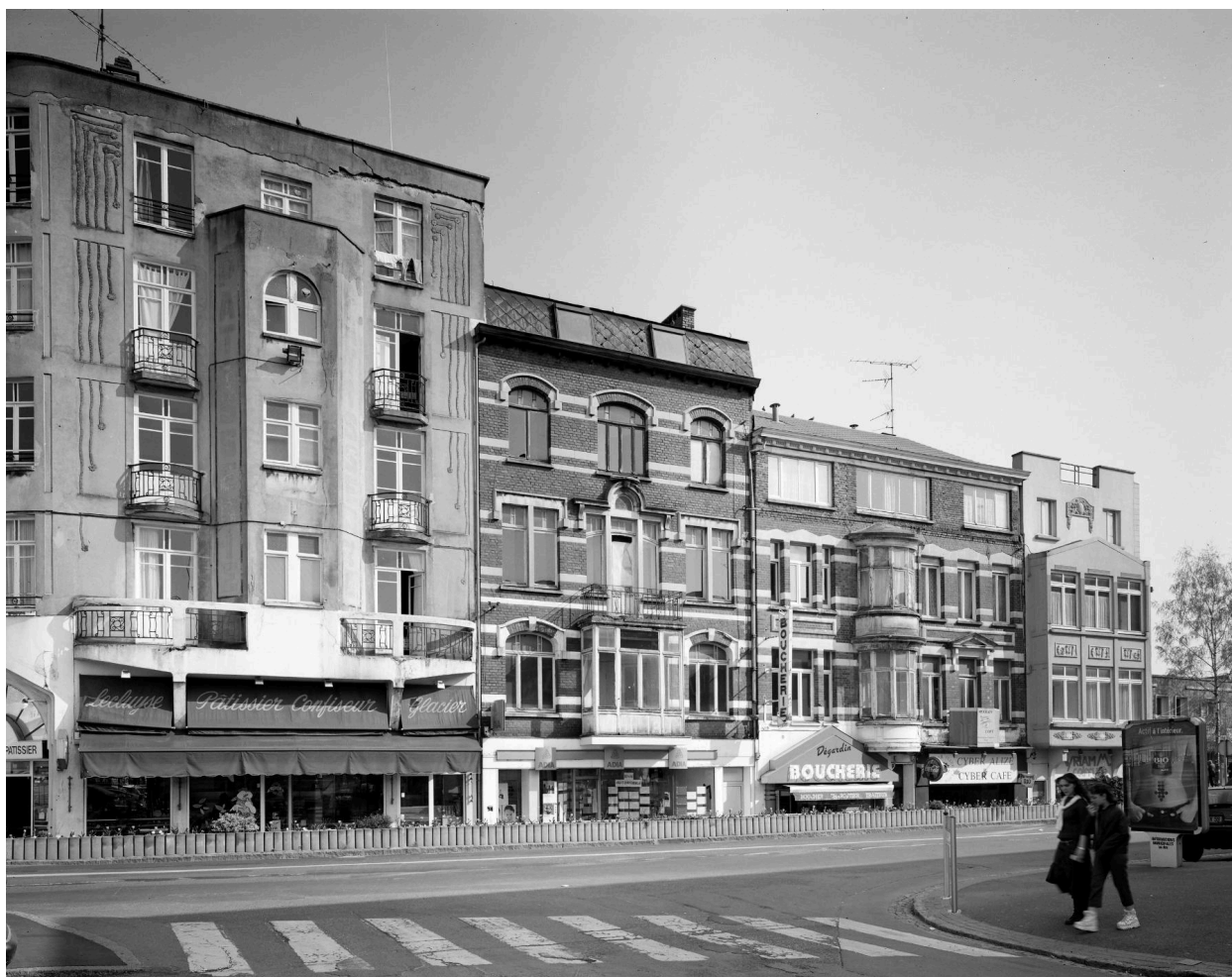
Ilôt de maisons construites pendant l'entre-deux-guerres (détruit).