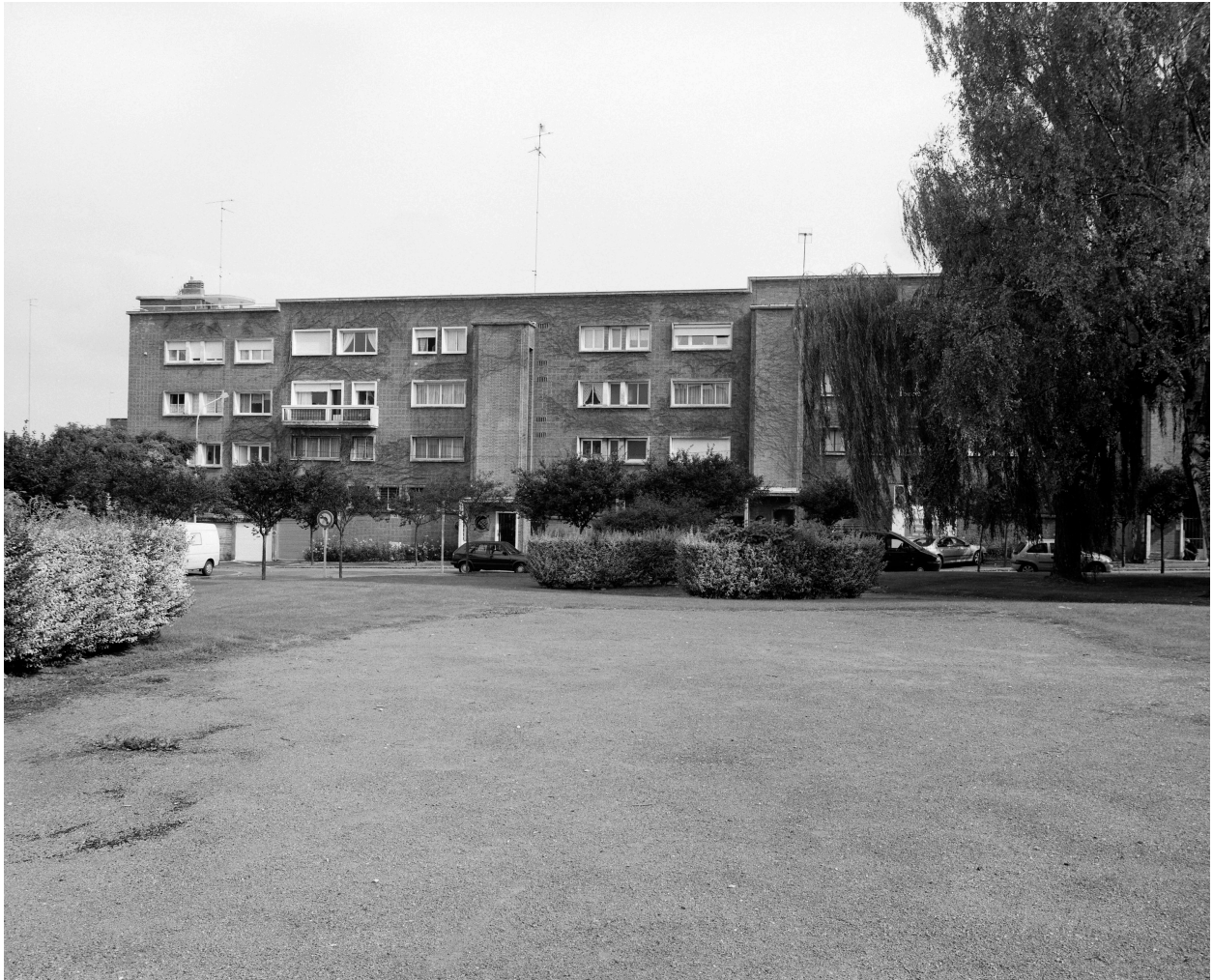
Élévation postérieure du bloc 7 de l'îlot P.