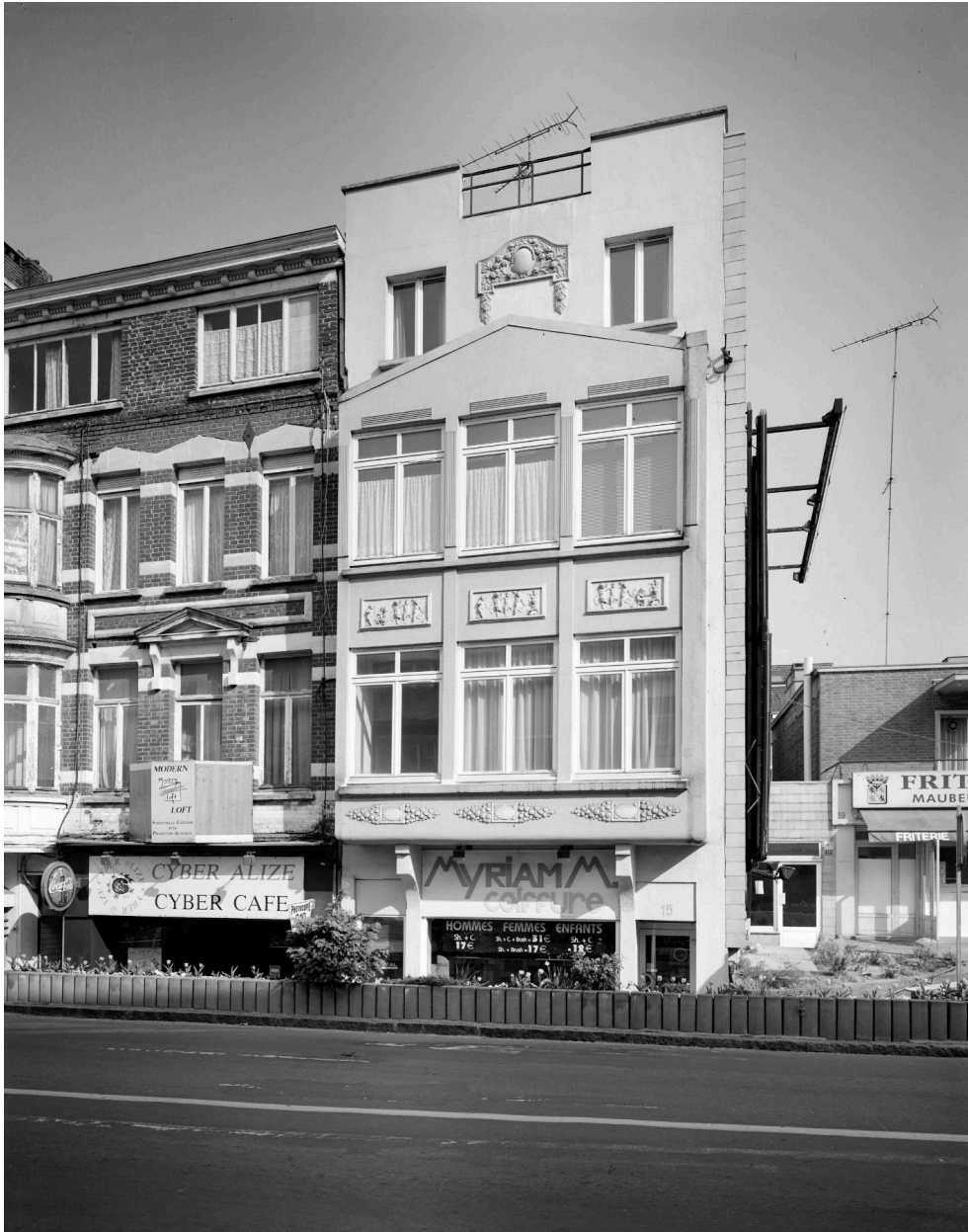
Maison de l'entre-deux-guerres (détruite).