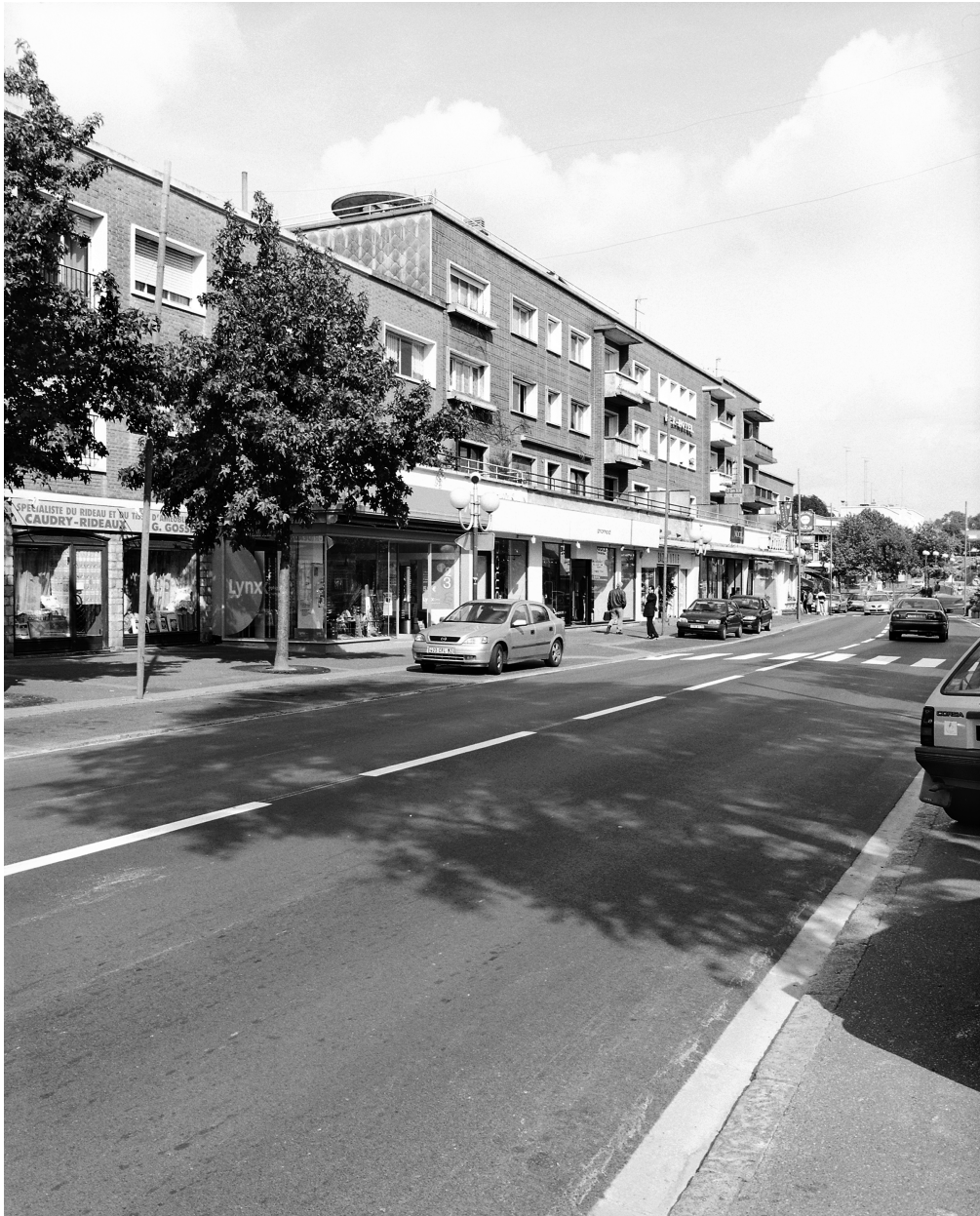
Vue générale de l'îlot I.