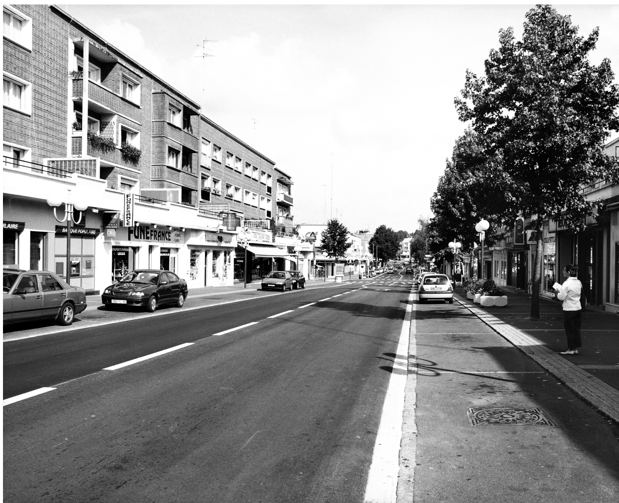
Vue générale de l'avenue, vers le nord.