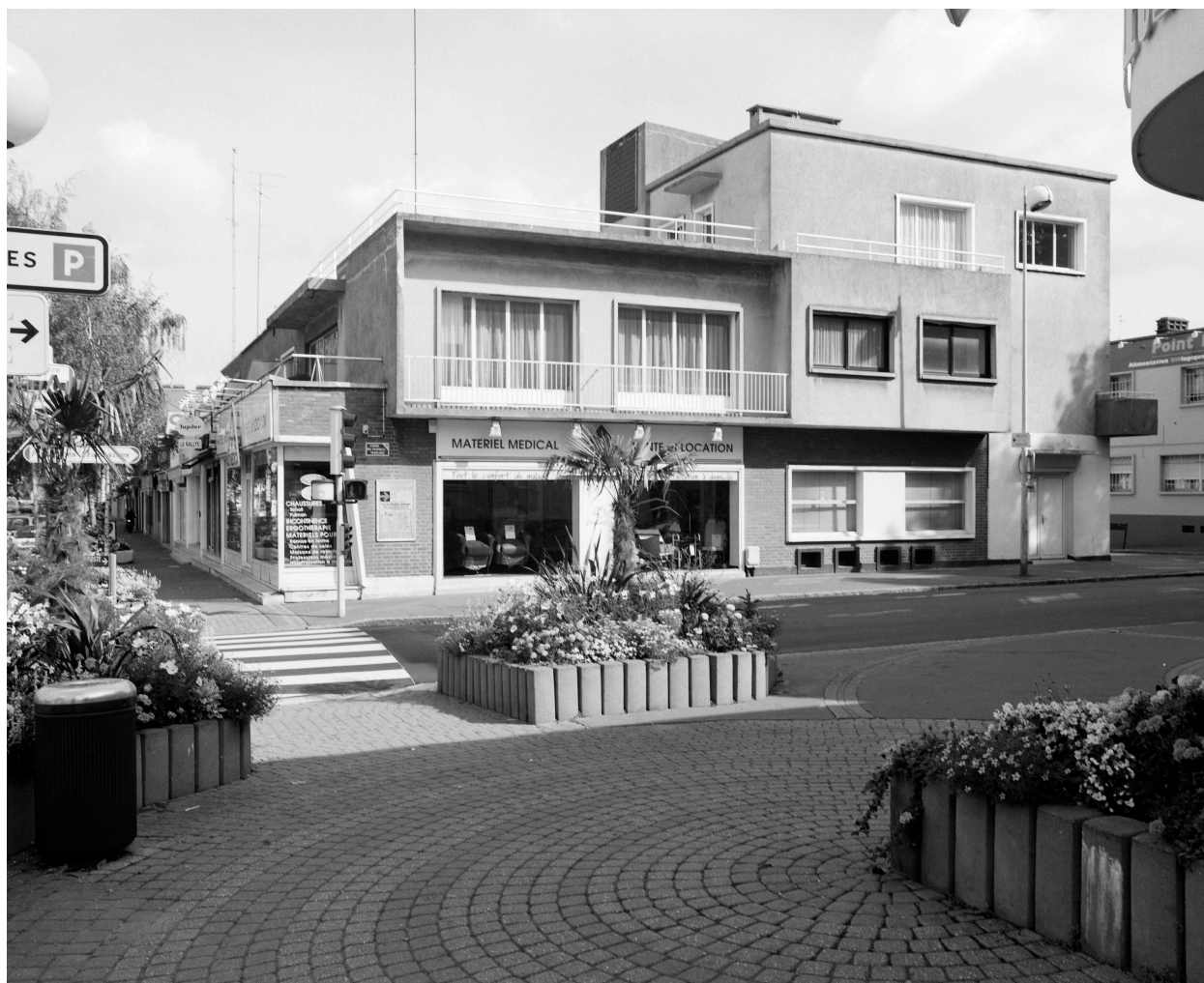
Vue générale de l'immeuble situé à l'angle de l'avenue de France et l'avenue des Provinces Françaises.