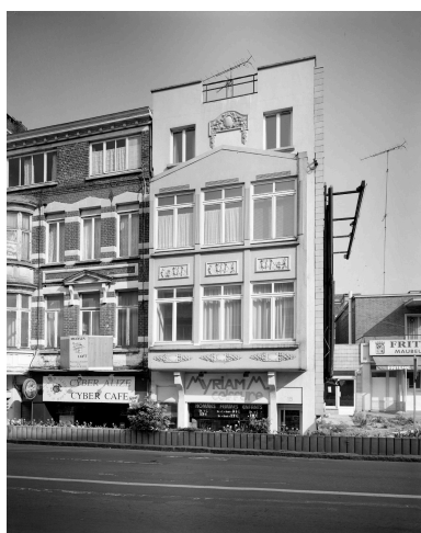
Maison de l'entre- deux-guerres (détruite). IVR31_20025901005V