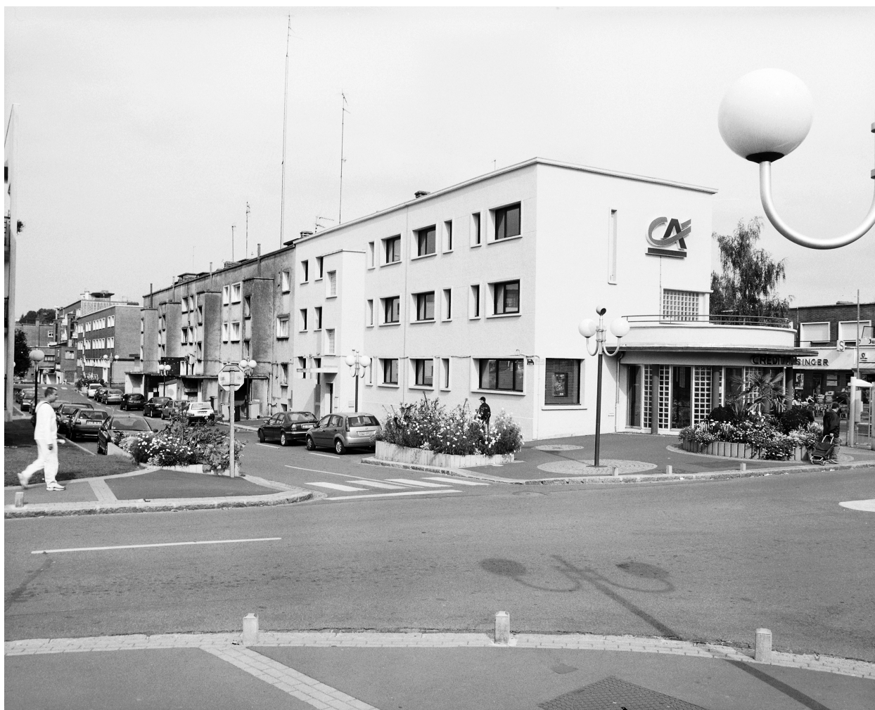
Vue générale de l'îlot M, l'élévation postérieure, rue de la porte de France.