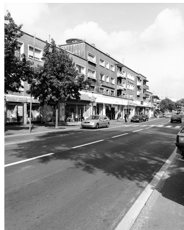
Vue générale de l'îlot I.