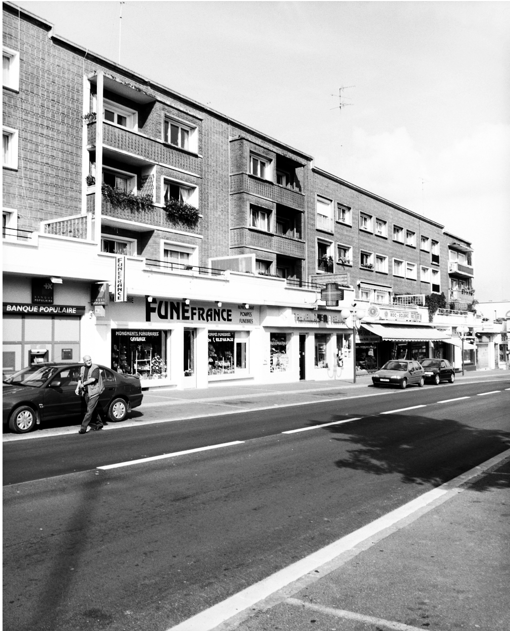
Vue générale du bloc 7 de l'îlot P : l'élévation antérieure donnant sur l'avenue de France.