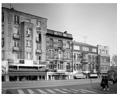
Îlot de maisons construites pendant l'entre-deux-guerres (détruit). IVR31_20025900998V