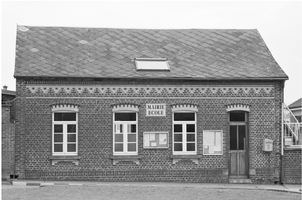
Façade antérieure de l'école donnant sur la place de l'Eglise.