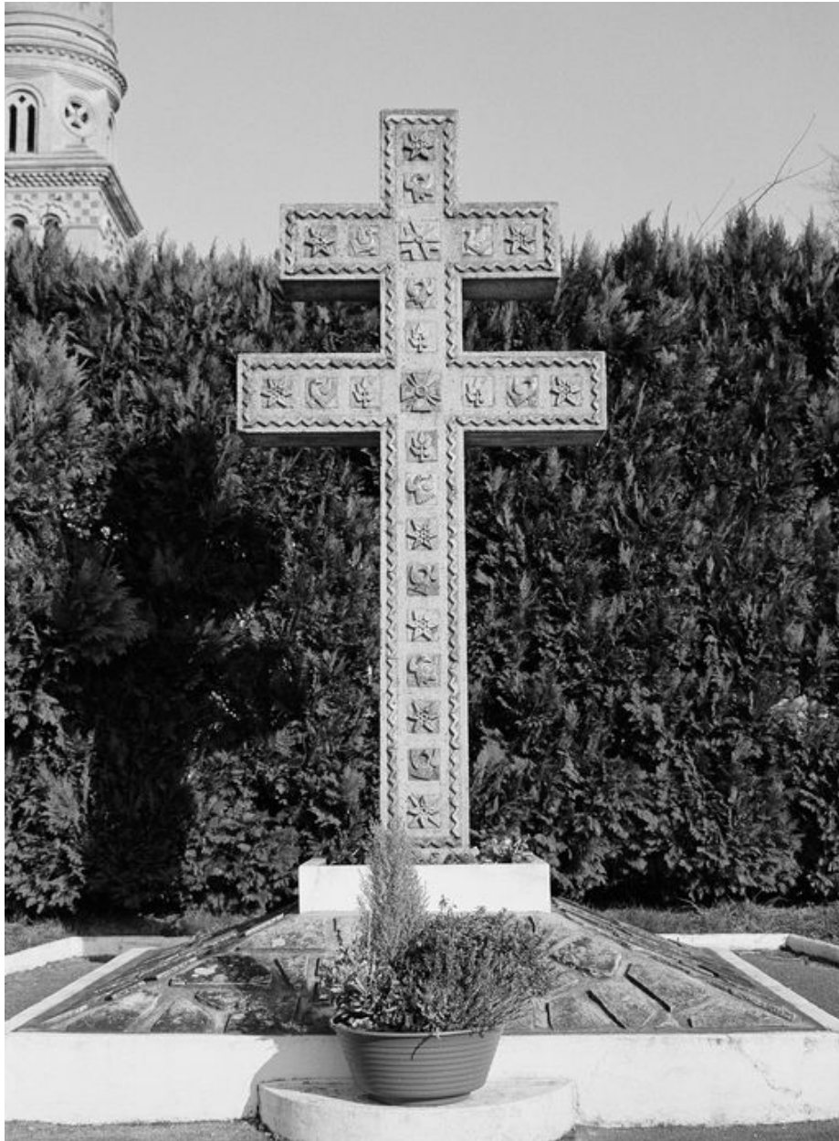
Vue générale du monument aux morts, érigé en 1952.