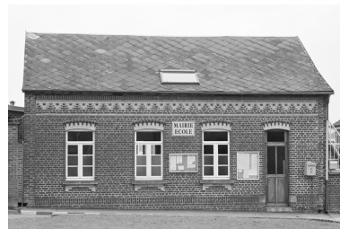
Façade antérieure de l'école donnant sur la place de l'Eglise.