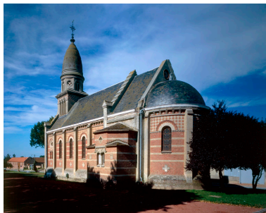
Eglise saint-Vaast. IVR22_19988000732VA