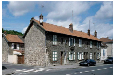
La cité Alphonse-Huré. IVR22_20106000396XA