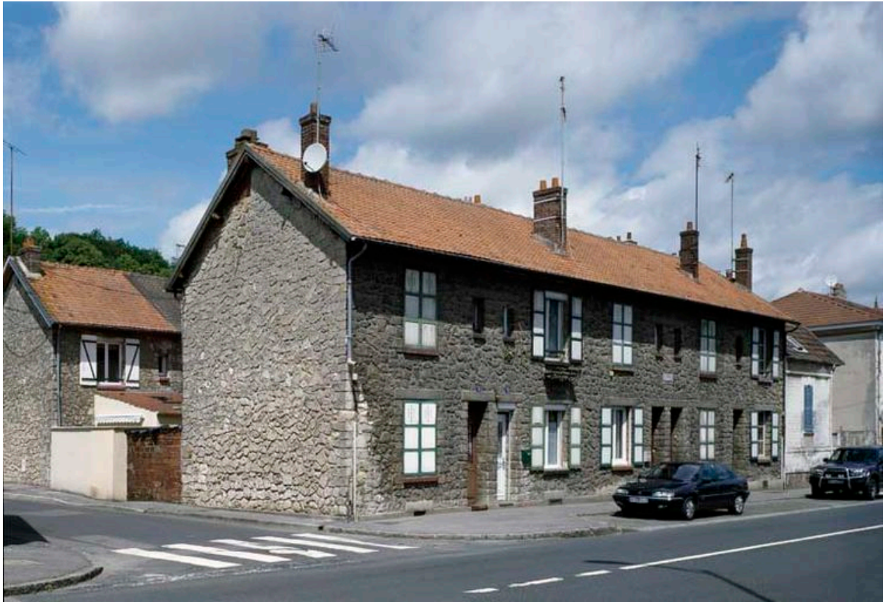
La cité Alphonse-Huré.