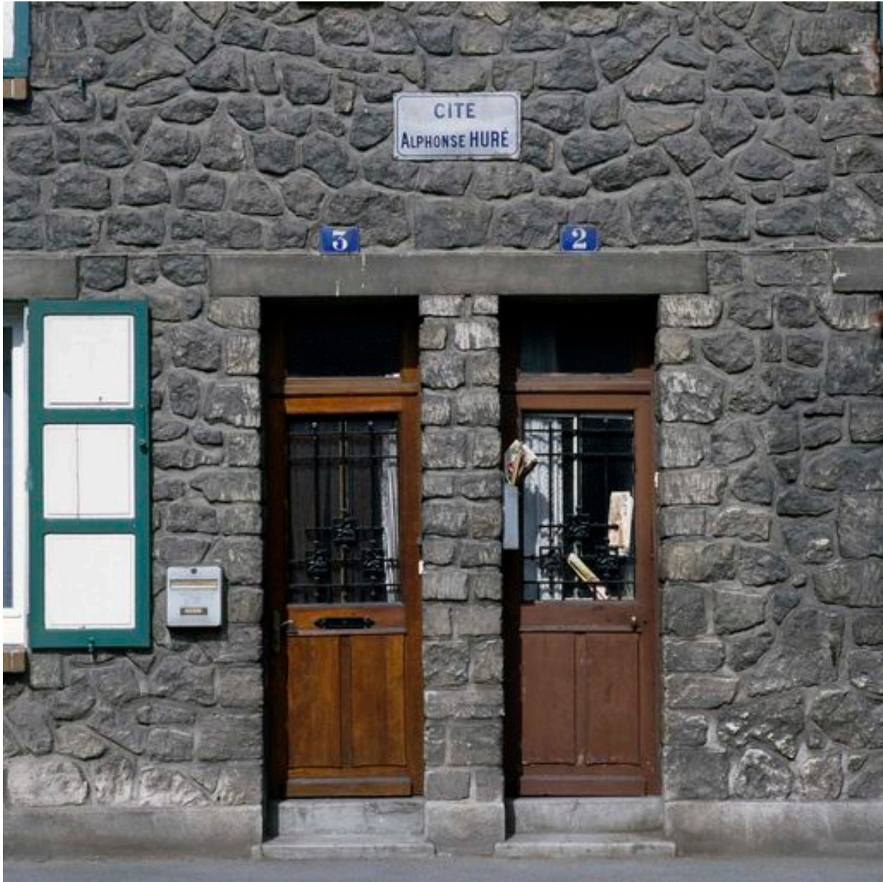
Entrée de deux logements de la cité Alphonse-Huré.