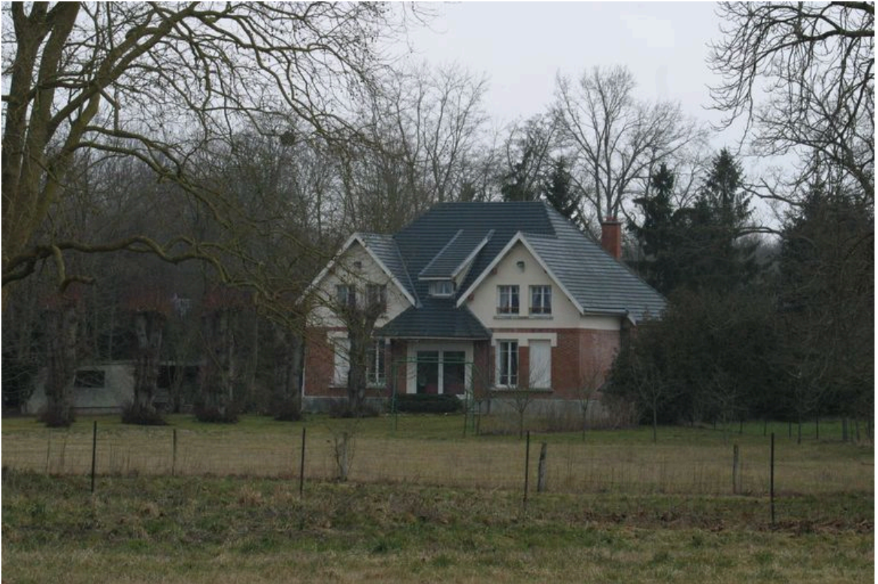
Vue postérieure du logement du gardien.