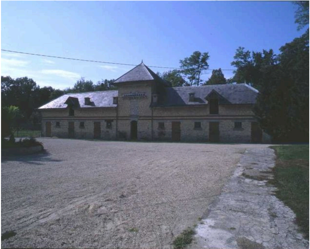
Bâtiments agricoles depuis la cour.