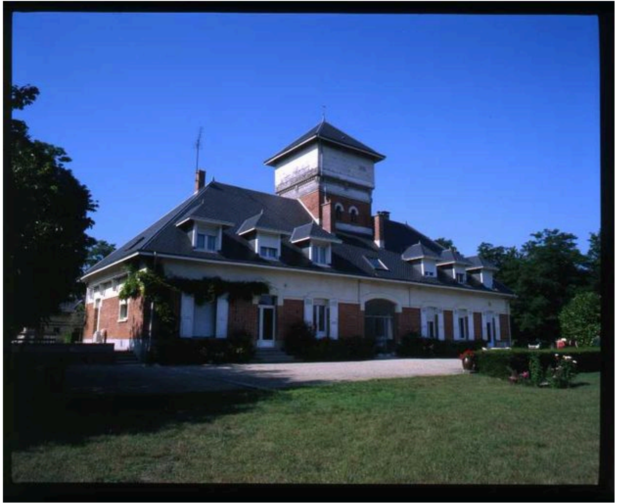
Vue générale de l'habitation principale.