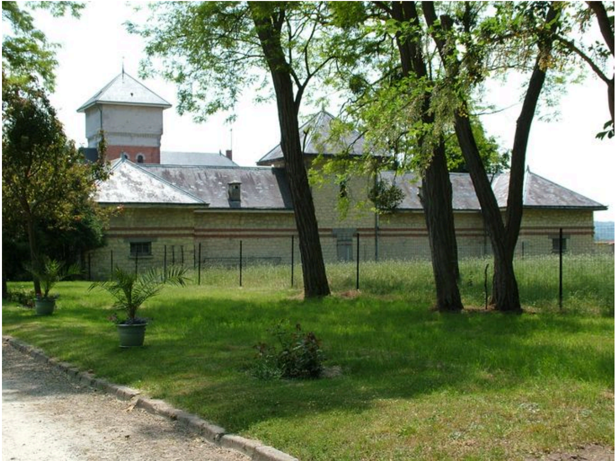
Vue, depuis l'extérieur de la propriété, des bâtiments agricoles surmontés du pigeonnier.