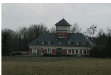
Façade postérieure de l'habitation principale. IVR22_20050200656NUCA