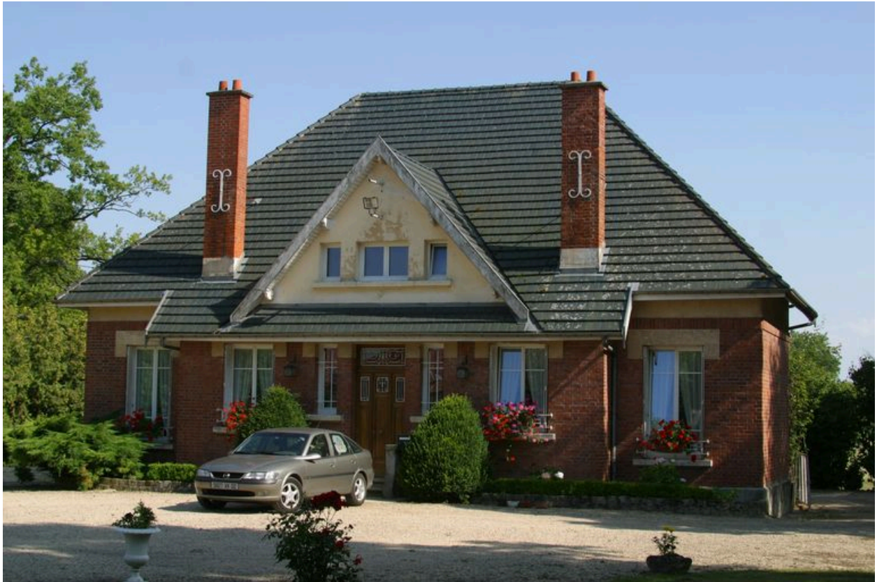
Vue sur cour du logement du gardien.