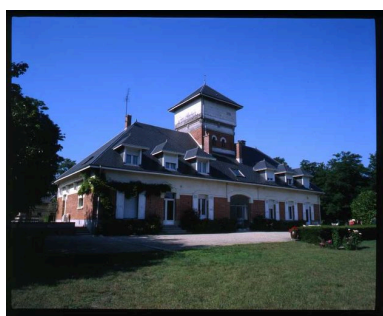
Vue générale de l'habitation principale. IVR22_20050200853NUCA