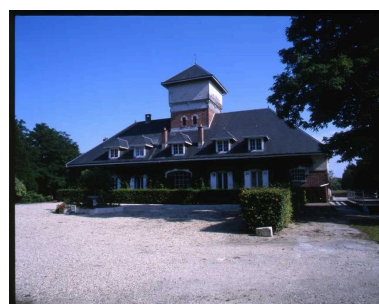
Façade sur cour de l'habitation principale. IVR22_20050200854NUCA