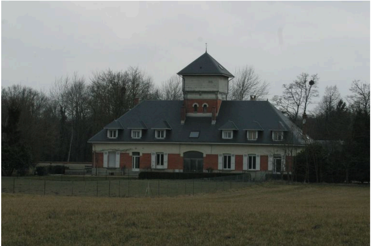
Façade postérieure de l'habitation principale.