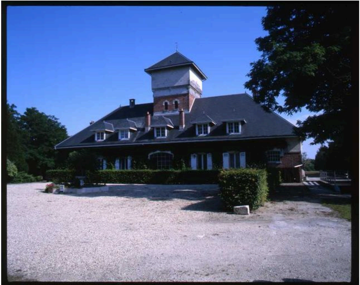
Façade sur cour de l'habitation principale.