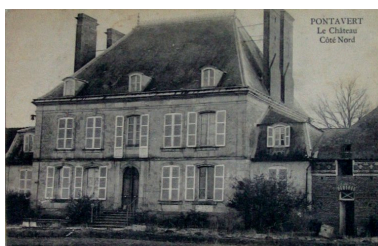
Elévation postérieure du manoir, avant 1917 (coll. part). IVR22_20030202980NUCAB