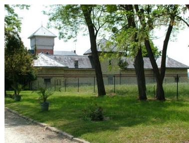
Vue, depuis l'extérieur de la propriété, des bâtiments agricoles surmontés du pigeonnier. IVR22_20030202957NUCA