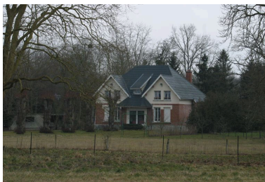
Vue postérieure du logement du gardien. IVR22_20050200655NUCA