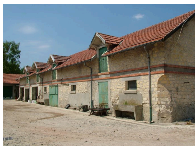
Bâtiments agricoles. IVR22_20030202956NUCA