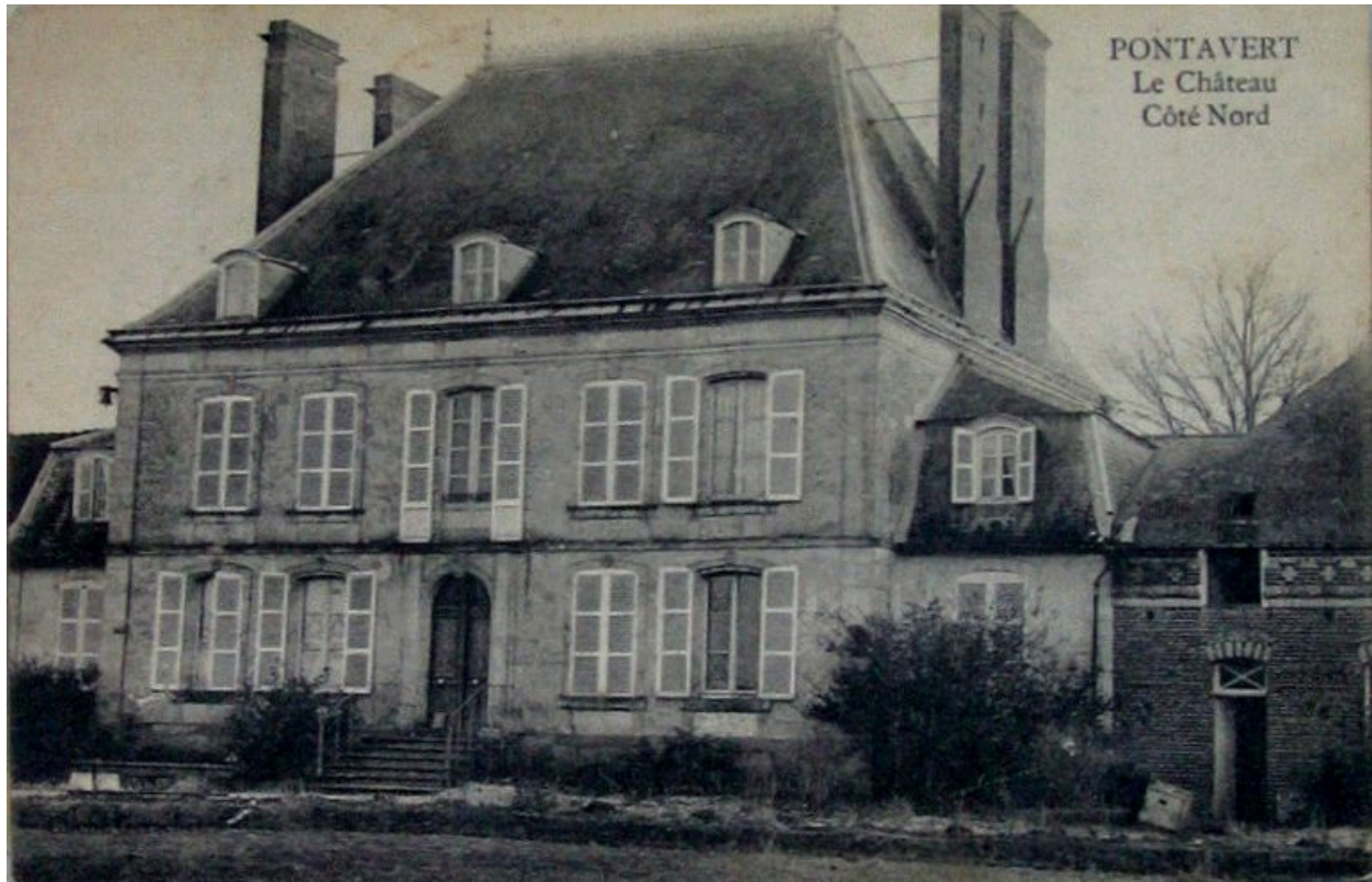
Elévation postérieure du manoir, avant 1917 (coll. part).