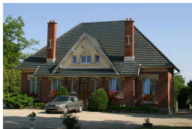
Vue sur cour du logement du gardien.