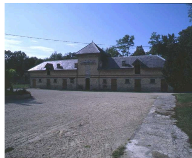
Bâtiments agricoles depuis la cour. IVR22_20050201102NUCA