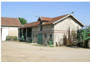
Bâtiment annexe.