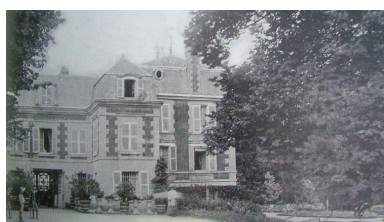
Vue de l'ancien château de Chevregny (coll. part). Phot. Inès Guérin