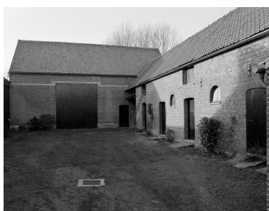
Vue générale de la cour : étables-écuries et grange.