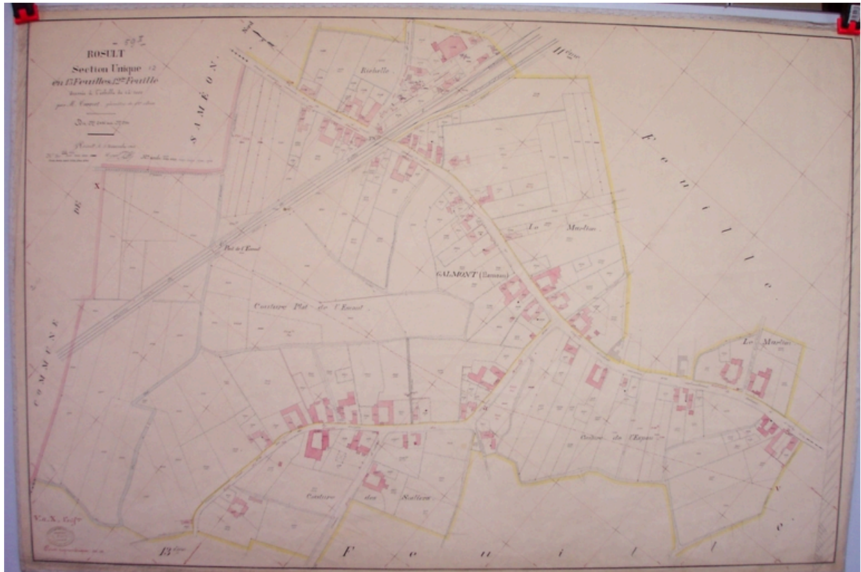
Situation sur le cadastre de 1912 (AD Nord P31/ 624).