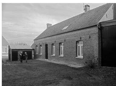
Vue générale du logis.