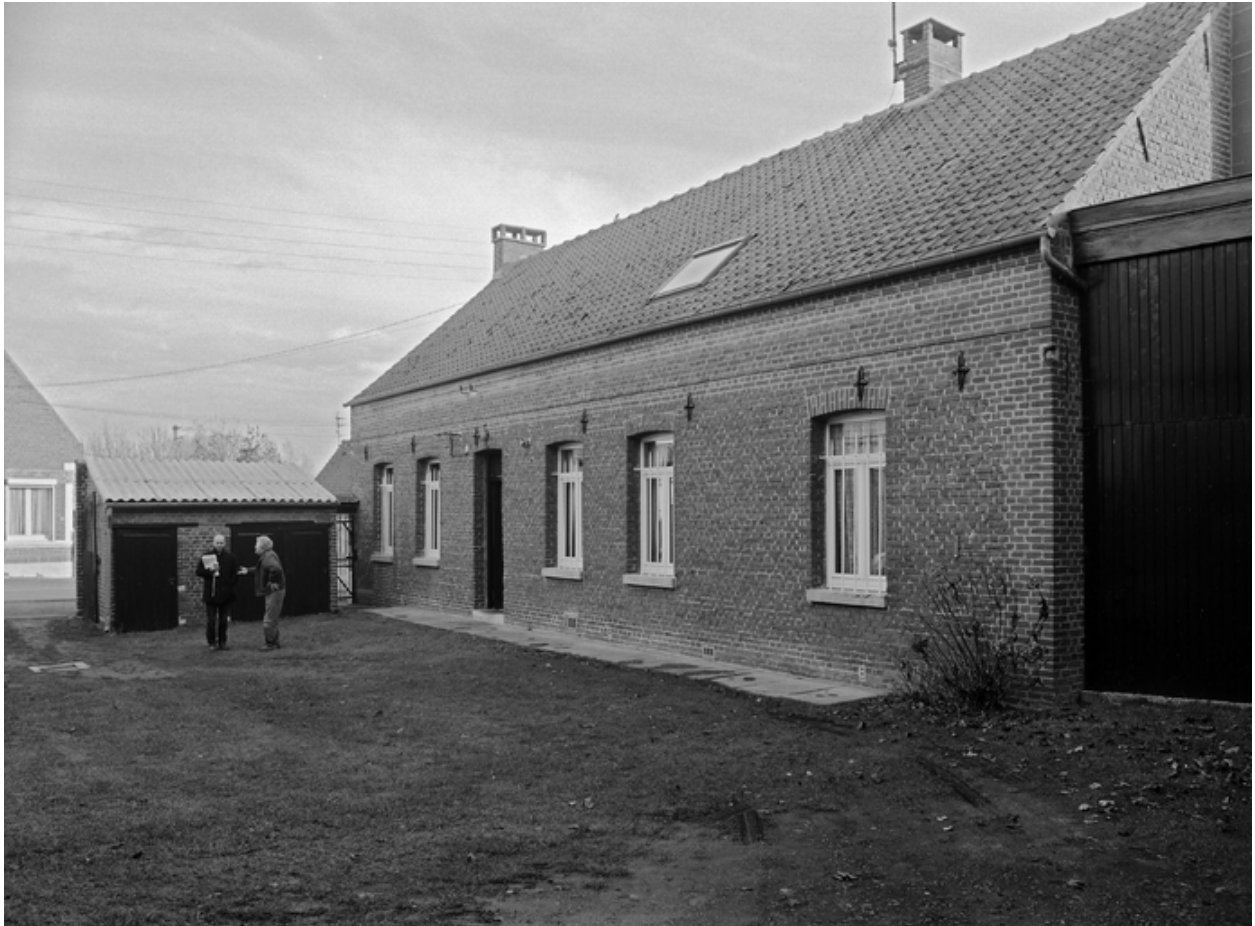
Vue générale du logis.