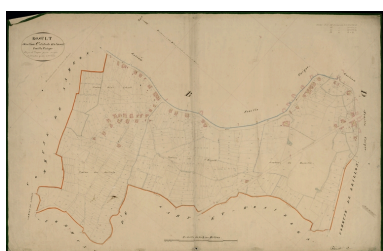
Situation sur le cadastre de 1830 (AD Nord P31/ 624). IVR31_20055907401NUCA