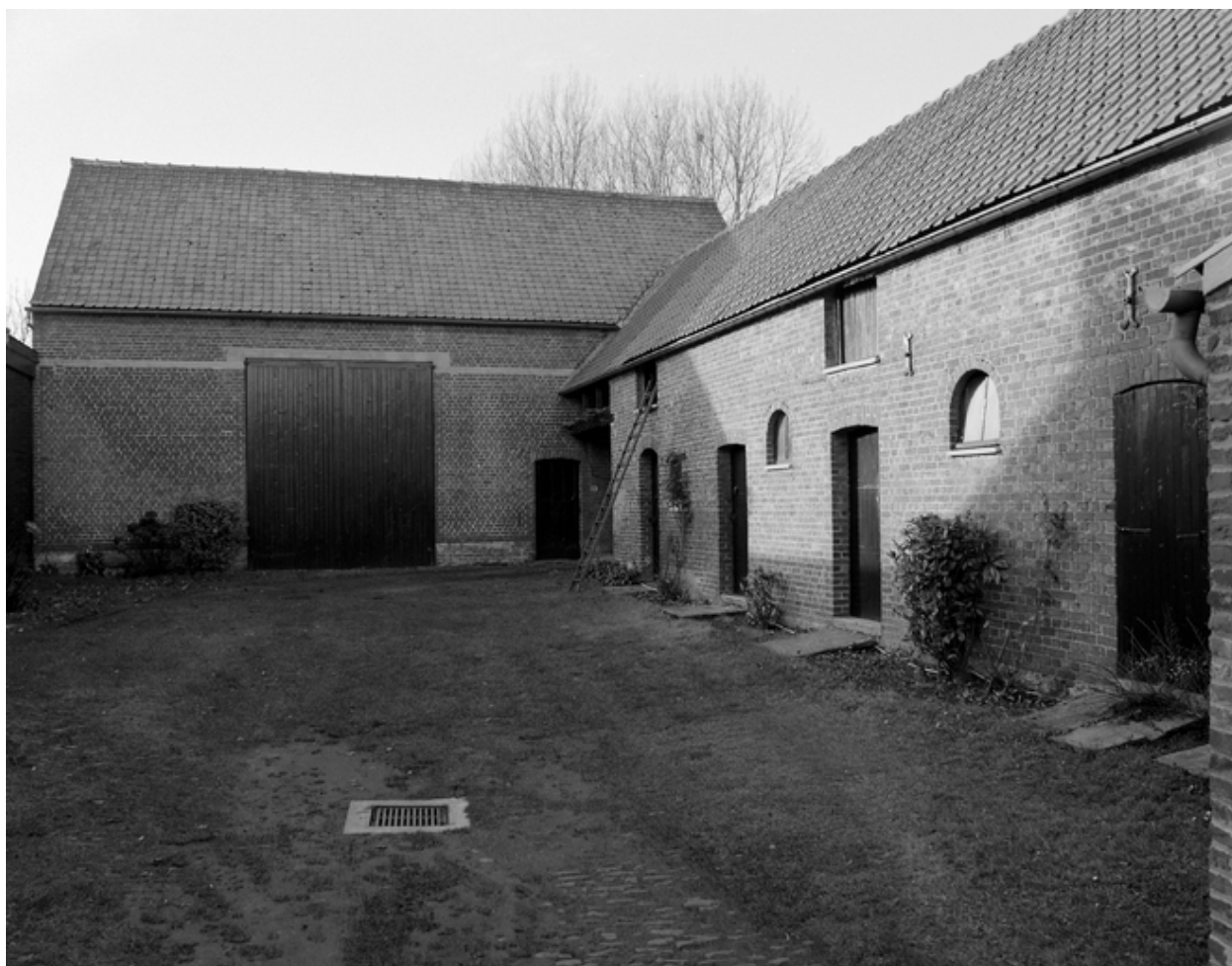
Vue générale de la cour : étables-écuries et grange.