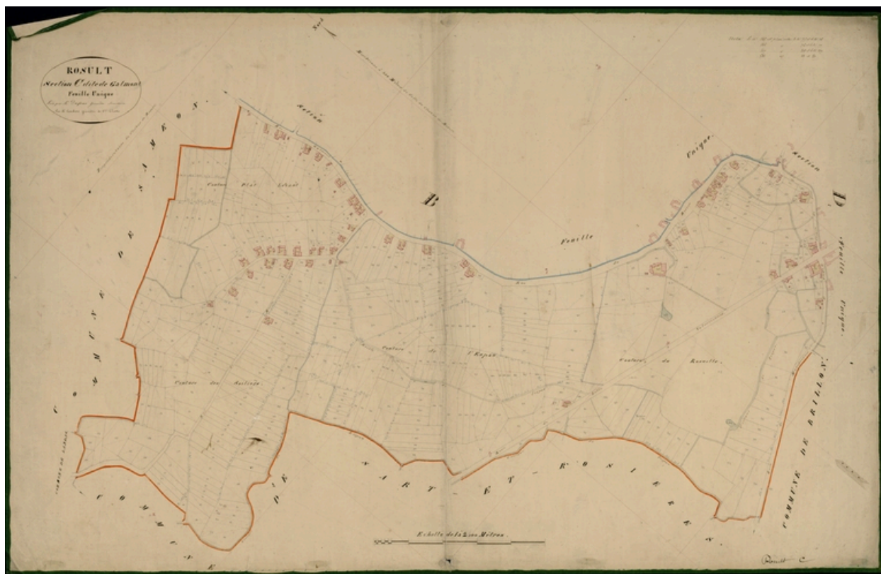
Situation sur le cadastre de 1830 (AD Nord P31/ 624).