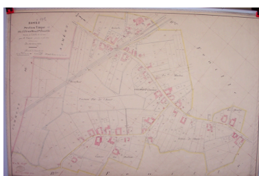
Situation sur le cadastre de 1912 (AD Nord P31/ 624).