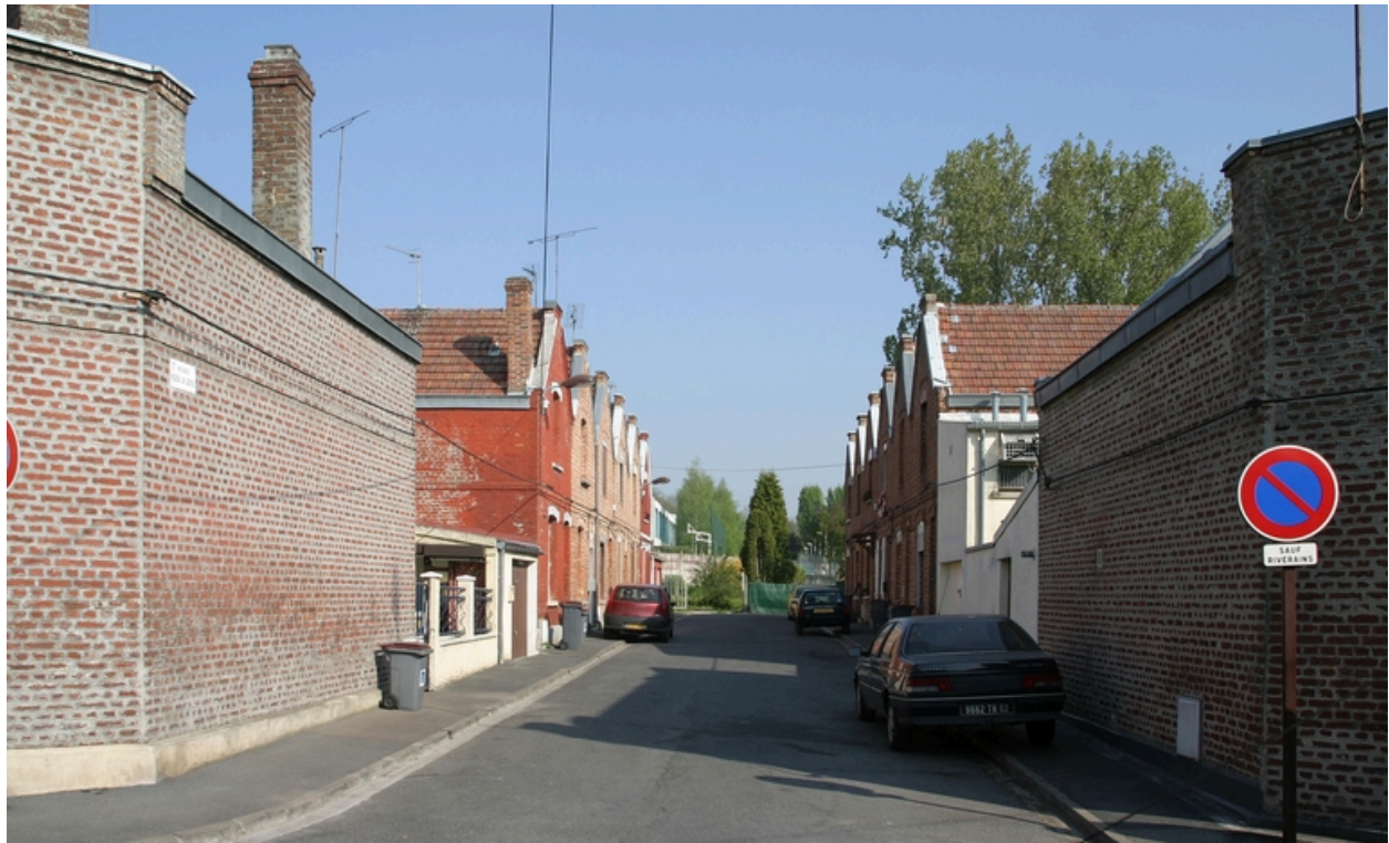
Logements ouvriers construits en 1922 dans l'impasse Pierre de Corbie.