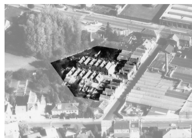
Vue aérienne de la cité en 1989.