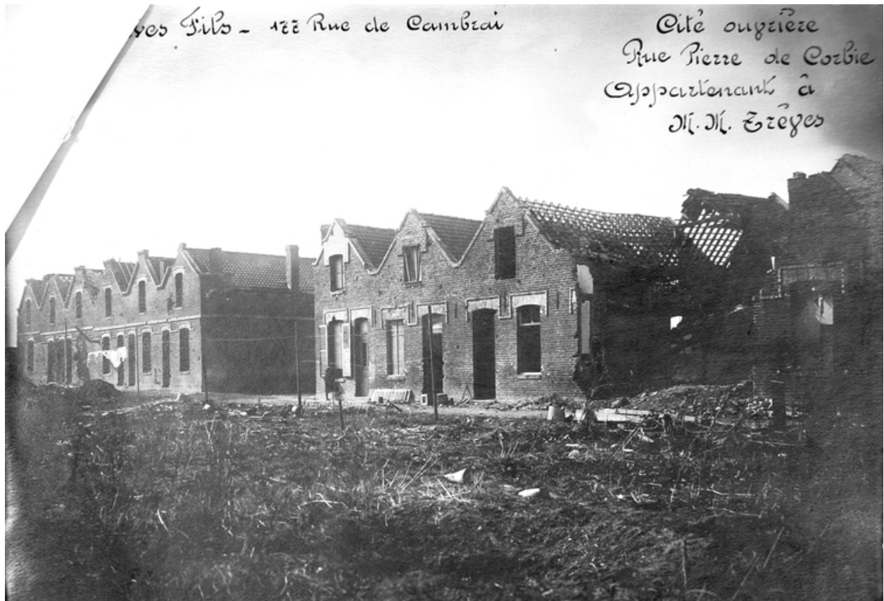
La cité ouvrière en ruine, par M. Chapelon, vers 1919 (AD Aisne).