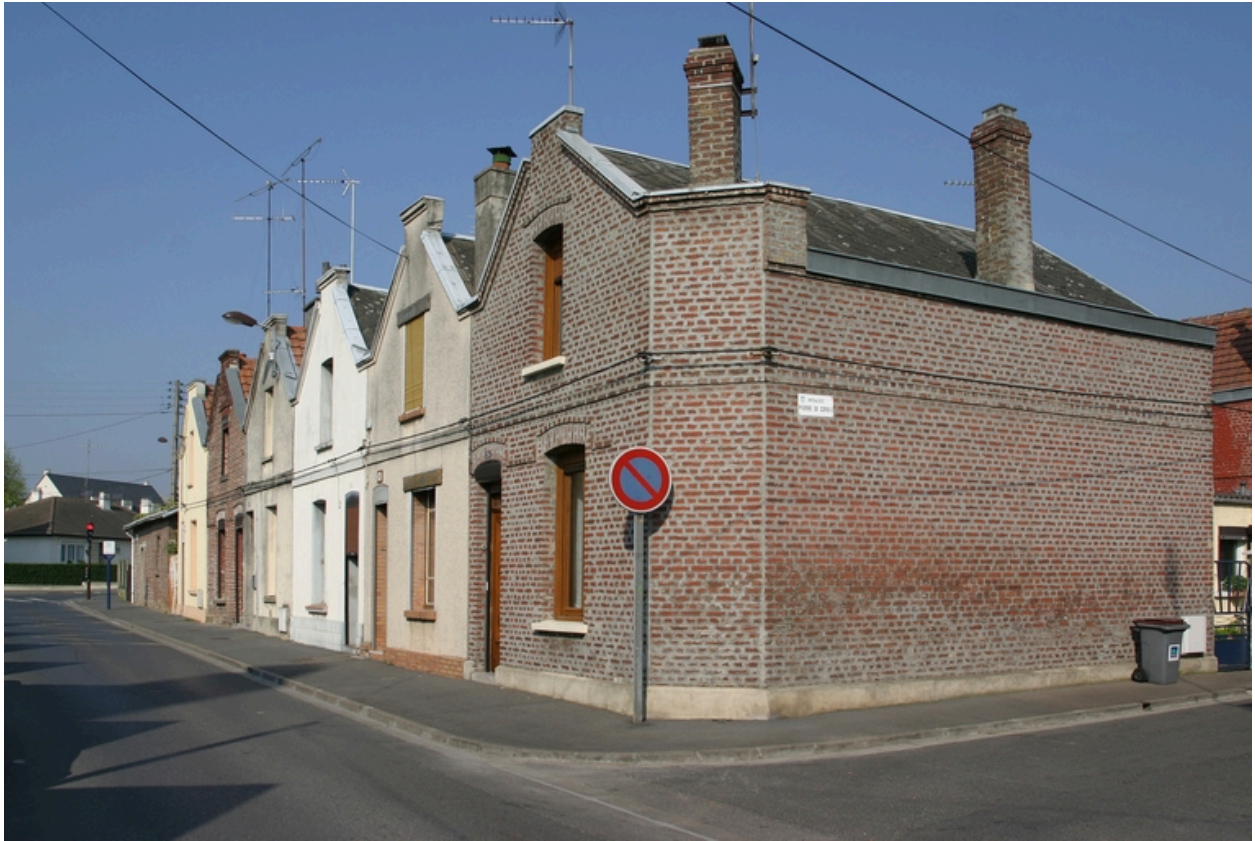
Groupe de six logements construits vers 1885.