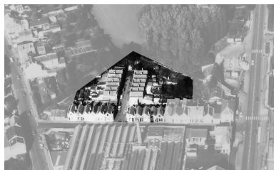
Vue aérienne de la cité en 1989.