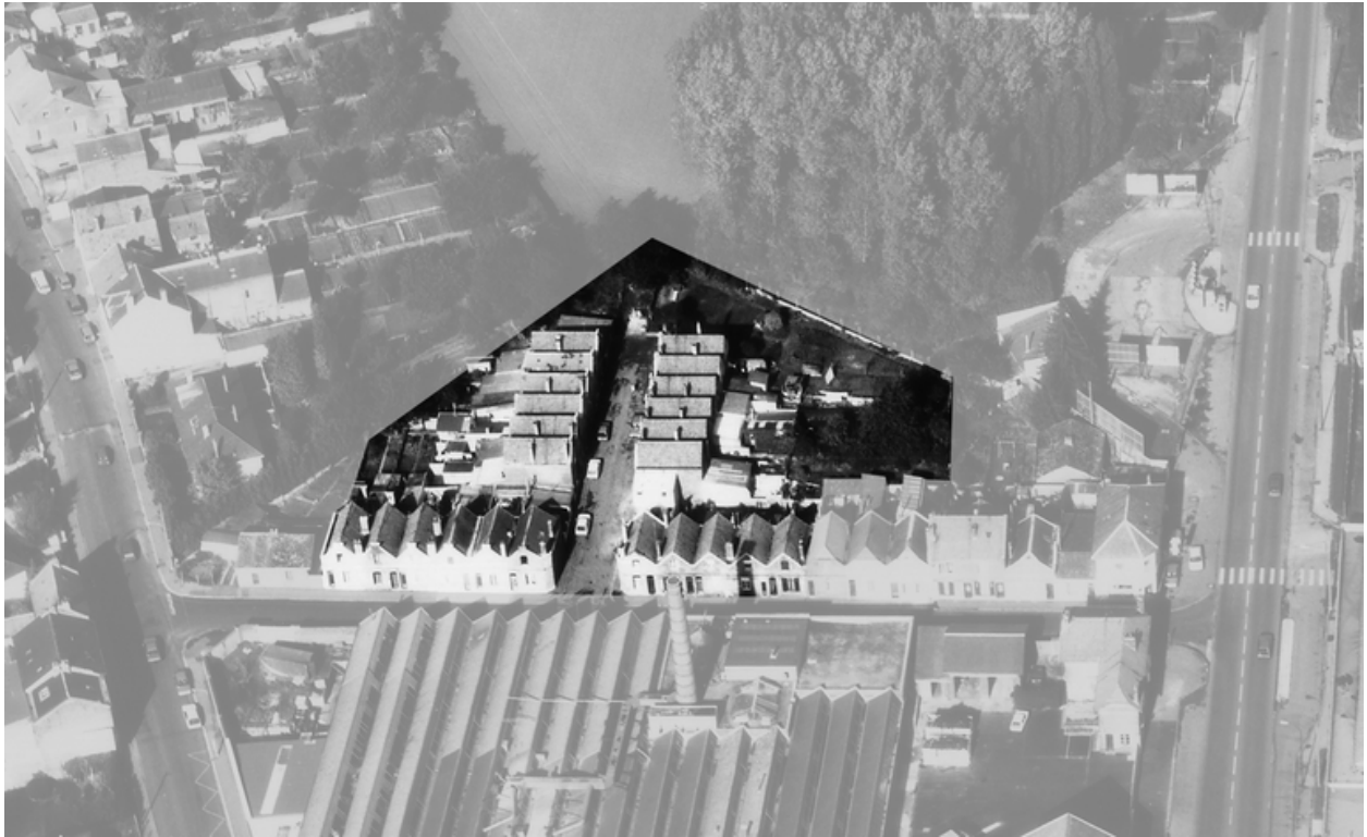
Vue aérienne de la cité en 1989.