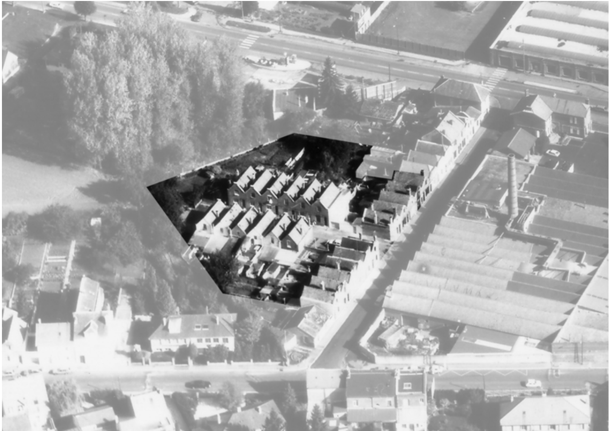
Vue aérienne de la cité en 1989.