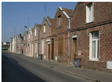
Les logements ouvriers construits vers 1885, rue Pierre de Corbie (au centre, l'impasse du même nom).