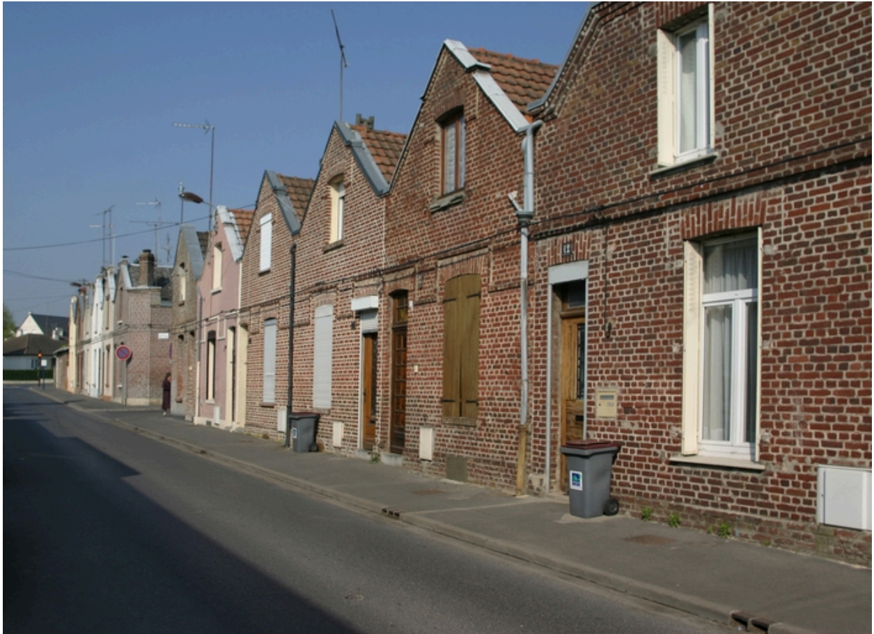
Les logements ouvriers construits vers 1885, rue Pierre de Corbie (au centre, l'impasse du même nom).