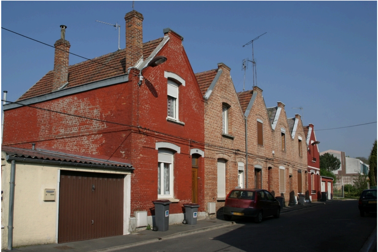
Vue d'un groupe de six habitations construites en 1922.