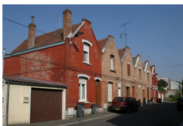
Vue d'un groupe de six habitations construites en 1922.