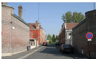
Logements ouvriers construits en 1922 dans l'impasse Pierre de Corbie.