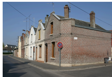
Groupe de six logements construits vers 1885.