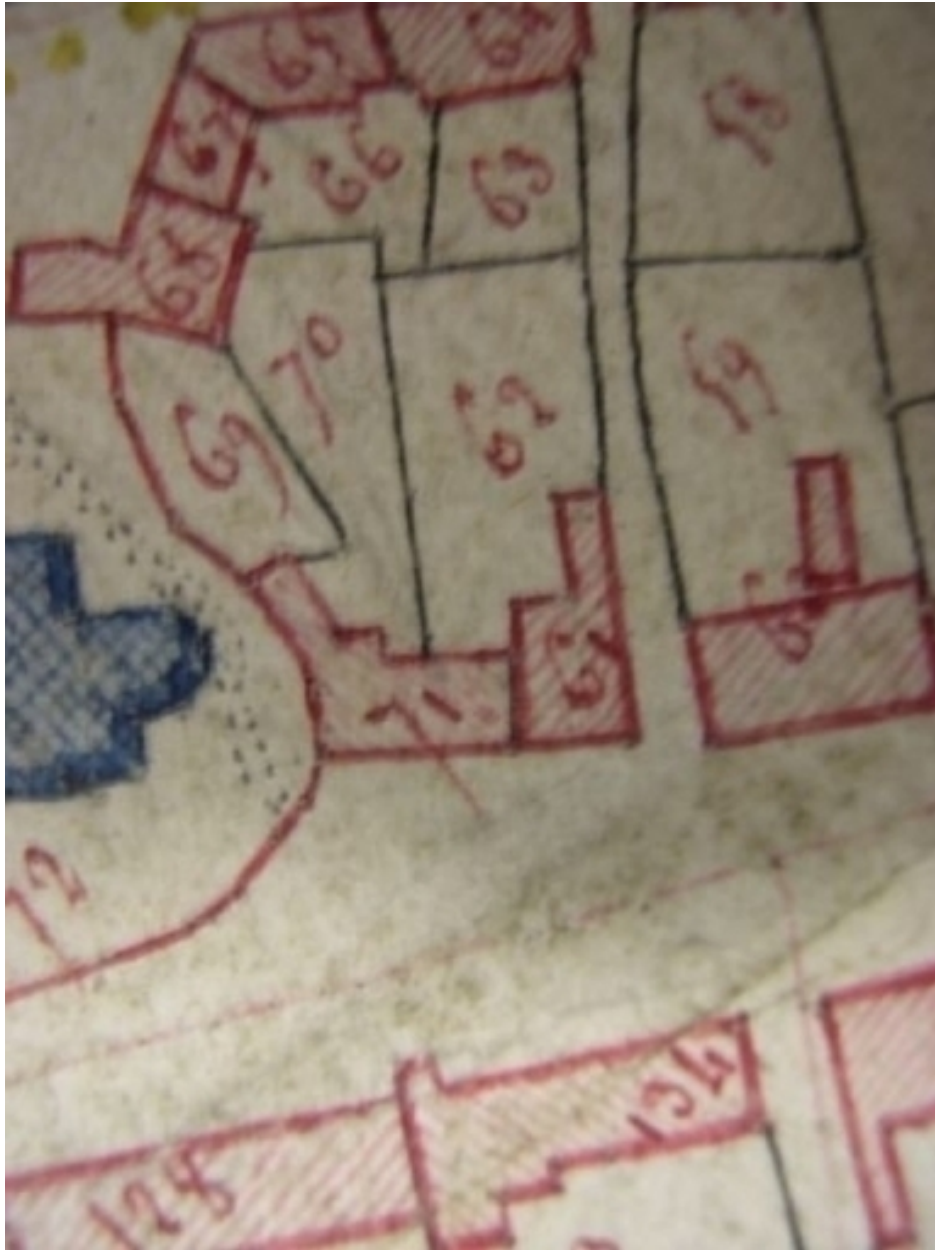
Extrait de la feuille cadastrale A2. Plan de situation en 1810.