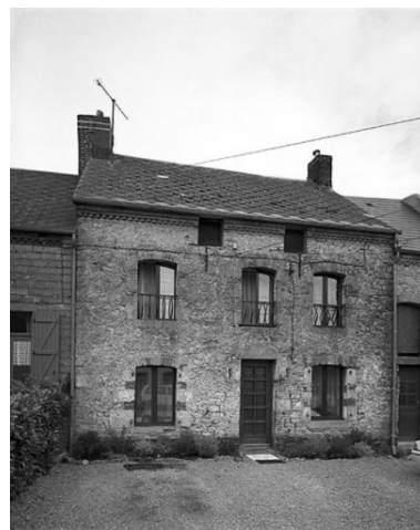
Vue générale. IVR31_20055904311V