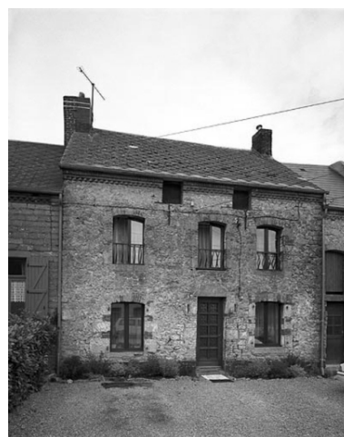
Vue générale. IVR31_20055904311V