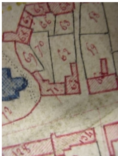
Extrait de la feuille cadastrale A2. Plan de situation en 1810.