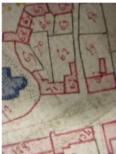
Extrait de la feuille cadastrale A2. Plan de situation en 1810. IVR31_20045905231NUCA