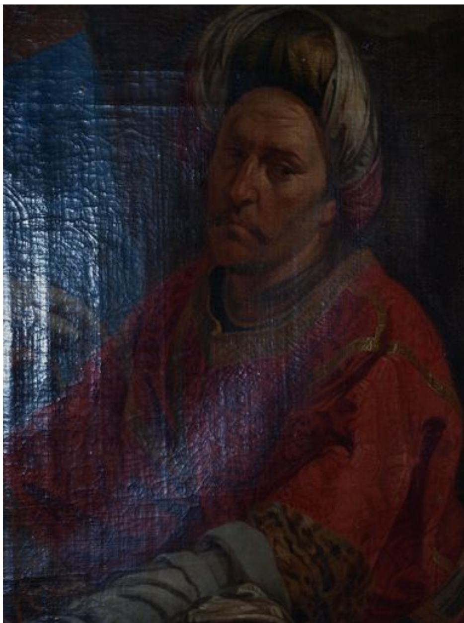
Vue de détail, Joseph d'Arimathie