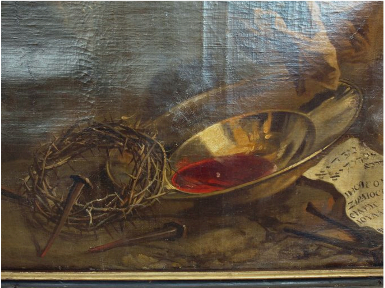
Vue de détail, instruments de la Passion