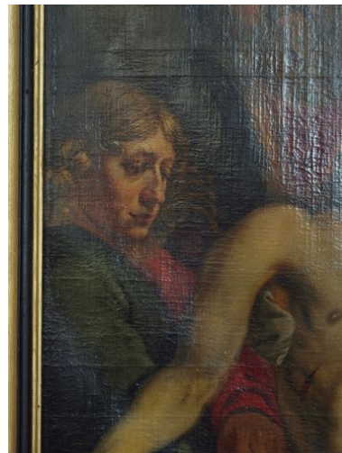
Vue de détail, saint Jean IVR31_20106203300NUCA