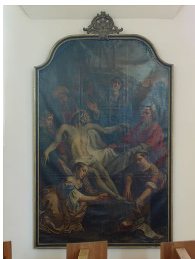
Vue générale