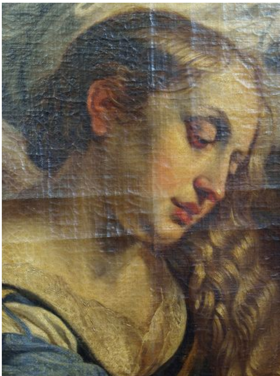
Vue de détail, visage de sainte Marie-Madeleine