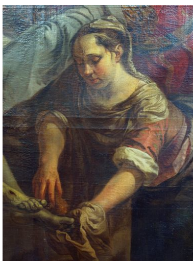
Vue de détail, sainte Marthe