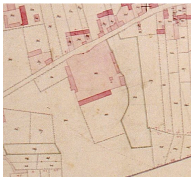
Extrait du cadastre napoléonien présentant le plan de la ferme en 1832.

IVR22_20078005096XAB