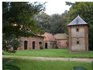
Vue générale des bâtiments agricoles.