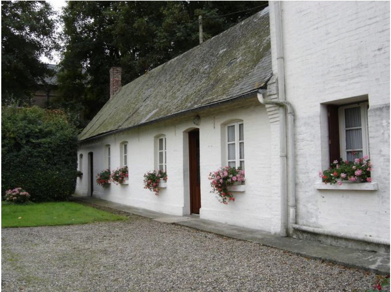
Vue du logis.