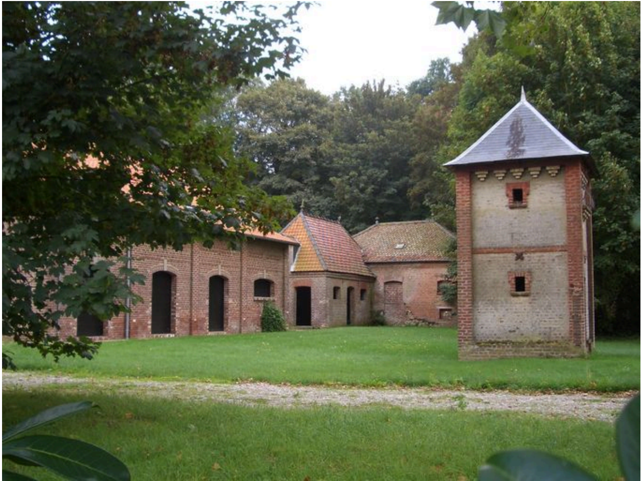
Vue générale des bâtiments agricoles.