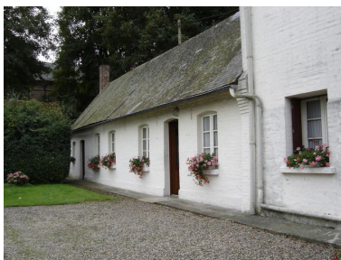
Vue du logis. IVR22_20078005093NUCA

IVR22_20078005096XAB