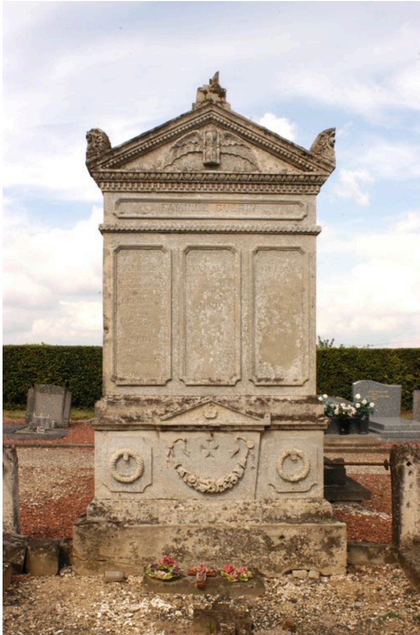
Vue de la stèle.