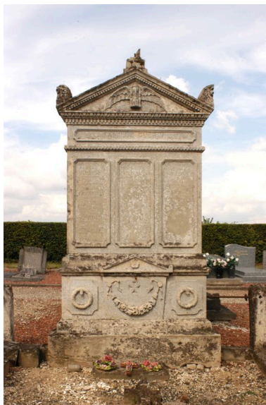
Vue de la stèle. IVR22_20038000847NUCA