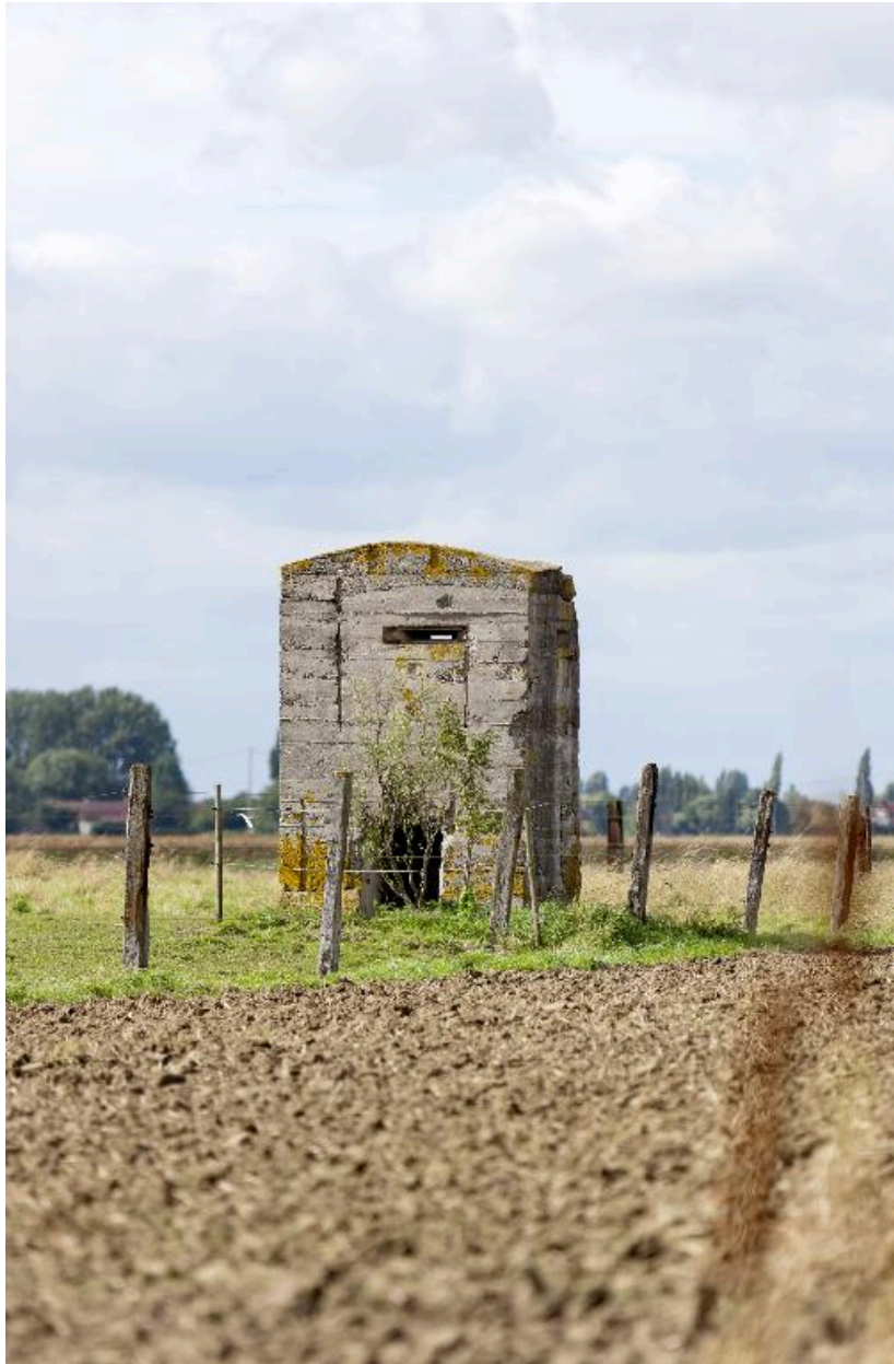
Vue générale vers le nord-ouest