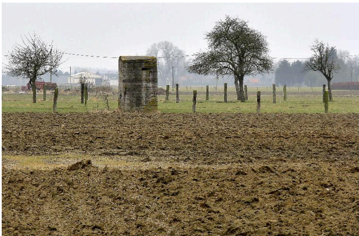
Vue générale, vers l'ouest