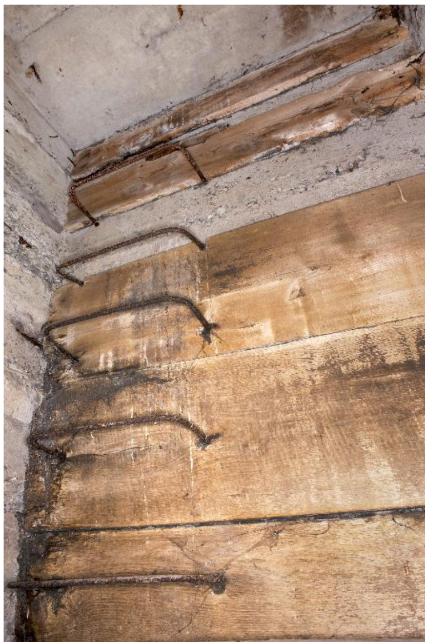
Vue intérieure : échelons métalliques et coffrage