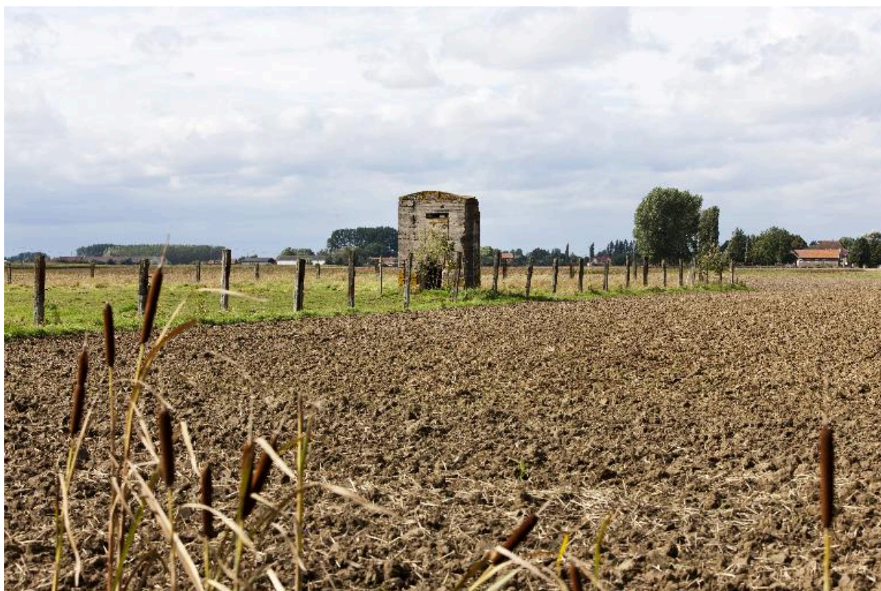
Vue générale vers le nord-ouest