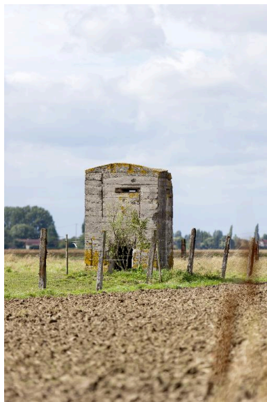
Vue générale vers le nord-ouest