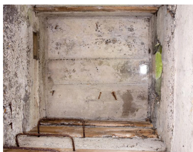
Vue intérieure zénithale