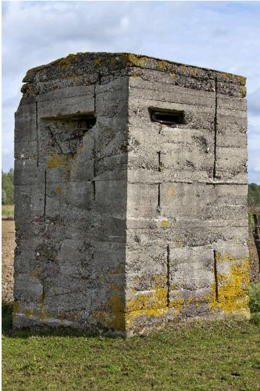
Elévations sud-ouest et nord-ouest