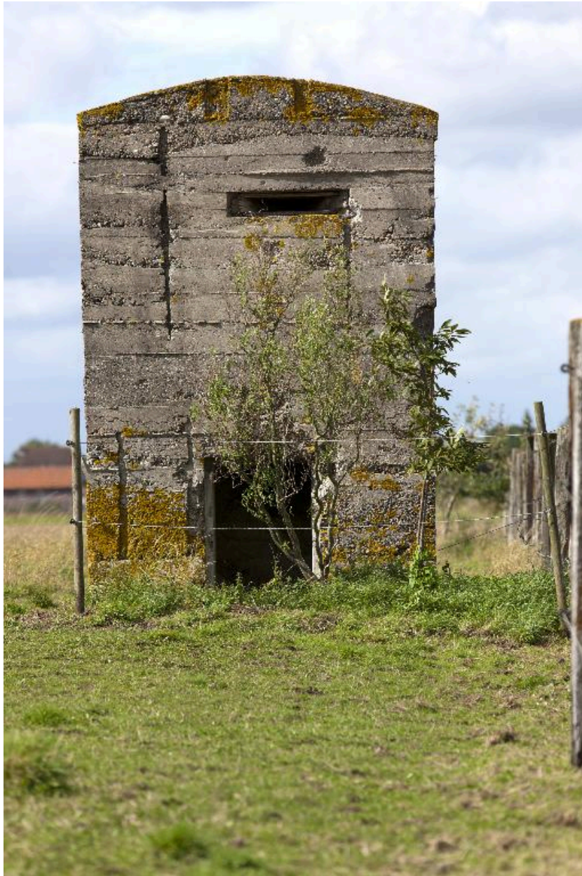
Vue frontale, vers le nord-ouest