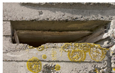
Ebrasure sud-est pour la communication optique (vers Aubers)