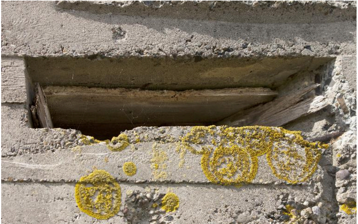
Ebrasure sud-est pour la communication optique (vers Aubers)