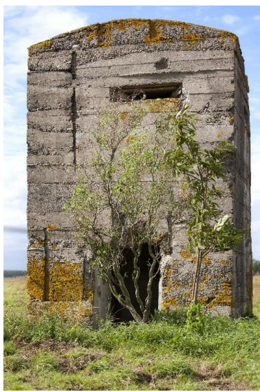
Vue frontale, vers le nord-ouest