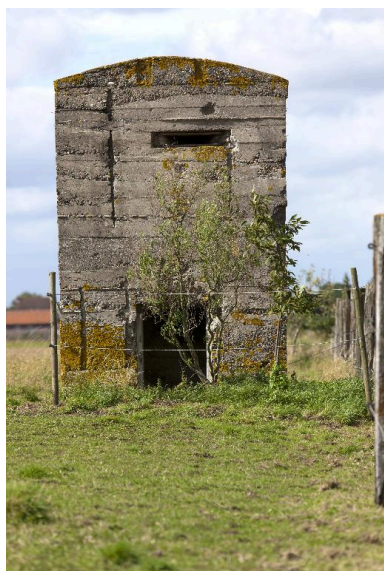
Vue frontale, vers le nord-ouest IVR31_20145904235NUCA