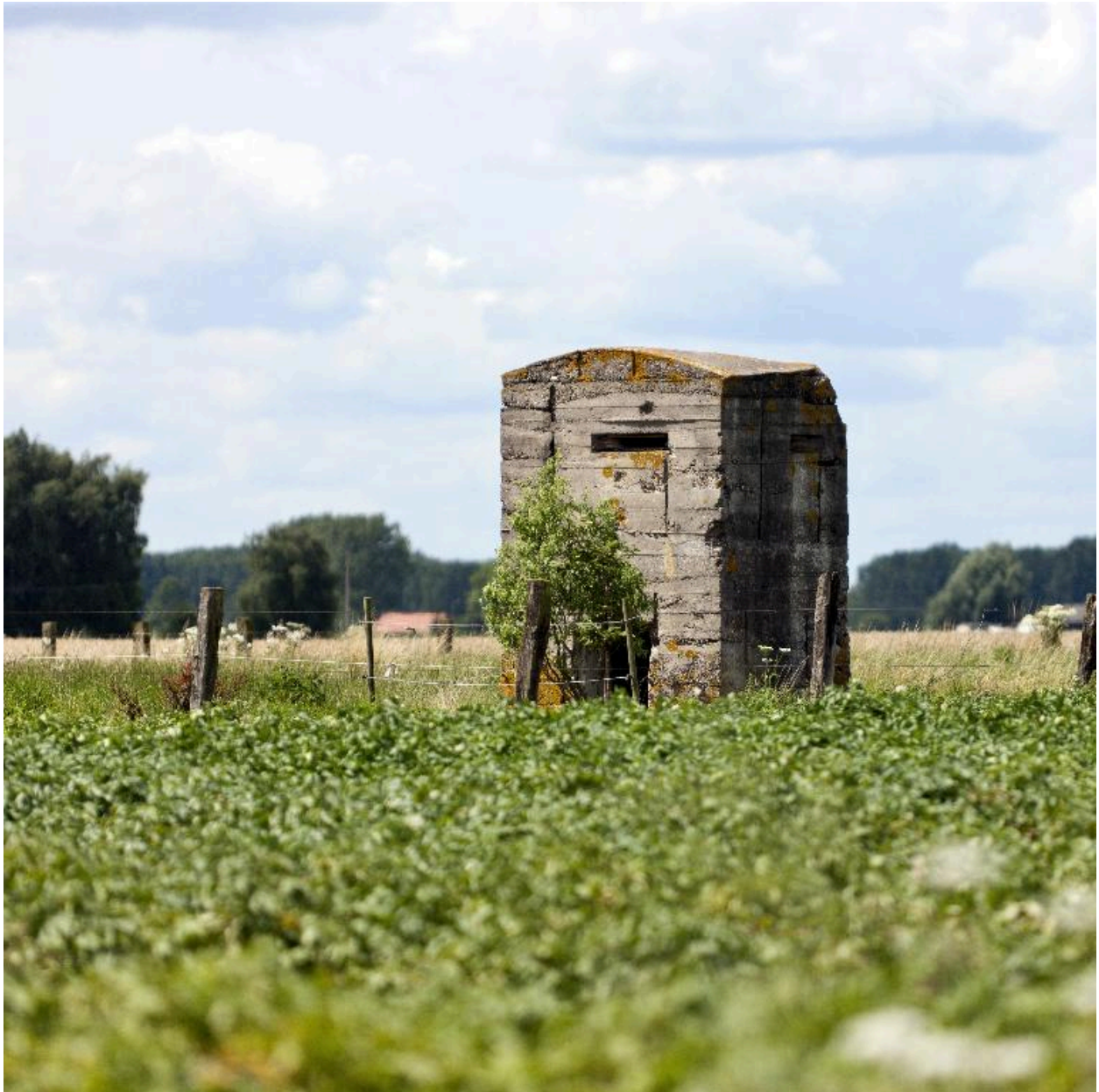
Vue générale vers le nord-ouest