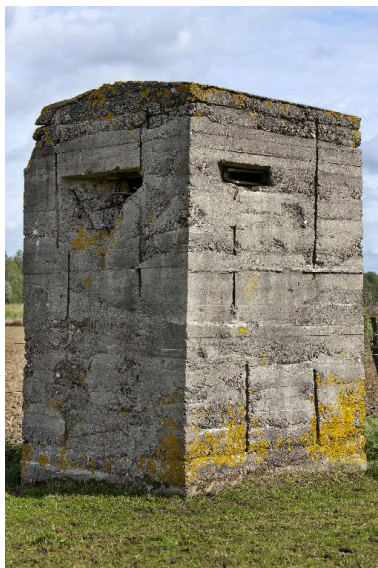
Elévations sud-ouest et nord-ouest IVR31_20145904242NUCA