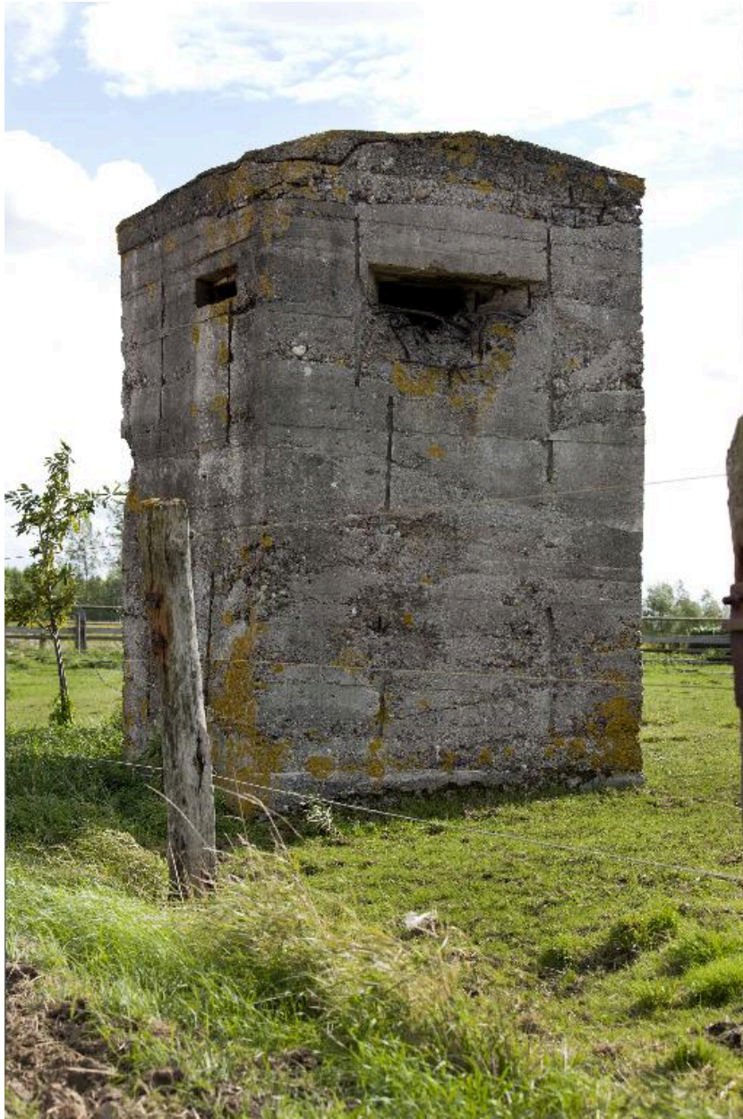
Elévation nord-ouest et nord-est