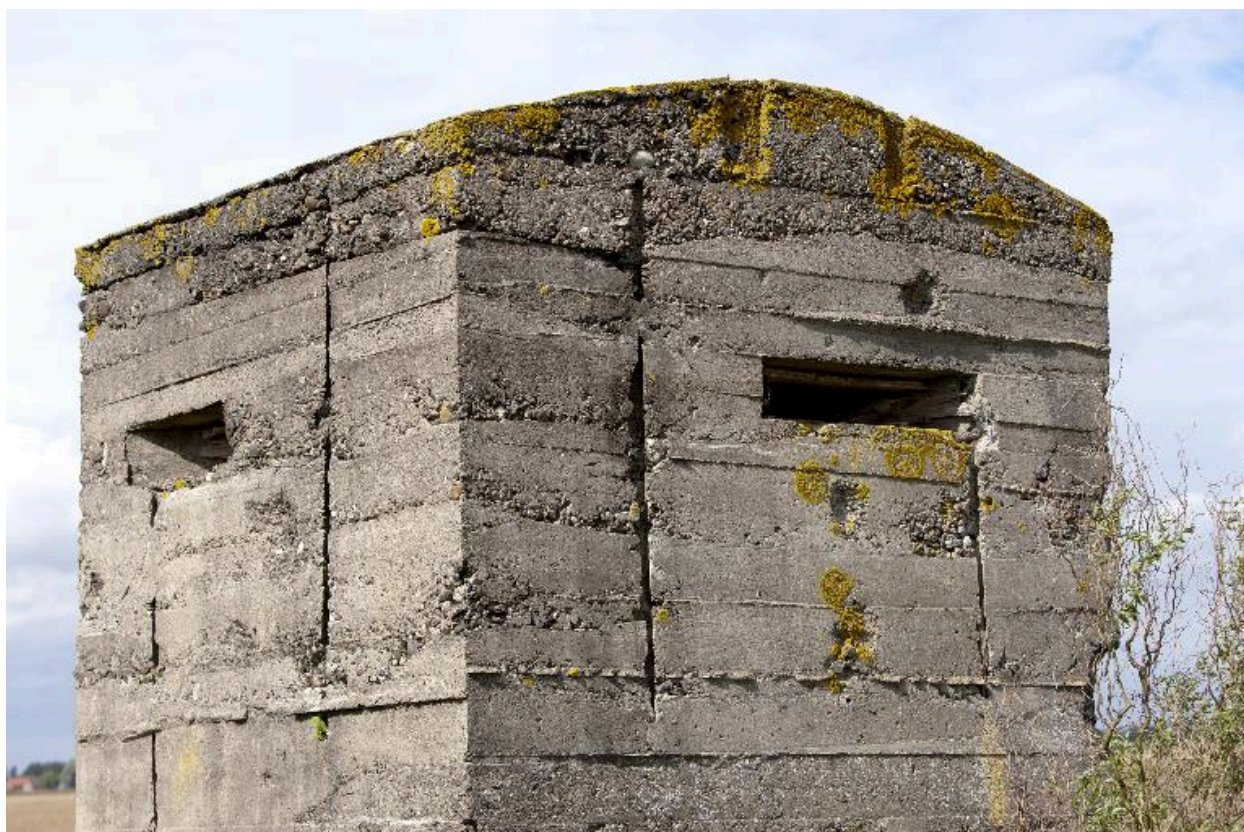
Ebrasures sud-est (vers Aubers) et sud-ouest (vers le front)