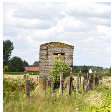
Vue générale vers le nord-ouest IVR31_20145904243NUCA