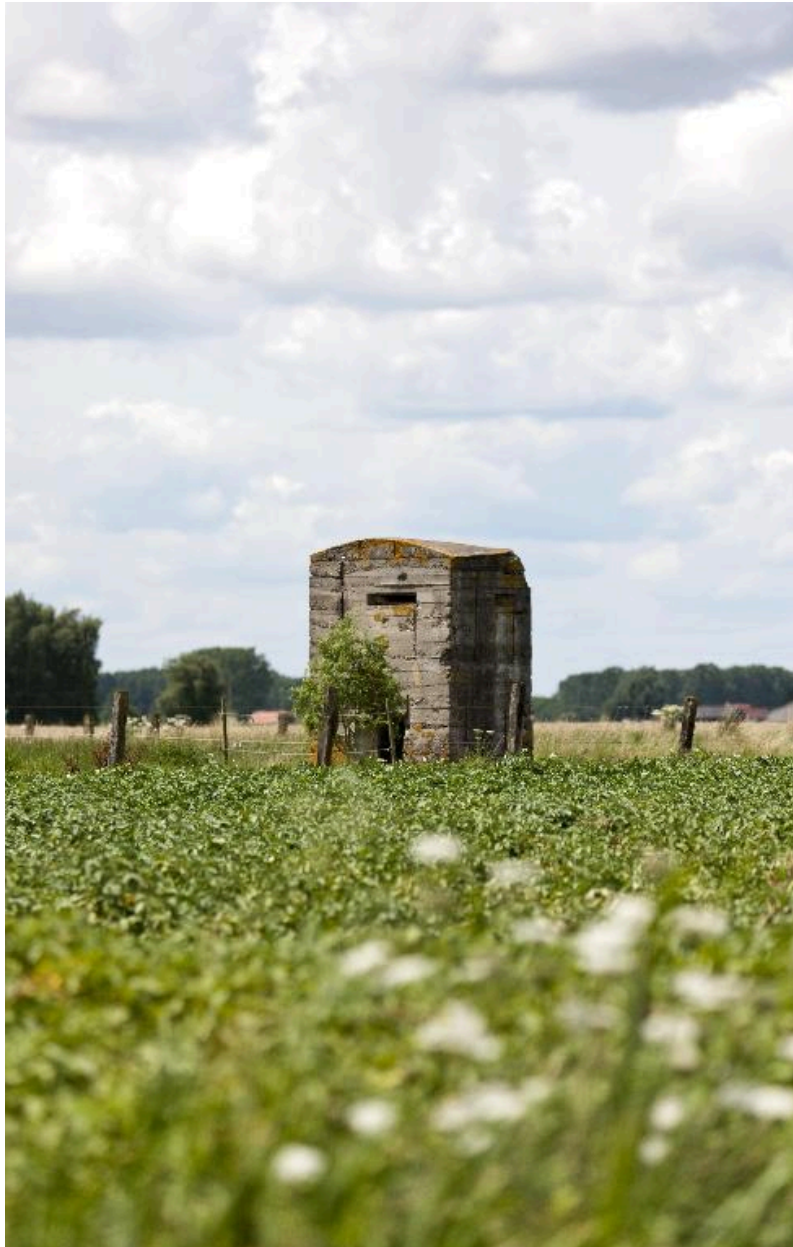
Vue générale vers le nord-ouest