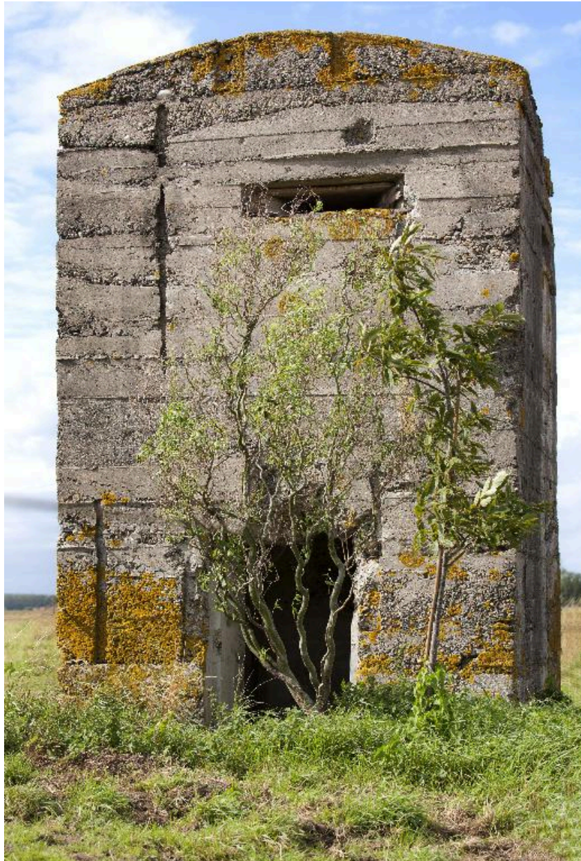
Vue frontale, vers le nord-ouest