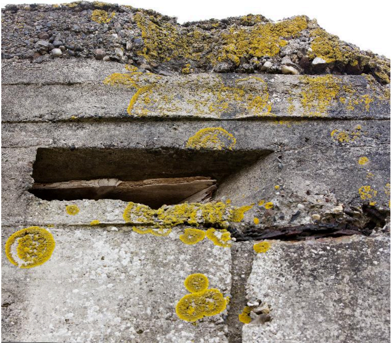
Ebrasure d'observation nord-est