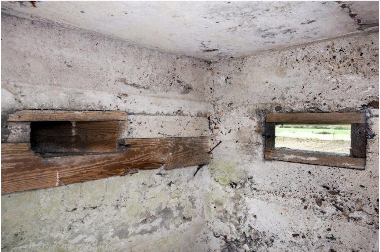
Vue intérieure : ébrasures d'observation