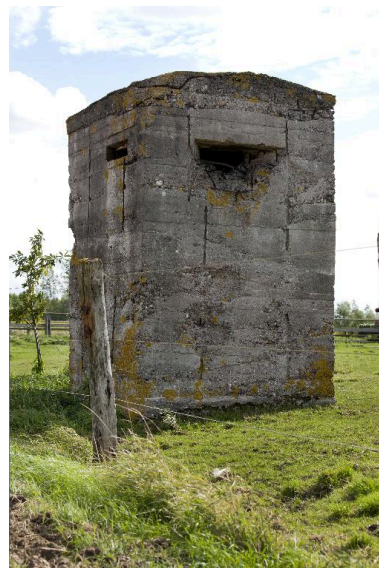
Elévation nord-ouest et nord-est IVR31_20145904239NUCA