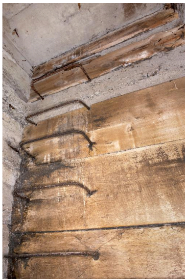
Vue intérieure : échelons métalliques et coffrage IVR32_20165900570NUCA