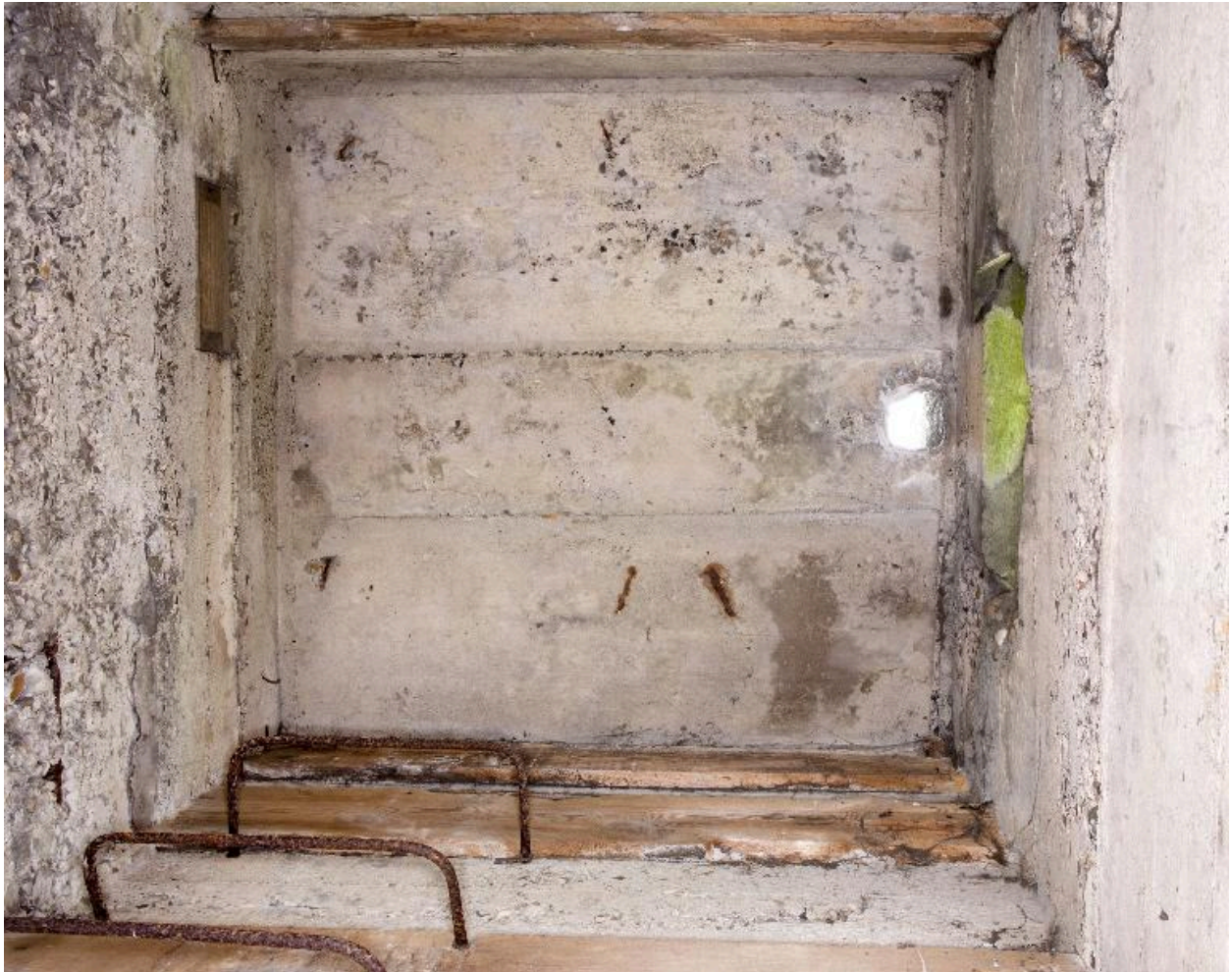
Vue intérieure zénithale