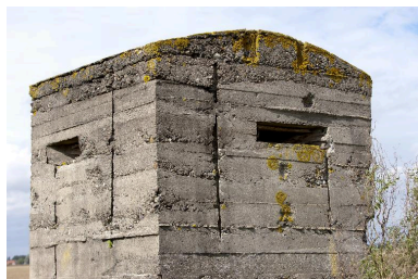
Ebrasures sud-est (vers Aubers) et sud-ouest (vers le front)