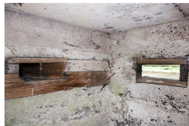
Vue intérieure : ébrasures d'observation