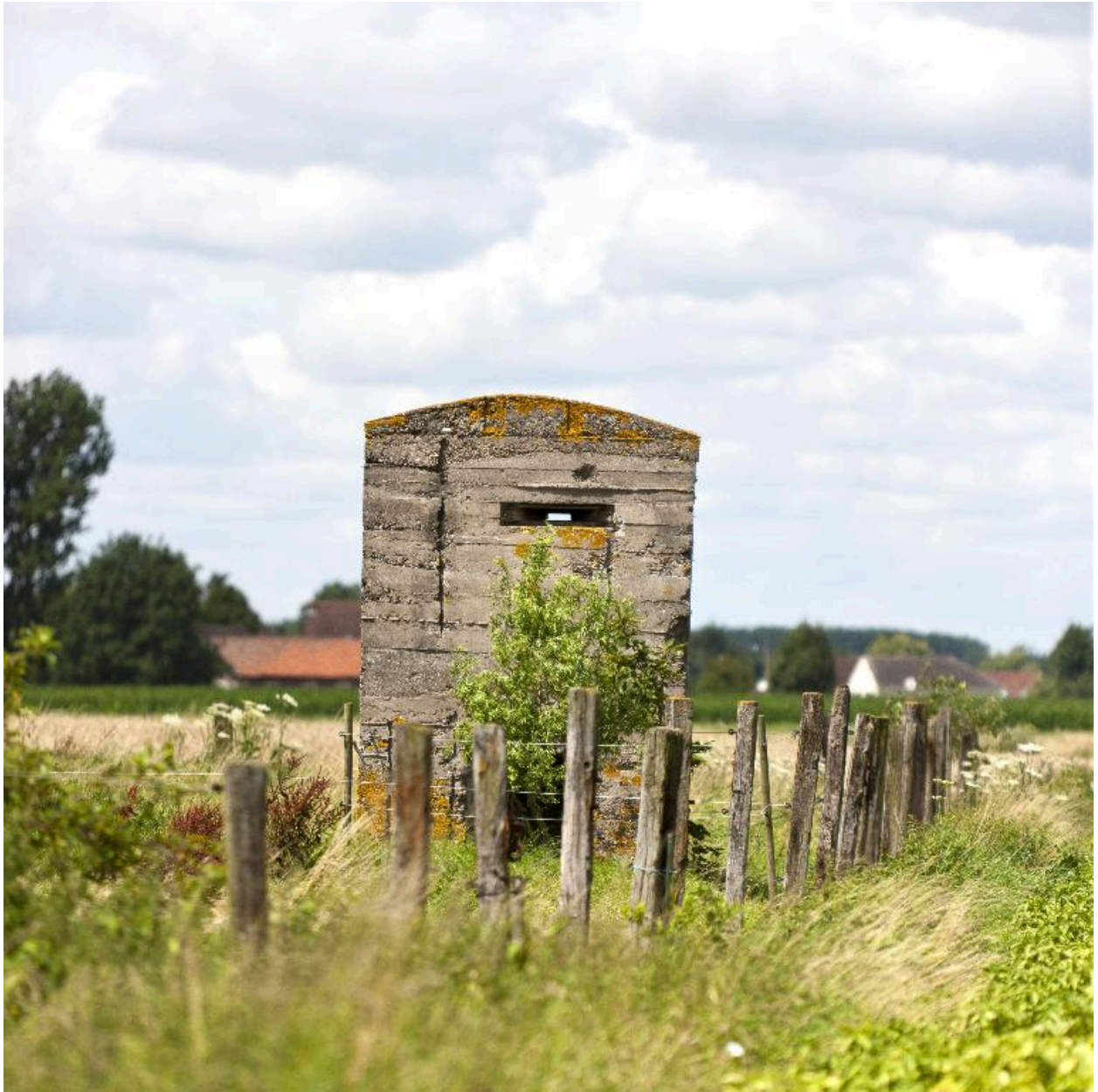
Vue générale vers le nord-ouest