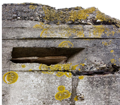
Ebrasure d'observation nord-est IVR31_20145904238NUCA