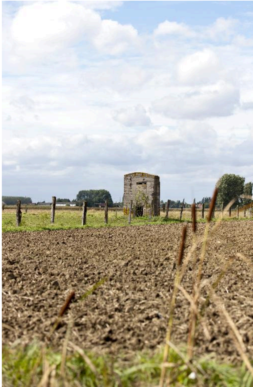
Vue générale vers le nord-ouest